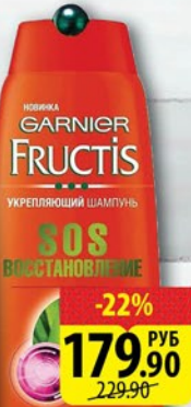
ШАМПУНЬ ФРУКТИС SOS Восстановление/ Тройное Восстановление 400мл