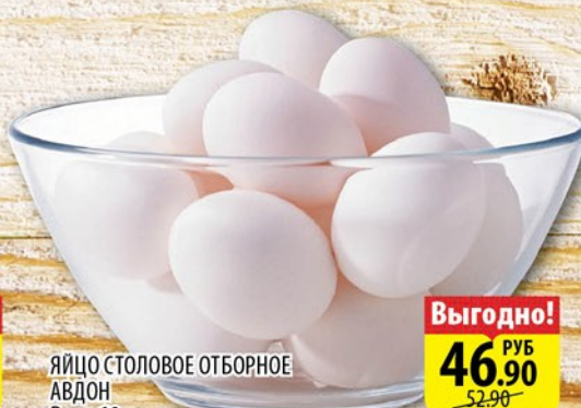
ЯЙЦО СТОЛОВОЕ ОТБОРНОЕ АВДОН В уп, 10шт