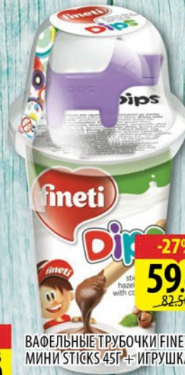
ВАФЕЛЬНЫЕ ТРУБОЧКИ FINETI МИНИ STICKS 45Г + ИГРУШКА