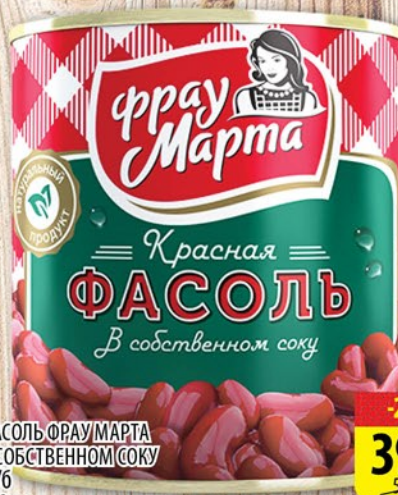
ФАСОЛЬ ФРАУМАРТА В СОБСТВЕННОМ СОКУ ж/б 310г