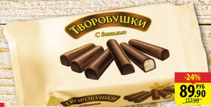
СЫРОК ТВОРОЖНЫЙ ГЛАЗИРОВАННЫЙ С ВАНИЛЬЮ ТВОРОБУШКИ 21% 180г