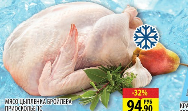
МЯСО ЦЫПЛЕНКА БРОЙЛЕРА ПРИОСКОЛЬЕ ТС замороз. фир. пакет 1кг