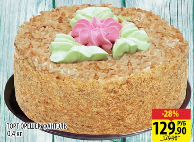
ТОРТ ОРЕШЕК ФАНТЭЛЬ 0,4 кг