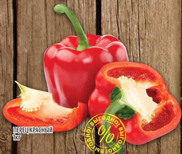
ПЕРЕЦ КРАСНЫЙ 1кг