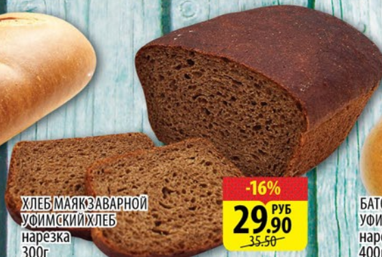
ХЛЕБ МАЯК ЗАВАРНОЙ УФИМСКИЙ ХЛЕБ нарезка 300г