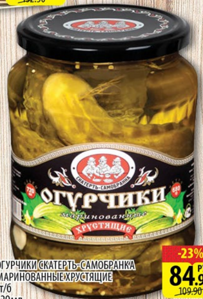
ОГУРЧИКИ СКАТЕРТЬ-САМОБРАНКА МАРИНОВАННЫЕ ХРУСТЯЩИЕ ст/б 720мл