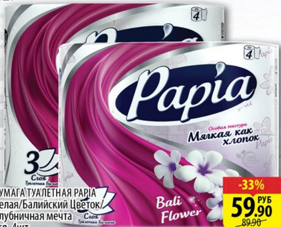
БУМАГА ТУАЛЕТНАЯ PAPIA Белая/Балийский Цветок/Клубничная мечта 3сл, 4шт