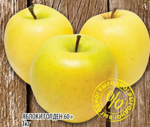
ЯБЛОКИ ГОЛДЕН 60+ 1кг