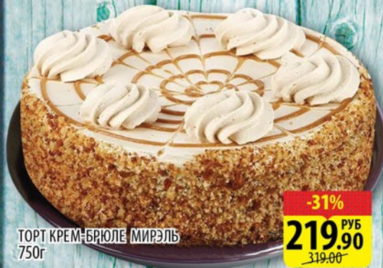
ТОРТ КРЕМ-БРИЮЛЕ МИРЭЛЬ 750г