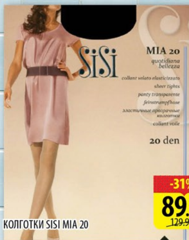
КОЛГОТКИ SISI MIA 20