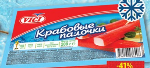
КРАБОВЫЕ ПАЛОЧКИ VICI 200г