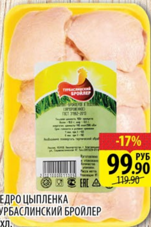
БЕДРО ЦЫПЛЕНКА ТУРБАСЛИНСКИЙ БРОЙЛЕР Охл. Подложка 1кг