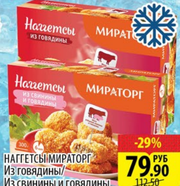
НАГГЕТСЫ МИРАТОРГ Из говядины/ Из свинины и говядины 300г