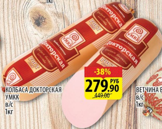
КОЛБАСА ДОКТОРСКАЯ УМКК В/С 1кг