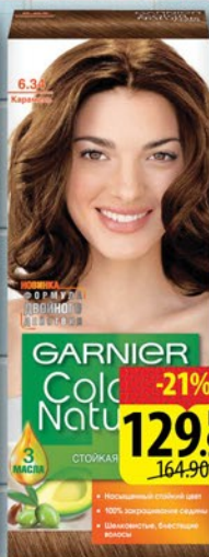
КРАСКА ДЛЯ ВОЛОС GARNIER COLOR NATURALS в ассортименте