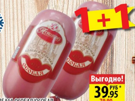
КОЛБАСА ОСОБАЯ/ОСОБАЯ СО ШПИКОМ АТЯШЕВО 0,4кг