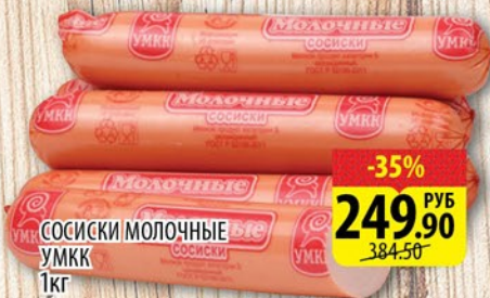
СОСИСКИ МОЛОЧНЫЕ УМКК 1кг