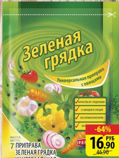
МАССА НЕТО: 7 ПРИПРАВА ЗЕЛЕНАЯ ГРЯДКА УНИВЕРСАЛЬНАЯ 75Г