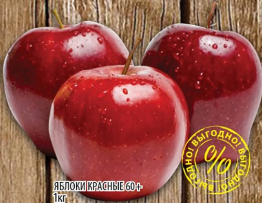
ЯБЛОКИ КРАСНЫЕ 60+ 1кг