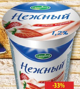
ЙОГУРТ КАМПИНА НЕЖНЫЙ 1,2% Клубника/Персик 320г