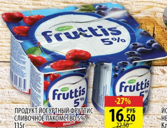
ПРОДУКТ ЙОГУРТНЫЙ ФРУТТИС СЛИВОЧНОЕ ЛАКОМСТВО 5% 115г в ассортименте