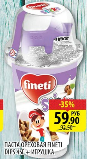
ПАСТА ОРЕХОВАЯ FINETI DIPS 45Г + ИГРУШКА