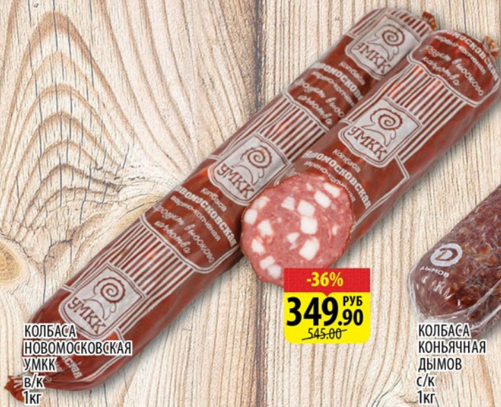
КОЛБАСА НОВОМОСКОВСКАЯ УМКК В/К 1кг