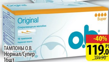
ТАМПОНЫ О.В. Нормал/Супер 16шт