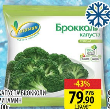
КАПУСТА БРОККОЛИ ВИТАМИН 400г