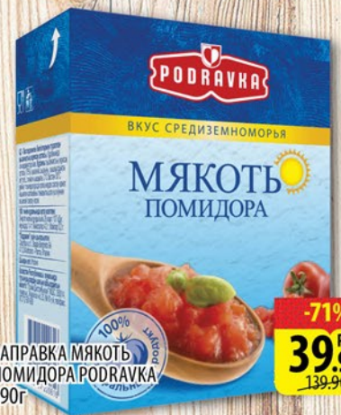
ЗАПРАВКА МЯКОТЬ ПОМИДОРА ПОДРАВНА 390г