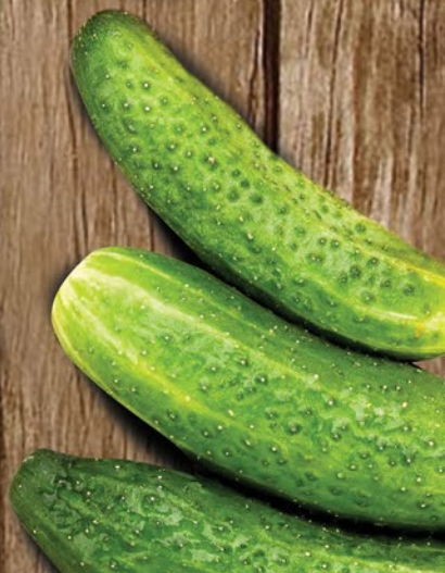
ОГУРЦЫ ПУПЫРЧАТЫЕ 1кг