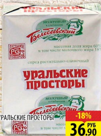
СПРЕД УРАЛЬСКИЕ ПРОСТОРЫ 60% 200г