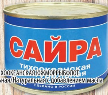
САЙРА ТИХООКЕАНСКАЯ ЮЖНОРЫБНОЕ НАТУРАЛЬНАЯ/НАТУРАЛЬНАЯ С ДОБАВЛЕНИЕМ МАСЛА 250г