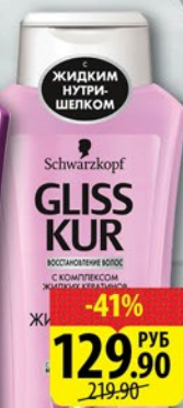
ШАМПУНЬ ГЛИССКУР Жидкий шелк для ломких волос/ Экстремальное восстановление/ Гиалурон+заполнитель 250мл