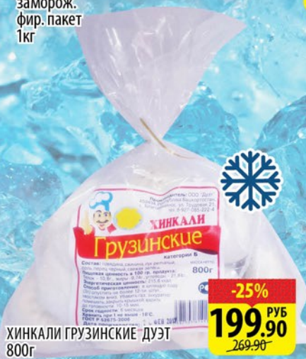
ХИНКАЛИ ГРУЗИНСКИЕ ДУЭТ 800г