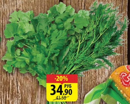
ПЕТРУШКА/УКРОП АГРОСТИЛЬ 100г