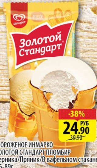
МОРОЖЕНОЕ ИНМАРКО ЗОЛОТОЙ СТАНДАРТ ПЛОМБИР Черника/Пряник/В вафельном стакане 86-89г