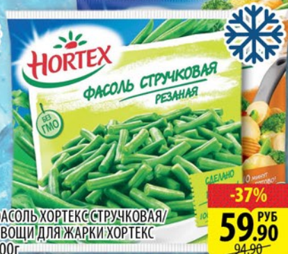
ФАСОЛЬ ХОРТЕКС СТРУЧКОВАЯ/ ОВОЩИ ДЛЯ ЖАРКИ ХОРТЕКС 400г