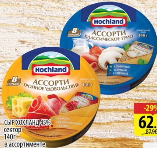
СЫР ХОХЛАНД 45% сектор 140г в ассортименте