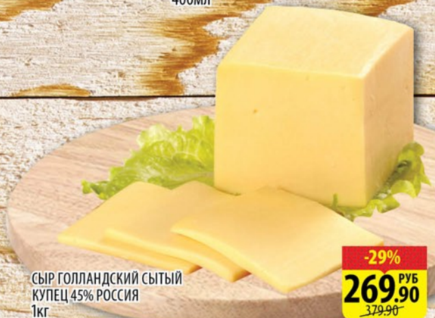
СЫР ГОЛЛАНДСКИЙ СЫТЫЙ КУПЕЦ 45% РОССИЯ 1кг