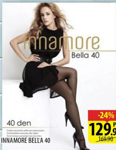
КОЛГОТКИ INNAMORE BELLA 40