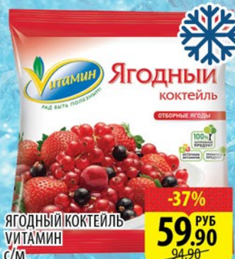
ЯГОДНЫЙ КОКТЕЙЛЬ ВИТАМИН с/м 300г