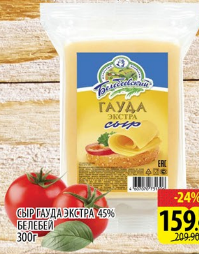
СЫР ГАУДА ЭКСТРА 45% БЕЛЕБЕЙ 300г