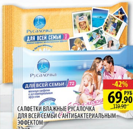
САЛФЕТКИ ВЛАЖНЫЕ РУСАЛОЧКА ДЛЯ ВСЕЙ СЕМЬИ С АНТИБАКТЕРИАЛЬНЫМ ЭФФЕКТОМ 72шт