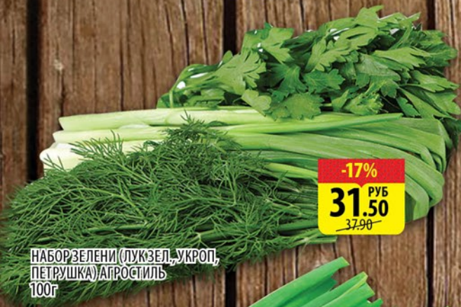
НАБОР ЗЕЛЕНИ (ЛУК ЗЕЛ., УКРОП, ПЕТРУШКА) АГРОСТИЛЬ 100г