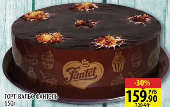
ТОРТ ВАЛЬС ФАНТЭЛЬ 650г