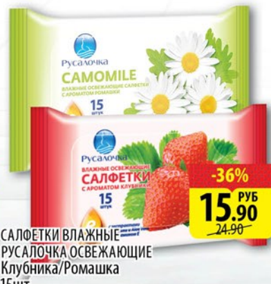
САЛФЕТКИ ВЛАЖНЫЕ РУСАЛОЧКА ОСВЕЖАЮЩИЕ Клубника/Ромашка 15шт