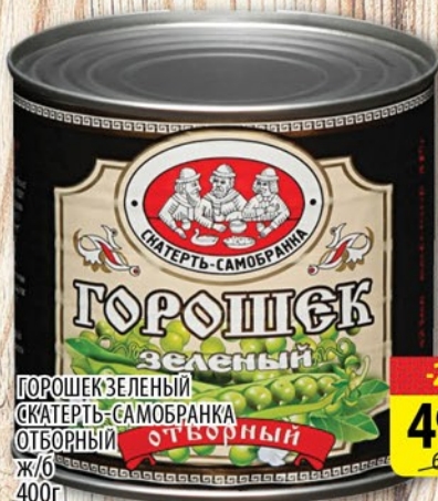
ГОРОШЕК ЗЕЛЕНЫЙ СКАТЕРТЬ-САМОБРАНКА ОТБОРНЫЙ ж/б 400г