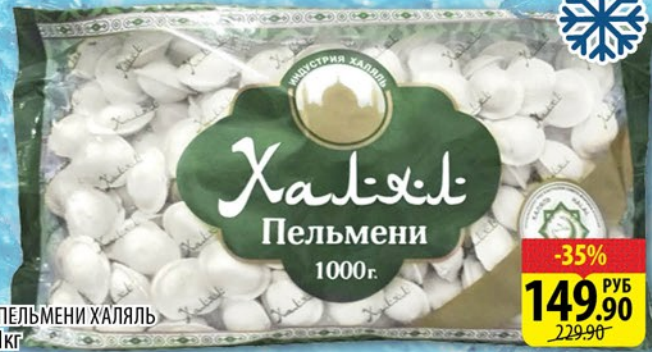
ПЕЛЬМЕНИ ХАЛЯЛЬ 1кг