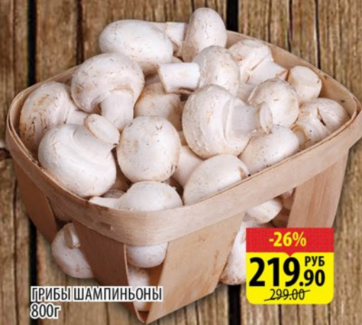
ГРИБЫ ШАМПИНЬОНЫ 800г