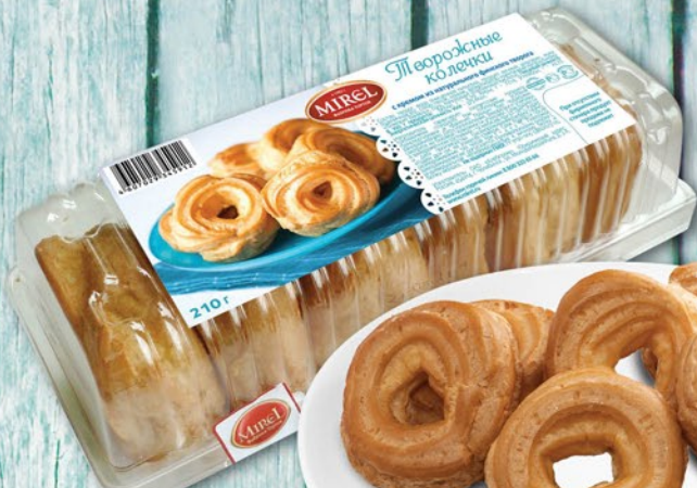
ПИРОЖНЫЕ ТВОРОЖНЫЕ КОЛЕЧКИ МИРЭЛЬ 210г