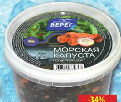
САЛАТ ИЗ МОРСКОЙ КАПУСТЫ БАЛТИЙСКИЙ БЕРЕГ НАХОДКА пл/б 250г