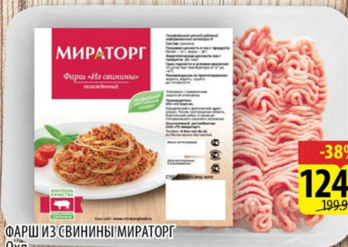
ФАРШ ИЗ СВИНИНЫ МИРАТОРГ Охл. Лоток 500г