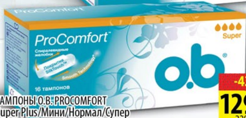
ТАМПОНЫ О.В. PROCOMFORT Super Plus/Мини/Нормал/Супер 16шт