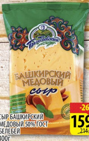
СЫР БАШКИРСКИЙ МЕДОВЫЙ 50% ГОСТ БЕЛЕБЕЙ 300г