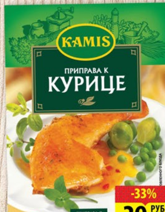
ПРИПРАВА КАМИС К плову/К мясу/К курице 25г/30г