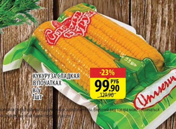
КУКУРУЗА СЛАДКАЯ В ПОЧАТКАХ в/у 1шт