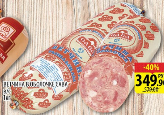
ВЕТЧИНА В ОБОЛОЧКЕ САВА В/С 1кг