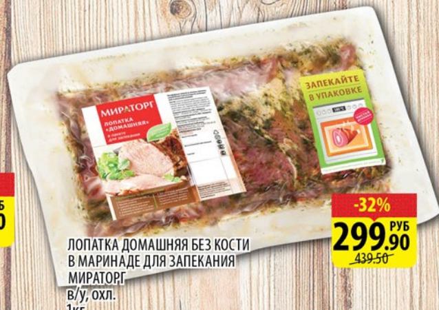
ЛОПАТКА ДОМАШНЯЯ БЕЗ КОСТИ В МАРИНАДЕ ДЛЯ ЗАПЕКАНИЯ МИРАТОРГ В/у, охл. 1кг