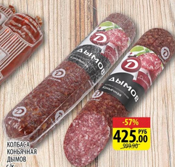
КОЛБАСА КОНЬЯЧНАЯ ДЫМОВ С/К 1кг