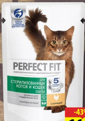
КОРМ PERFECT FIT Для взрослых/Для стерилизованных кошек 85г