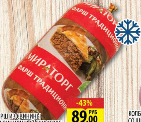
ФАРШ ИЗ СВИНИНЫ ТРАДИЦИОННЫЙ МИРАТОРГ С/М батон 500г