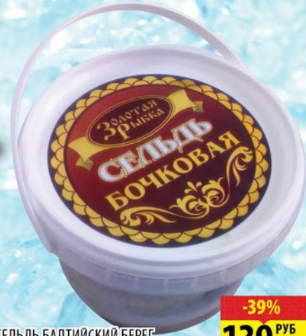
СЕЛЬДЬ БАЛТИЙСКИЙ БЕРЕГ ПО-ЦАРСКИ С УКРОПОМ/СЕЛЬДЬ БОЧКОВАЯ ФИЛЕ В МАСЛЕ ЗОЛОТАЯ РЫБКА пл/б 500г