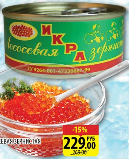
ИКРА ЛОСОСЕВАЯ ЗЕРНИСТАЯ РУССКАЯ с/к, ТУ ж/б 95г