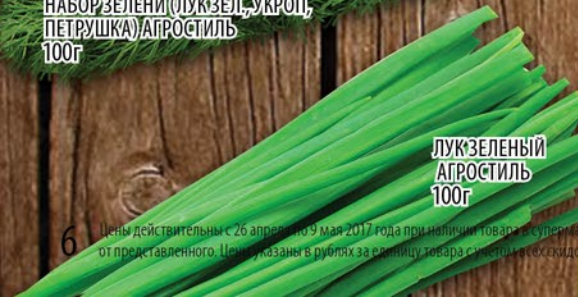
ЛУК ЗЕЛЕНЬ АГРОСТИЛЬ 100г