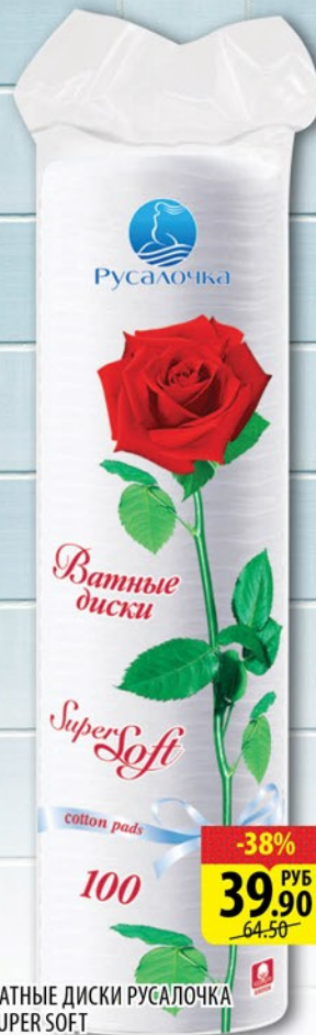
ВАТНЫЕ ДИСКИ РУСАЛОЧКА SUPER SOFT 100шт