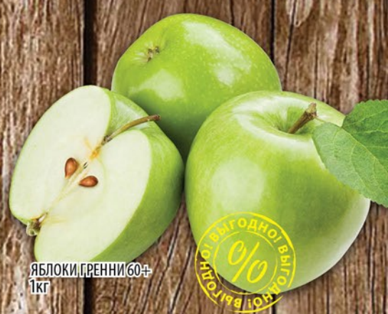
ЯБЛОКИ ГРЕННИ 60+ 1кг