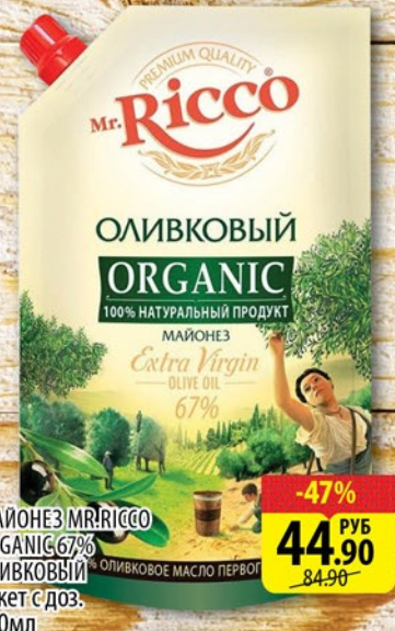
МАЙОНЕЗ MR.RICCO ORGANIC 67% ОЛИВКОВЫЙ пакет с доз. 400мл