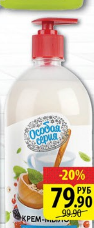
МЫЛО ЖИДКОЕ ОСОБАЯ СЕРИЯ С ДОЗАТОРОМ Овсяное молочко/Ягодный джем 1л