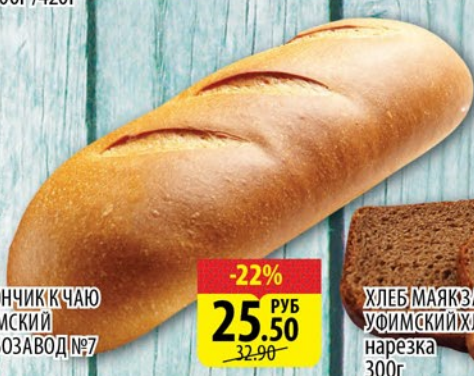
БАТОНЧИК К ЧАЮ УФИМСКИЙ ХЛЕБОЗАВОД №7 300г