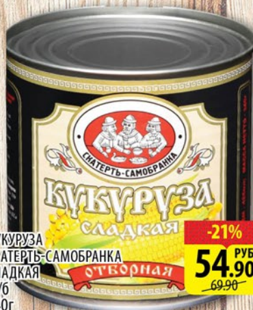
КУКУРУЗА СКАТЕРТЬ-САМОБРАНКА СЛАДКАЯ ж/б 340г