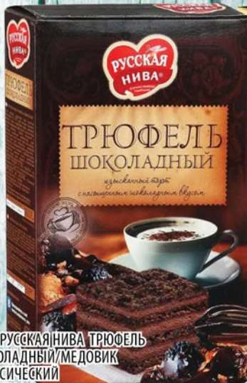
ТОРТ РУССКАЯ НИВА ТРЮФЕЛЬ ШОКОЛАДНЫЙ/МЕДОВИК КЛАССИЧЕСКИЙ 400г / 420г