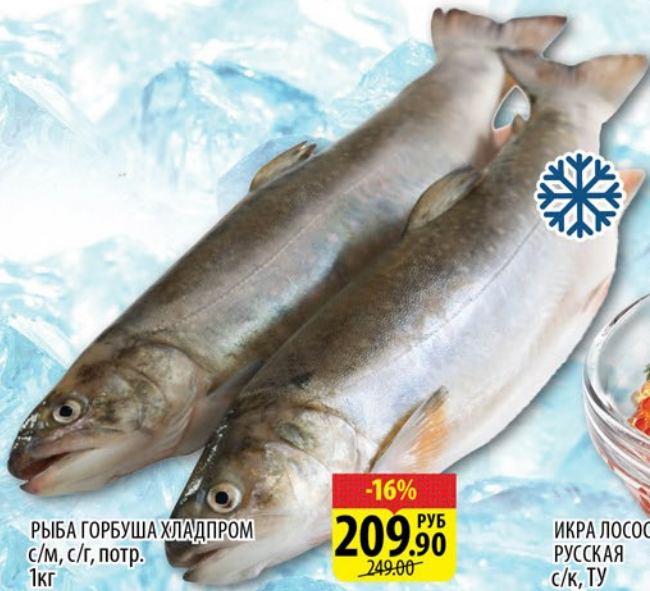
РЫБА ГОРБУША ХЛАДПРОМ с/м, с/г, потр. 1кг