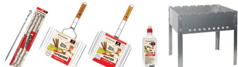
Союзгриль: набор шампуров больших «ЭНТУЗИАСТ», 55 см Союзгриль: Решетка-гриль с регулируемой высотой «ПЕРЕДОВИК», 22x35 см Союзгриль: решетка-гриль с регулируемой высотой «МАСТЕР», 24x31 см Союзгриль: Жидкость для розжига «ЗАРЯДКА», 1 л Союзгриль: Мангал «КОСТРОВОЙ-2», 35x25 см