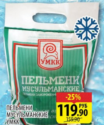
ПЕЛЬМЕНИ МУСУЛЬМАНСКИЕ УМКК 800г