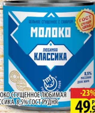
МОЛОКО СГУЩЕННОЕ ЛЮБИМАЯ КЛАССИКА 8,5% ГОСТ РУДНЯ ж/б 380г