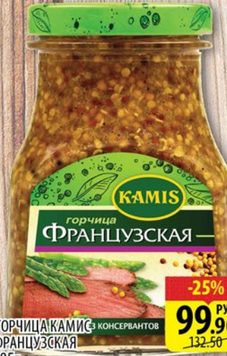
ГОРЧИЦА КАМИС С КОНСЕРВАНТОМ ФРАНЦУЗСКАЯ 185Г