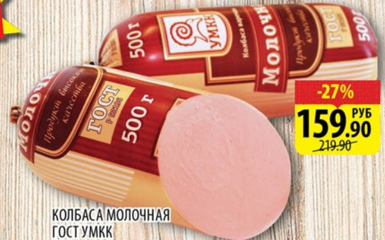
КОЛБАСА МОЛОЧНАЯ ГОСТ УМКК 500г

*ЦЕНА ДЕЙСТВИТЕЛЬНА ЗА ЕДИНИЦУ ТОВАРА ПРИ ПОКУПКЕ 2-Х ШТУК ЕДИНОВРЕМЕННО ЛЮБОГО ВКУСА