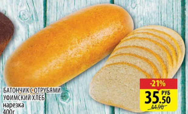
БАТОНЧИК С ОТРУБЯМИ УФИМСКИЙ ХЛЕБ нарезка 400г