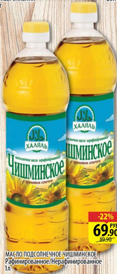
МАСЛО ПОДСОЛНЕЧНОЕ ЧИШМИНСКОЕ Рафинированное/Нерафинированное 1л