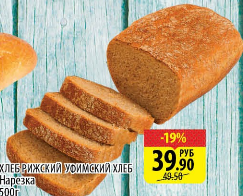
ХЛЕБ РИЖСКИЙ УФИМСКИЙ ХЛЕБ Нарезка 500г