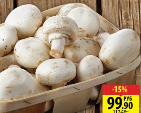
ПРИБЫ ШАМПИНЬОНЫ АГРОСТИЛЬ 300г