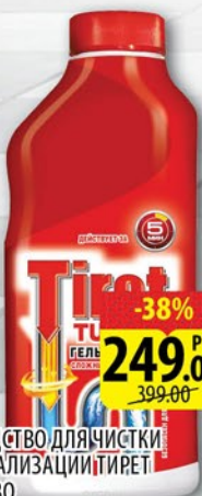
СРЕДСТВО ДЛЯ ЧИСТКИ КАНАЛИЗАЦИИ ТИРЕТ TURBO 500мл