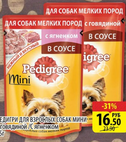
ПЕДИГРИ ДЛЯ ВЗРОСЛЫХ СОБАК МИНИ С ГОВЯДИНОЙ /С ЯГНЕНКОМ 85г

ЦЕНА ДЕЙСТВИТЕЛЬНА ЗА ЕДИНИЦУ ТОВАРА ПРИ ПОКУПКЕ 5 ШТУК ЕДИНОВРЕМЕННО ЛЮБОГО ВИДА