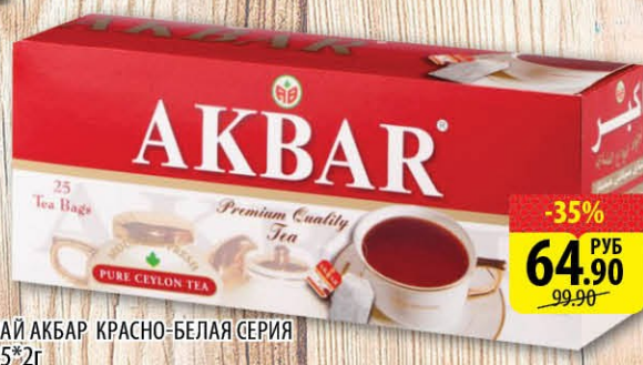
ЧАЙ АКВАР КРАСНО-БЕЛАЯ СЕРИЯ 25*2г -35% 64.90 РУБ 99.90