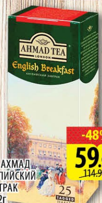
ЧАЙ АХМАД АНГЛИЙСКИЙ ЗАВТРАК 25*2г -48% 59.90 РУБ 114.90