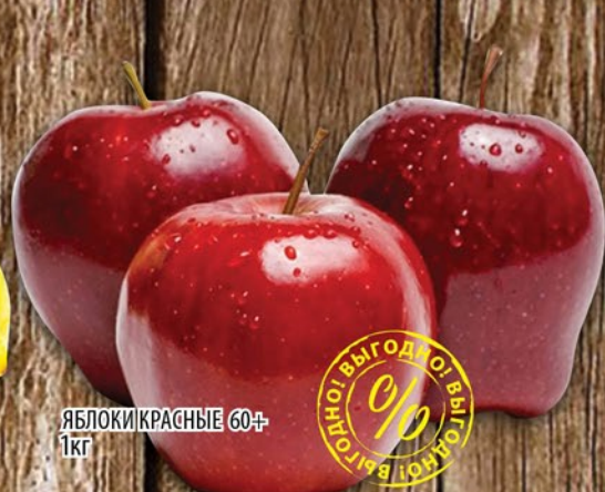
ЯБЛОКИ КРАСНЫЕ 60+ 1кг