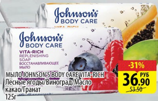
МЫЛО JOHNSON'S BODY CARE VITA-RICH REPLENISHING SOAP ВОССТАНАВЛИВАЮЩЕЕ МЫЛО Лесные ягоды/Виноград/Масло какао/Гранат 125г