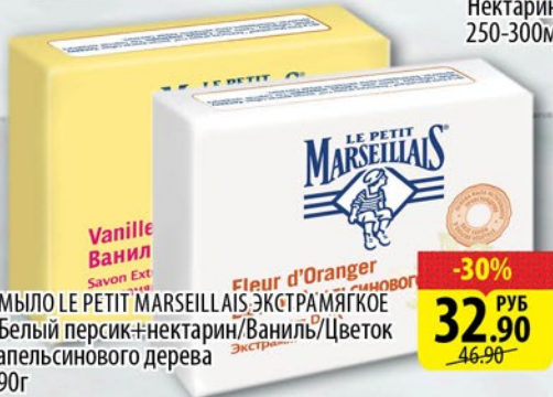
МЫЛО LE PETIT MARSEILLAIS Экстремально мягкое Белый персик+нектарин/Ваниль/Цветок апельсина/Оранжевый 90г