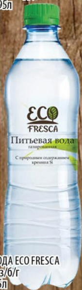
ВОДА ECO FRESCA газ/б/г 1,5л