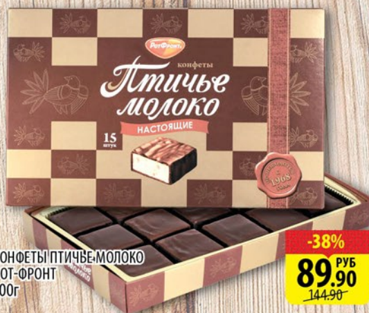
КОНФЕТЫ ПТИЧЬЕ-МОЛОКО РОТ-ФРОНТ 200г