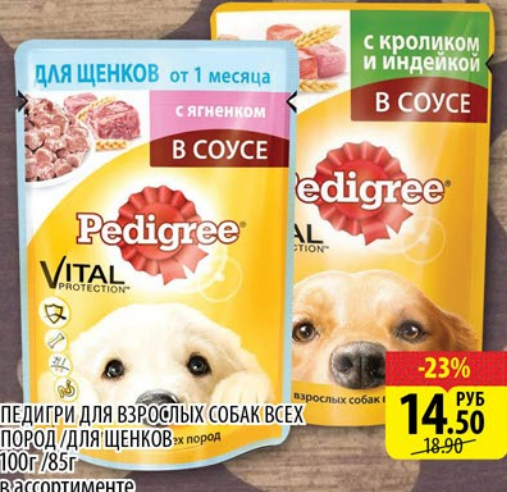
ПЕДИГРИ ДЛЯ ВЗРОСЛЫХ СОБАК ВСЕХ ПОРОД /ДЛЯ ЩЕНКОВ 100г/85г в ассортименте