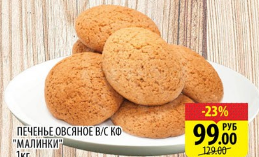
ПЕЧЕНЬЕ ОВСЯНОЕ В/С КФ "МАЛИНКИ" 1кг