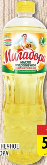
МАСЛО ПОДСОЛНЕЧНОЕ МИЛАДОРА 0,9л