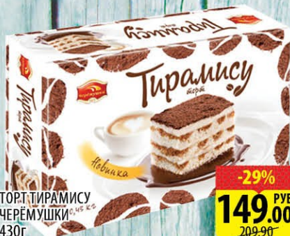
ТОРТ ТИРАМИСУ ЧЕРЕМУШКИ 430г