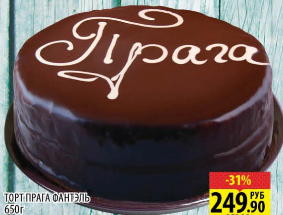
ТОРТ ПРАГА ФАНТЭЛЬ 650г