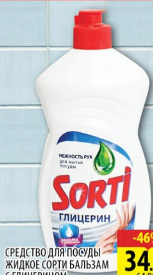
СРЕДСТВО ДЛЯ ПОСУДЫ ЖИДКОЕ СОРТИ БАЛЬЗАМ С ГЛИЦЕРИНОМ 500мл