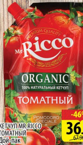
КЕТЧУП MR.RICCO ТОМАТНЫЙ Дой-пак 350г