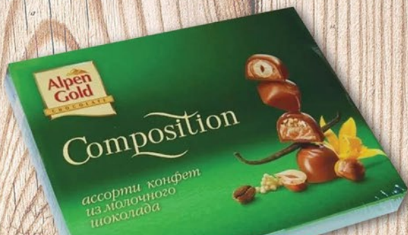
КОНФЕТЫ ALPEN GOLD COMPOSITION МОЛОЧНЫЙ ШОКОЛАД 142г