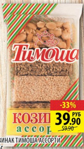
КОЗИНАК ТИМОША АССОРТИ 225г