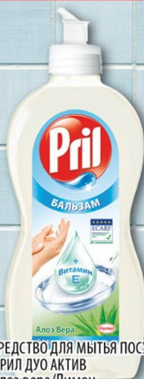
СРЕДСТВО ДЛЯ МЫТЬЯ ПОСУДЫ ПРИЛ/ ПРИЛ ДУО АКТИВ Алоэ вера/Лимон 450мл