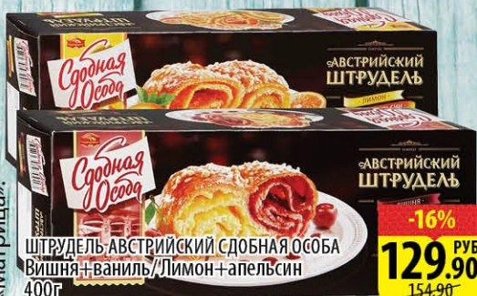
ШТРУДЕЛЬ АВСТРИЙСКИЙ СДОБНАЯ ОСОБА ВИШНЯ+ваниль/Лимон+апельсин 400г