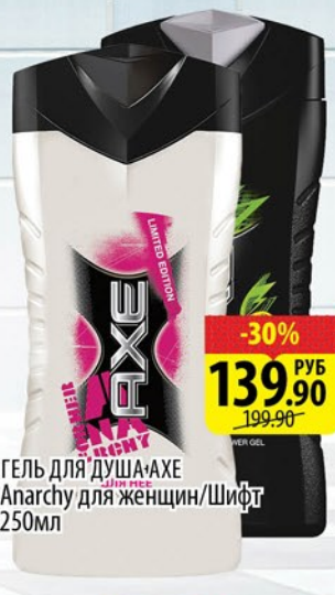
ГЕЛЬ ДЛЯ ДУША AXE Anarchy для женщин/Шифт 250мл