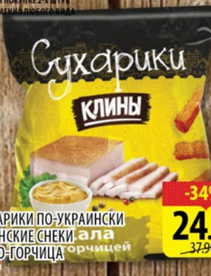
СУХАРИКИ ПО-УКРАИНСКИ КЛИНСКИЕ СНЕКИ САЛО-ГОРЧИЦА 100г