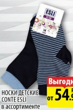
НОСКИ ДЕТСКИЕ CONTE ES1 в ассортименте