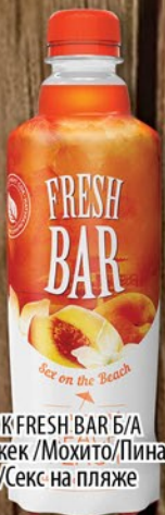
НАПИТОК FRESH BAR Б/А Блэк/Джек/Мохито/Пина Колада/Секс на пляже пл/б 0,48л