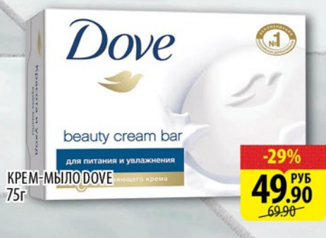
КРЕМ-МЫЛО DOVE 75г