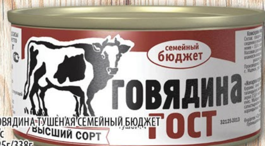
ГОВЯДИНА ТУШЕНАЯ СЕМЕЙНЫЙ БЮДЖЕТ В/С 325г/338г