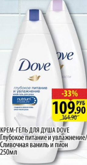
КРЕМ-ГЕЛЬ ДЛЯ ДУША DOVE Глубокое питание и увлажнение/ Сливочная ваниль и пион 250мл