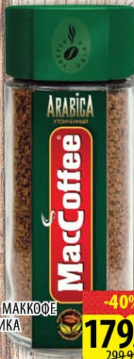
КОФЕ МАККОФЕ АРАБИКА Ст/б 100г -40% 179.90 РУБ 299.90