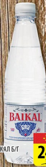
ВОДА БАЙКАЛ Б/Г пл/б 0,5л