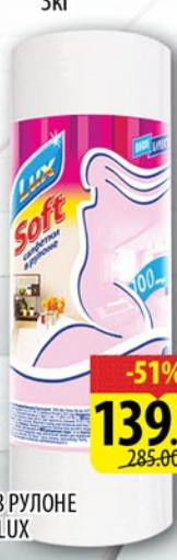
САЛФЕТКИ В РУЛОНЕ ЛЮКС SOFT LUX 100шт