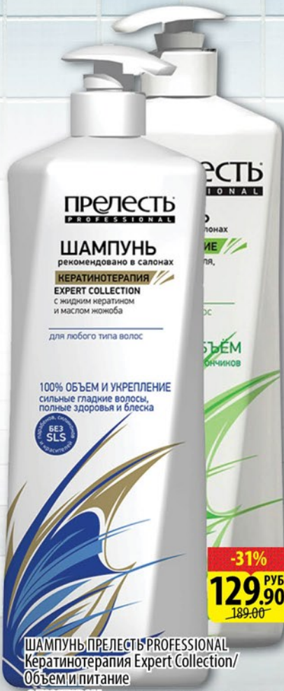
ШАМПУНЬ ПРЕЛЕСТЬ PROFESSIONAL Кератинотерапия Expert Collection/ Объем и питание с дозатором 600мл