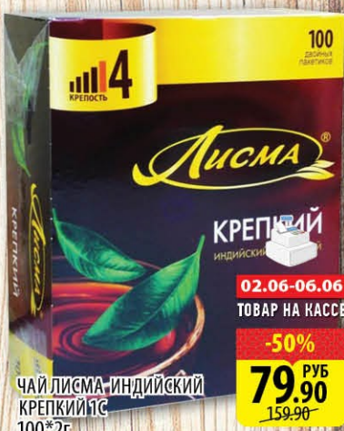
ЧАЙ ЛИСМА-ИНДИЙСКИЙ КРЕПКИЙ 100*2г -50% 79.90 РУБ 159.90