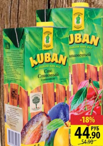
СОК КУБАН Яблочный/Сливовый/ Грушевый/Томатный 1л