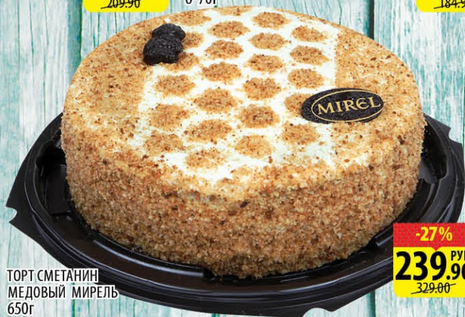
ТОРТ СМЕТАНИ МЕДОВЫЙ МИРЭЛЬ 650г