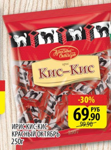
ИРИСКИ-КИС КРАСНЫЙ ОКТЯБРЬ 250г