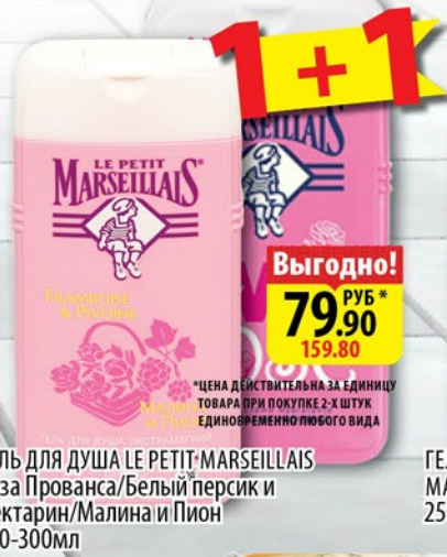
ГЕЛЬ ДЛЯ ДУША LE PETIT MARSEILLAIS Роза Прованса/Белый персик и Нектарин/Малина и Пион 250-300мл