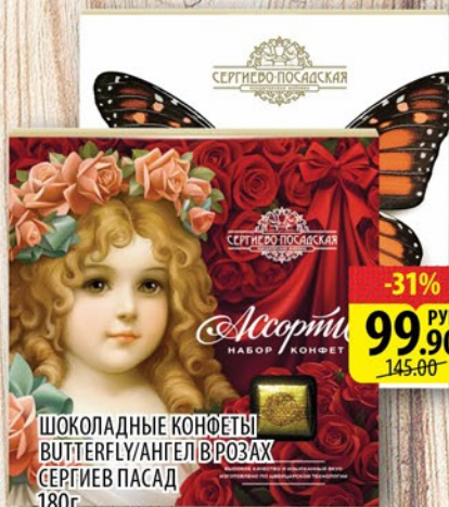
ШОКОЛАДНЫЕ КОНФЕТЫ BUTTERFLY/АНГЕЛ В РОЗАХ СЕРГИЕВ ПАСАД 180г