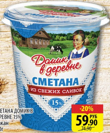
СМЕТАНА ДОМИК В ДЕРЕВНЕ 15% Стакан 330г