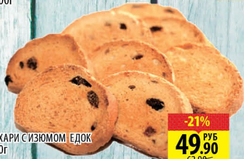
СУХАРИ СИЗЬЮМОМ ЕДОК 300г