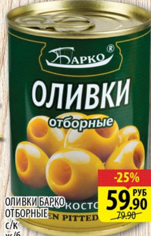
ОЛИВКИ БАРКО ОТБОРНЫЕ С/К Ж/Б 280г

*ЦЕНА ДЕЙСТВИТЕЛЬНА ЗА ЕДИНИЦУ ТОВАРА ПРИ ПОКУПКЕ 3-Х ШТУК ЕДИНОВРЕМЕННО ЛЮБОГО ВИДА