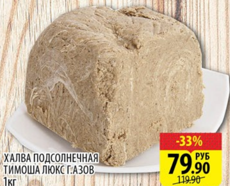
ХАЛВА ПОДСОЛНЕЧНАЯ ТИМОША ЛЮКС Г.АЗОВ 1кг