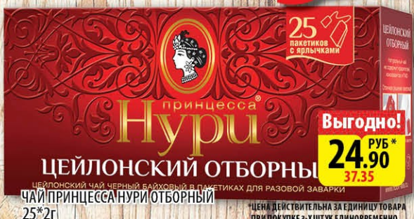
ЧАЙ ПРИНЦЕССА НУРИ ОТБОРНЫЙ 25*2г Выгодно! 24.90 РУБ * 37.35