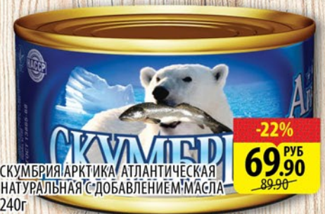
СКУММЕР АРКТИКА АТЛАНТИЧЕСКАЯ НАТУРАЛЬНАЯ С ДОБАВЛЕНИЕМ МАСЛА 240г