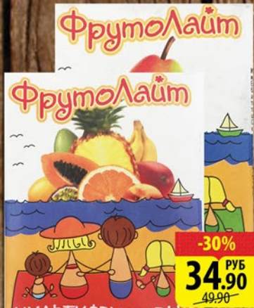
НАПИТОК СОКОСодержащий ФРУТОЛАЙТ Яблочный/Грушевый/ Мультифруктовый 0,95л