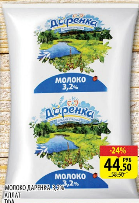
МОЛОКО ДАРЕНКА 3,2% АЛЛАТ ТФА 0,9л