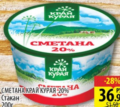
СМЕТАНА КРАЙ КУРАЯ 20% Стакан 200г