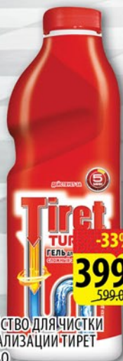
СРЕДСТВО ДЛЯ ЧИСТКИ КАНАЛИЗАЦИИ ТИРЕТ TURBO 1л