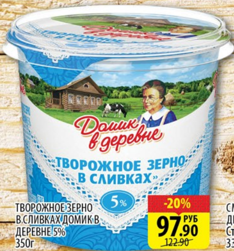
ТВОРОЖНОЕ ЗЕРНО В СЛИВКАХ ДОМИК В ДЕРЕВНЕ 5% 350г