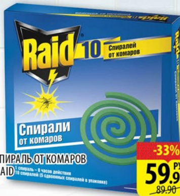
СПИРАЛЬ ОТ КОМАРОВ RAID