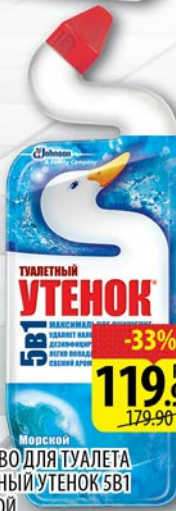
СРЕДСТВО ДЛЯ ТУАЛЕТА ТУАЛЕТНЫЙ УТЕНОК СВТ МОРСКОЙ 750мл