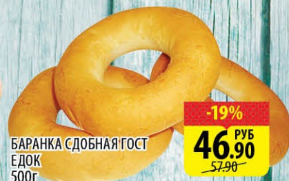
БАРАНКА СДОБНАЯ ГОСТ ЕДОК 500г