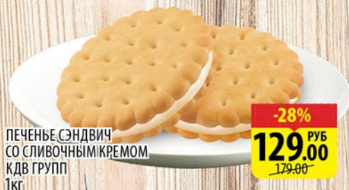
ПЕЧЕНЬЕ СЭНДВИЧ СО СЛИВОЧНЫМ КРЕМОМ КДВ ГРУПП 1кг