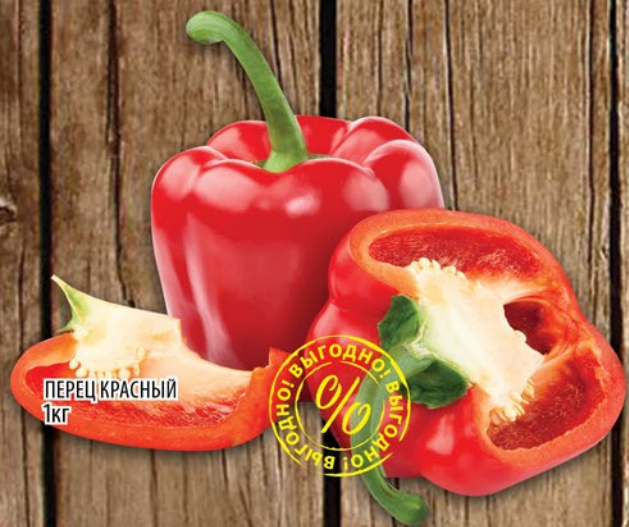
ПЕРЕЦ КРАСНЫЙ 1кг