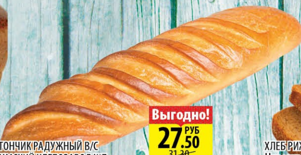
БАТОНЧИК РАДУЖНЫЙ В/С УФИМСКИЙ ХЛЕБОЗАВОД №7 250г