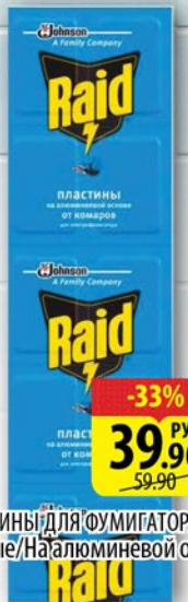
ПЛАСТИНЫ ДЛЯ ФУМИГАТОРА RAID Желтые/Натюлюминевой основе Синие 10шт