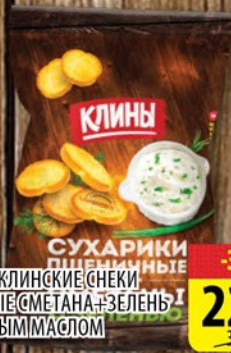
СУХАРИКИ КЛИНСКИЕ СНЕКИ ПШЕНИЧНЫЕ СМЕТАНА+ЗЕЛЕНЬ СОЛИВКОВЫМ МАСЛОМ 50г