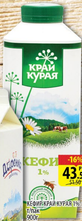
КЕФИР КРАЙ КУРАЯ 1% Т/пак 900г