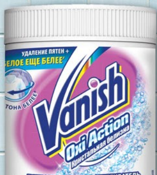
ПЯТНОВЫВОДИТЕЛЬ ПОРОШОК ВАНИШ ОХИ АКЦИОН, ОТБЕЛИВАТЕЛЬ ДЛЯ БЕЛЫХ ТКАНЕЙ 500г