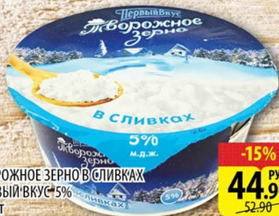
ТВОРОЖНОЕ ЗЕРНО В СЛИВКАХ ПЕРВЫЙ ВКУС 5% пл/ст 130г