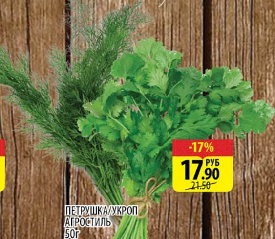
ПЕТРУШКА/УКРОП АГРОСТИЛЬ 50г