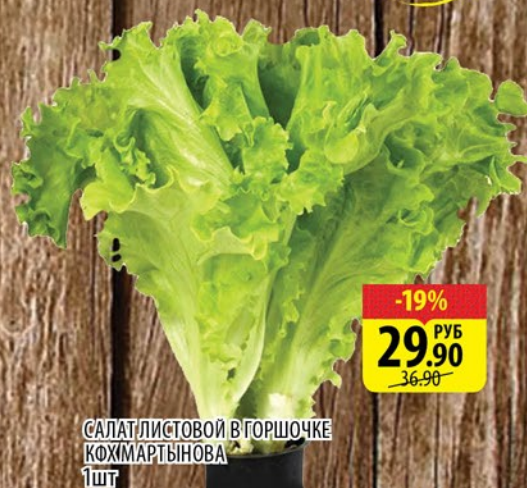
САЛАТ ЛИСТОВОЙ В ГОРШОЧКЕ КОХМАРТЫНОВА 1шт