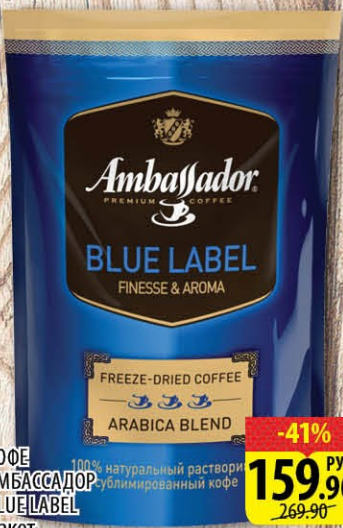
КОФЕ АМБАССАДОР BLUE LABEL 100% натуральный растворимый кофе Пакет 75г -41% 159.90 РУБ 269.90