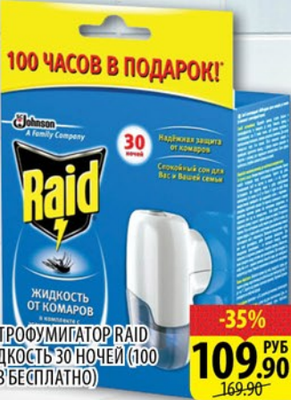
ЭЛЕКТРОФУМИГАТОР RAID + ЖИДКОСТЬ 30 НОЧЕЙ (100 ЧАСОВ БЕСПЛАТНО)