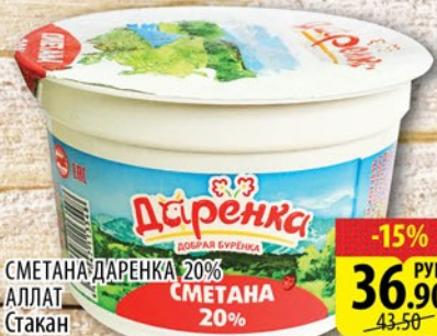
СМЕТАНА ДАРЕНКА 20% АЛЛАТ Стакан 200г