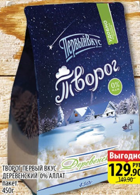
ТВОРОГ ПЕРВЫЙ ВКУС ДЕРЕВЕНСКИЙ 0% АЛЛАТ пакет 450г