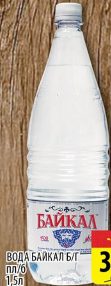
ВОДА БАЙКАЛ Б/Г пл/б 1,5л