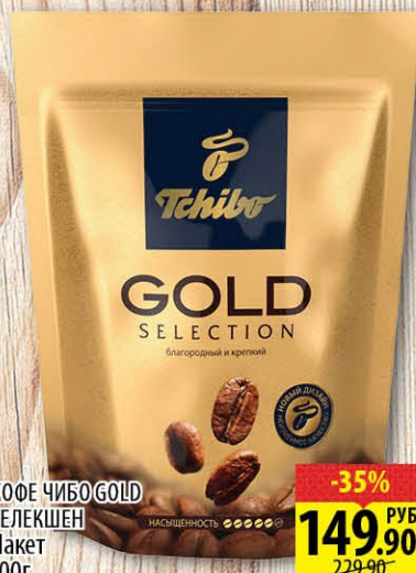
КОФЕ ЧИБО GOLD СЕЛЕКШЕН Пакет 100г -35% 149.90 РУБ 229.90