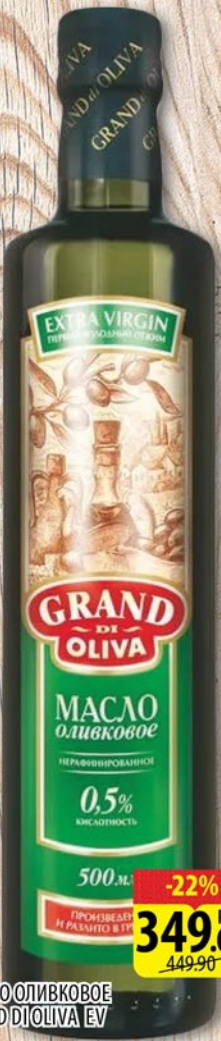
МАСЛО ОЛИВКОВОЕ GRAND OLIVA EV СТ/Б 0,5л