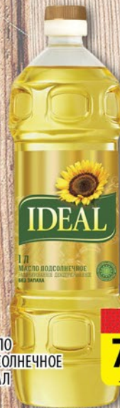
МАСЛО ПОДСОЛНЕЧНОЕ ИДЕАЛ 1л