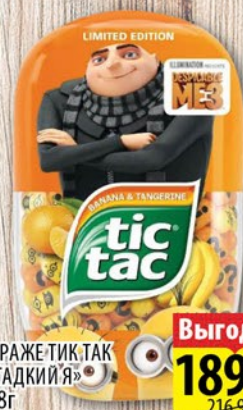
ДРАЖЕ-ТИК-ТАК «ГАДКИЙ Я» 98г