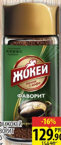
КОФЕ ЖОКЕЙ ФАВОРИТ Ст/б 100г -16% 129.90 РУБ 154.90