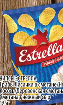
ЧИПСЫ ЭСТРЕЛЛА Грибы/Лисички в сметане/Нежный лосось/Деревенская сметана+лук/ Сметана+нежный сыр 125г