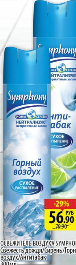
ОСВЕЖИТЕЛЬ ВОЗДУХА SYMPHONY Свежесть дождя/Сирень/Горный воздух/Антибак 300мл