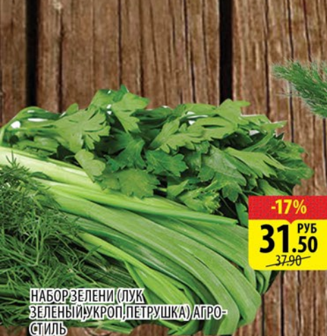
НАБОР ЗЕЛЕНИ (ЛУК, ЗЕЛЕНЬ, УКРОП, ПЕТРУШКА) АГРО- СТИЛЬ 100г