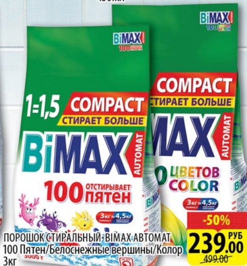
ПОРОШОК СТИРАЛЬНЫЙ ВІМАХ АВТОМАТ 100 Пятен/Белоснежные вершины/Колор 3кг