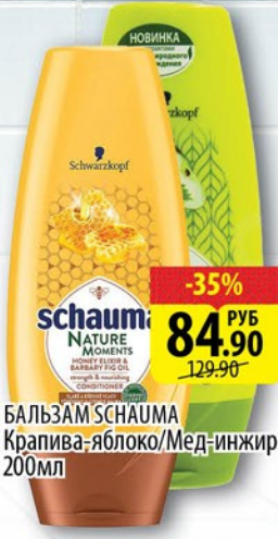
БАЛЬЗАМ SCHAUMA Крапива-яблоко/Мед-инжир 200мл