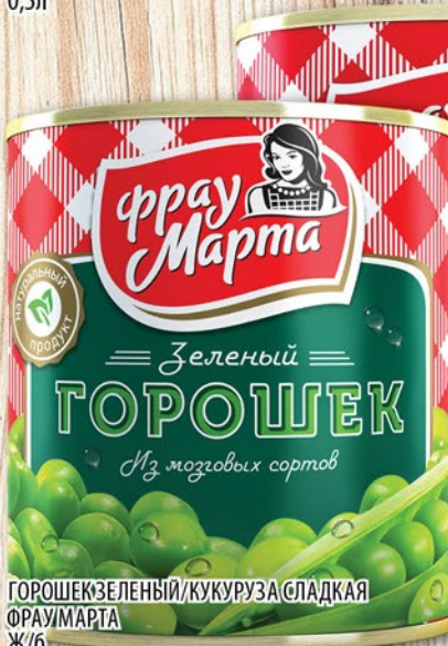
ГОРОШЕК ЗЕЛЕНЫЙ / КУКУРУЗА СЛАДКАЯ ФРАУМАРТА Ж/Б 310г