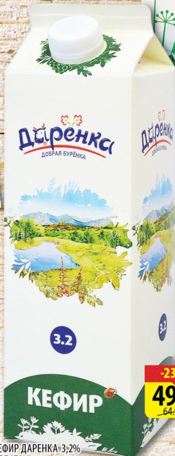
КЕФИР ДАРЕНКА 3,2% АЛЛАТ пюр-пак с крышкой 950г