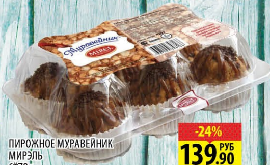
ПИРОЖНОЕ МУРАВЕЙНИК МИРЭЛЬ 6*70г