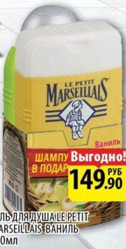
ГЕЛЬ ДЛЯ ДУША LE PETIT MARSEILLAIS ВАНИЛЬ 250мл