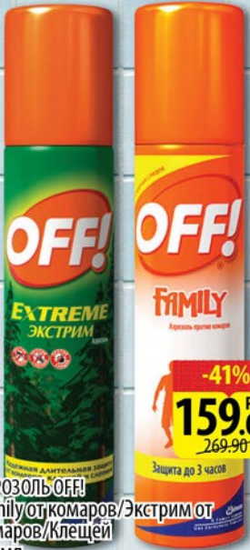
АЭРОЗОЛЬ OFF! Family от комаров/Экстрим от комаров/Клещей 100мл