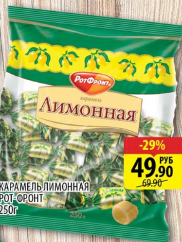
КАРАМЕЛЬ ЛИМОННАЯ РОТ-ФРОНТ 250г