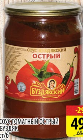
СОУС ТОМАТНЫЙ ОСТРЫЙ БУЗДЯК СТ/Б 670г