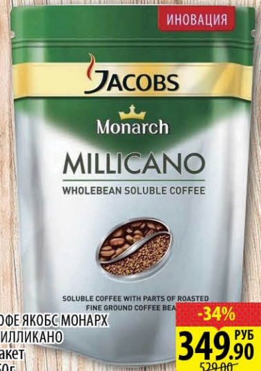
КОФЕ ЯКОБС МОНАРХ МИЛЛИКАНО Пакет 150г -34% 349.90 РУБ 529.00