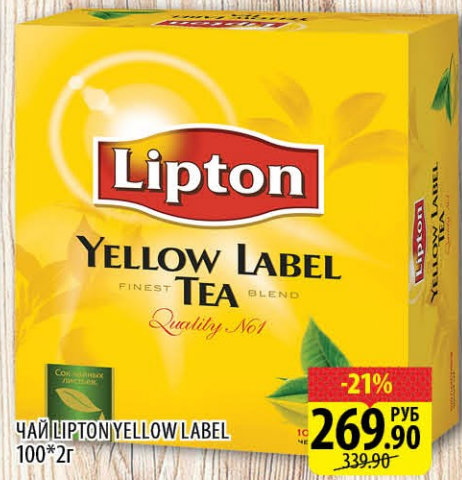
ЧАЙ ЛИПТОН YELLOW LABEL 100*2г -21% 269.90 РУБ 339.90