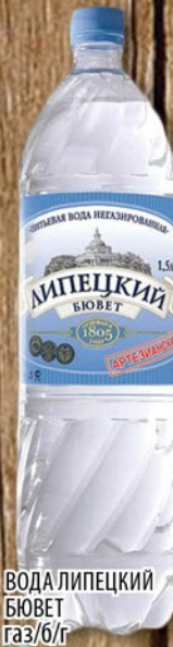
ВОДА ЛИПЕЦКИЙ БЮЕТ газ/б/г 1,5л