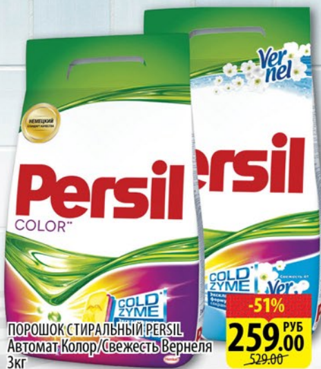
ПОРОШОК СТИРАЛЬНЫЙ PERSIL Автомат/Колор/свежесть Вернеля 3кг