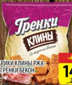
СУХАРИКИ КЛИНЫ РЖА- НЫЕ ГРЕНКИ БЕКОН 40г