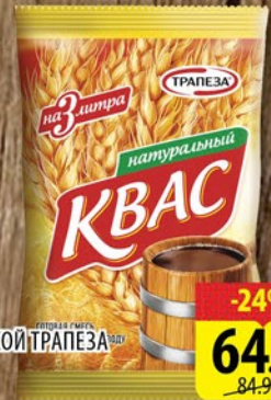
КВАС СУХОЙ ТРАПЕЗА 240г