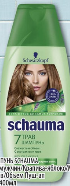
ШАМПУНЬ СCHAUMA Для мужчин/Крапива-яблоко/Мед-инжир/ 7 трав/Объем Пуш-ап 380-400мл

С НАМИ ПРОЩЕ! МЫ ПРЕДОСТАВЛЯЕМ СКИДКИ, НЕ ТРЕБУЯ ДИСКОНТНЫХ КАРТ!