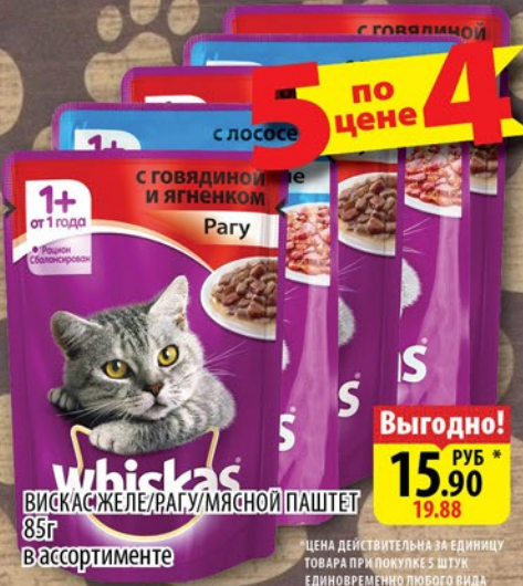
ВИСКАС ЖЕЛЕ/РАГУ МЯСНОЙ ПАШТЕТ 85г в ассортименте