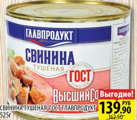
СВИНИНА ТУШЕНАЯ ГОСТ ГЛАВПРОДУКТ 525г

24.05-06.06 ТОВАР НА КАССЕ -20% 79.90 РУБ 99.90