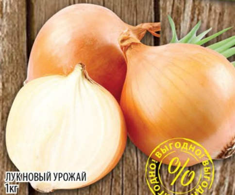
ЛУКОВЫЙ УРОЖАЙ 1кг