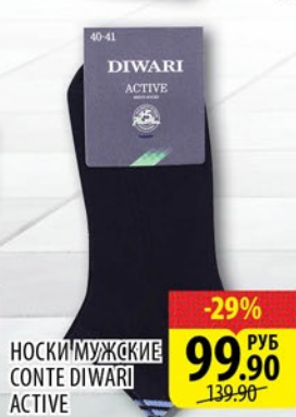
НОСКИ МУЖСКИЕ CONTE DIWARI ACTIVE