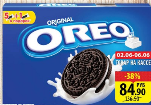
ПЕЧЕНЬЕ ОРЕО 228г

02.06-06.06 ТОВАР НА КАССЕ -38% 84.90 РУБ 136.50