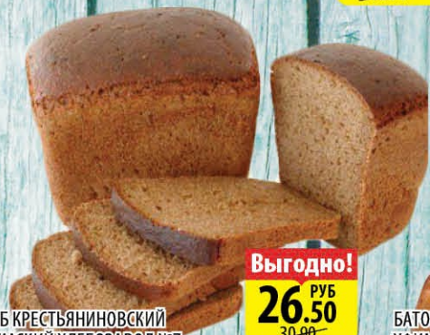
ХЛЕБ КРЕСТЬЯНИНОВСКИЙ УФИМСКИЙ ХЛЕБОЗАВОД №7 500г