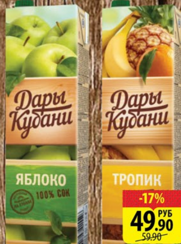
СОК ДАРЫ КУБАНИ Яблочный/Персик-яблоко/ Тропик/Апельсин/Томат 1л