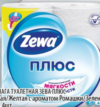
БУМАГА ТУАЛЕТНАЯ ЗЕВА ПЛЮС Белая/Желтая с ароматом Ромашки/Зеленая 2сл, 4шт