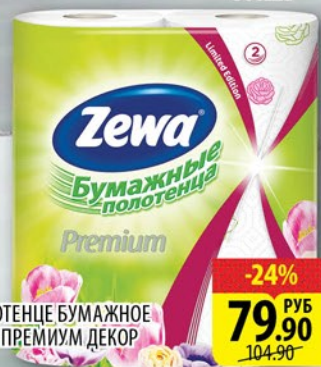
ПОЛОТЕНЦЕ БУМАЖНОЕ ЗЕВА ПРЕМИУМ ДЕКОР 2шт