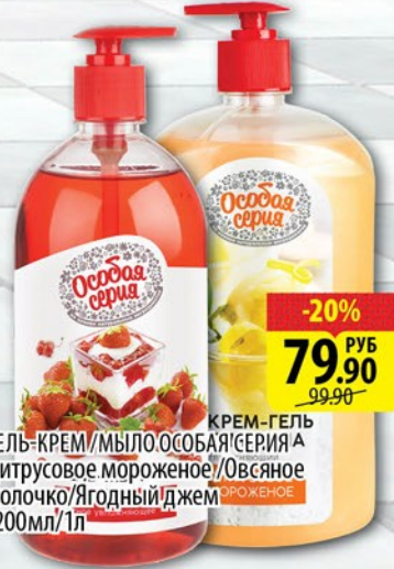
КРЕМ-ГЕЛЬ/МЫЛО ОСОБАЯ СЕРИЯ А Цитрусовое мороженое/Овсяное молочко/Ягодный джем 1200мл/1л