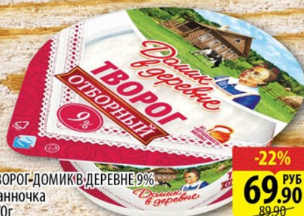
ТВОРОГ ДОМИК В ДЕРЕВНЕ 9% Ванночка 170г