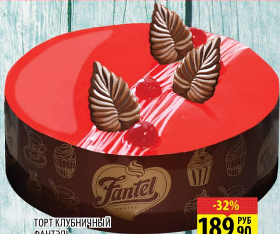
ТОРТ КЛУБНИЧНЫЙ ФАНТЭЛЬ 600г