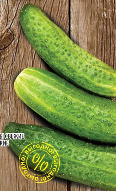
ОГУРЦЫ СВЕЖИЕ КОРОТКИЕ 1кг