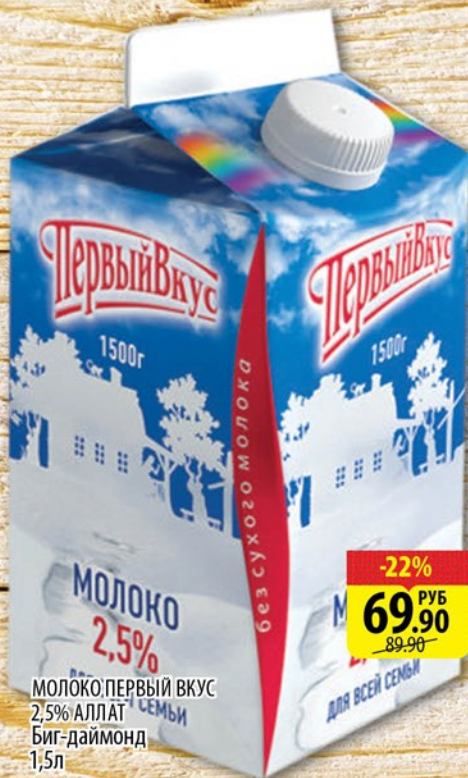
МОЛОКО ПЕРВЫЙ ВКУС 2,5% АЛЛАТ Биг-даймонд 1,5л