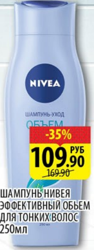
ШАМПУНЬ НИВЕА ЭФФЕКТИВНЫЙ ОБЪЕМ для тонких волос 250мл