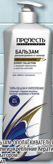
БАЛЬЗАМ-ОПОЛАСКИВАТЕЛЬ ПРЕЛЕСТЬ PROFESSIONAL 100% Объем и укрепление Кератинотерапия/Двойной объем и питание с дозатором 400мл