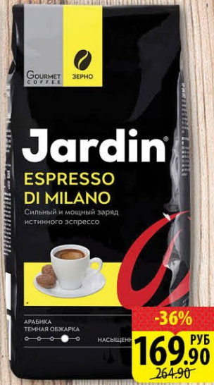
КОФЕ ЖАРДИН ESPRESSO DI MILANO в/з Молотый Пакет 250г -36% 169.90 РУБ 264.90