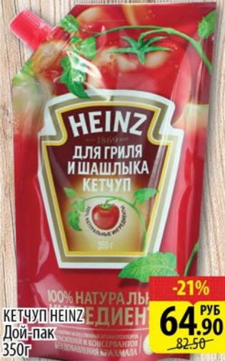
КЕТЧУП HEINZ ДЛЯ ГРИЛЯ И ШАШЛИКА Дой-пак 350г в ассортименте