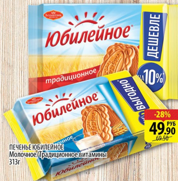
ПЕЧЕНЬЕ ЮБИЛЕЙНОЕ Молочное/Традиционное. Витамины 313г

02.06-06.06 ТОВАР НА КАССЕ -38% 84.90 РУБ 136.50