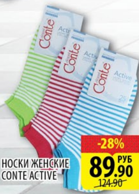
НОСКИ ЖЕНСКИЕ CONTE ACTIVE