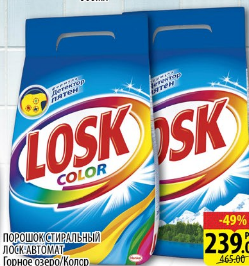
ПОРОШОК СТИРАЛЬНЫЙ ЛОСК АВТОМАТ Горное озеро/Колор 3кг