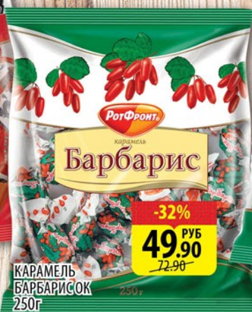
КАРАМЕЛЬ БАРБАРИСОК 250г