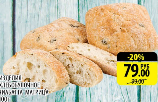
ИЗДЕЛИЯ ХЛЕББУЛОЧНОЕ ЧИАБАТТА МАТРИЦА 100г