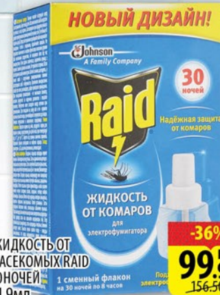
ЖИДКОСТЬ ОТ НАСЕКОМЫХ RAID ЗОНОЧЕЙ 21,9мл