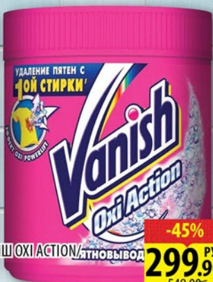
ПЯТНОВЫВОДИТЕЛЬ ПОРОШОК ВАНИШ ОХИ АКЦИОН, ОТБЕЛИВАТЕЛЬ ДЛЯ БЕЛЫХ ТКАНЕЙ 500г