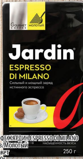
КОФЕ ЖАРДИН ESPRESSO DI MILANO в/з Молотый Пакет 250г -36% 169.90 РУБ 264.90