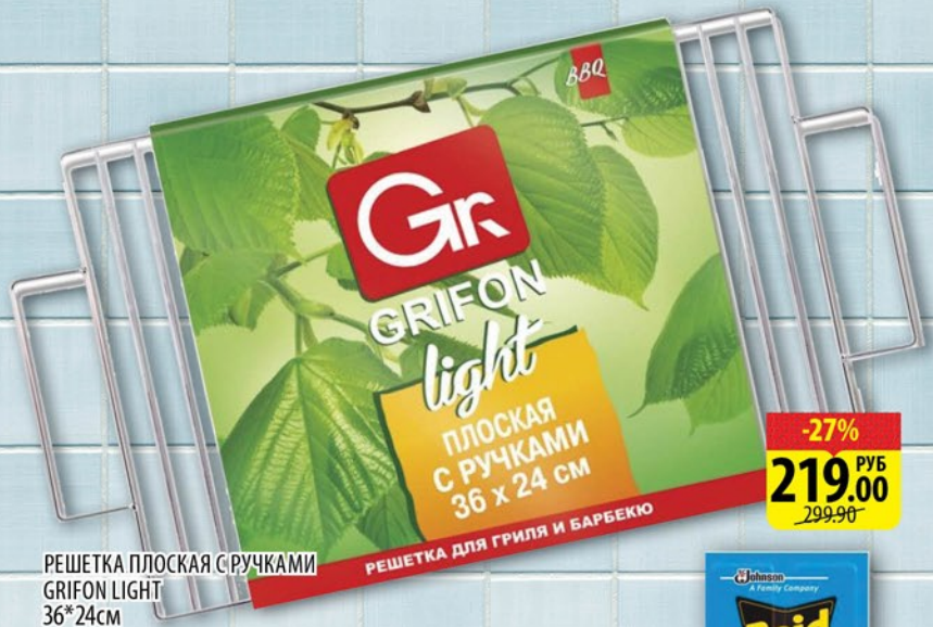
РЕШЕТКА ПЛОСКАЯ С РУЧКАМИ GRIFON LIGHT 36*24см