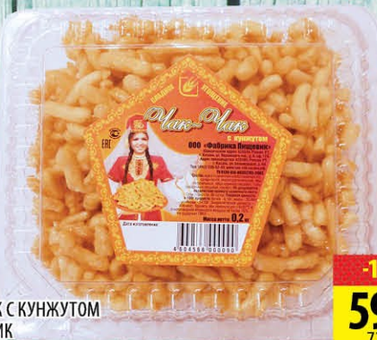
ЧАК-ЧАК С КУНЖУТОМ ПИЩЕВИК 200г