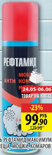
АЭРОЗОЛЬ РЕФАМИД МАКСИМУМ ЗВТ ОТ КЛЕЩА, МОШКИ, КОМАРОВ 147мл