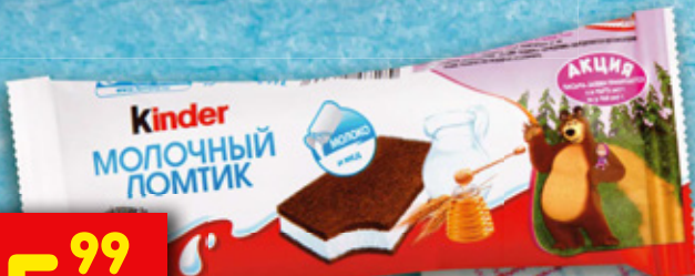
ПИРОЖНОЕ KINDER «МОЛОЧНЫЙ ЛОМТИК» бисквитное, 28 г

Как зарядиться хорошим настроением с самого утра? Ушастый омлет и веселая овсянка прекрасно справятся с этой задачей! Этот необычный и очень полезный завтрак наполнит энергией, и дети будут скакать, как зайки, с первых лучей солнца до самого вечера.