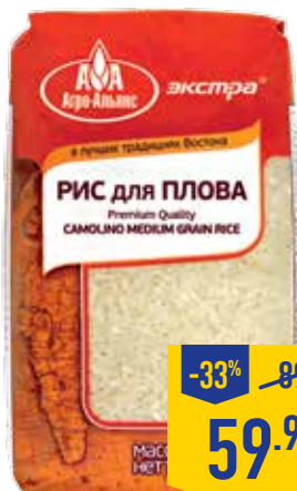
РИС ДЛЯ ПЛОВА ЭКСТРА АГРО-АЛЬЯНС, 900 г