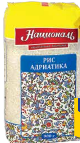
РИС АДРИАТИКА НАЦИОНАЛЬ, 900 г