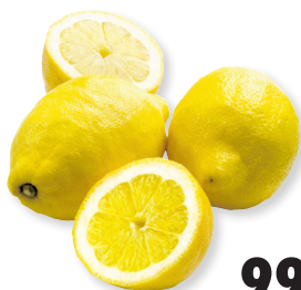
Лимоны 1 кг