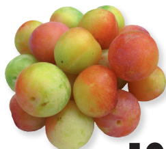
Алыча 1 кг