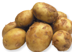
Картофель новый урожай 1 кг