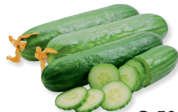
Огурцы среднеплодные 1 кг