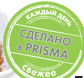
Греча отварная 100 г