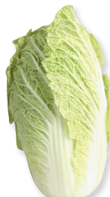
Капуста Китайская 1 кг