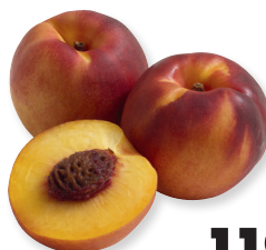
Нектарины 1 кг