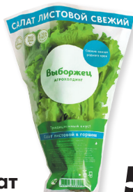
Салат листовой Выборжец 1 шт.