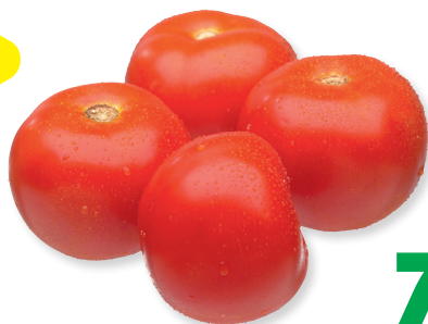
Томаты тепличные 1 кг