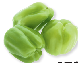
Перец Ласточка 1 кг