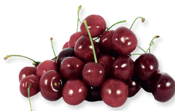
Черешня 1 кг