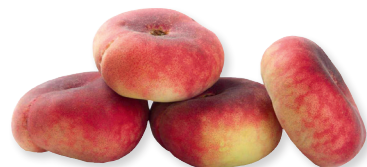
Персики плоские 1 кг