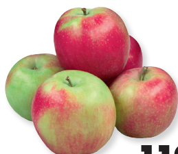
Яблоки новый урожай 1 кг