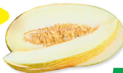
Дыня Торпеда 1 кг