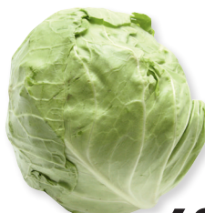
Капуста белокочанная новый урожай 1 кг