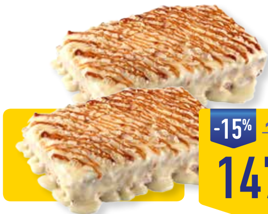
ТОРТ ЛАКОМКА КОНФИ-ТЕРРА, 600 г