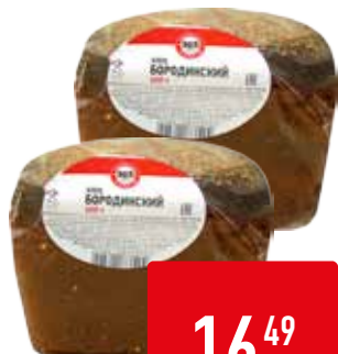
ХЛЕБ БОРОДИНСКИЙ 365 ДНЕЙ, 400 г