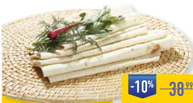
ЛАВАШ АРМЯНСКИЙ, 400 г