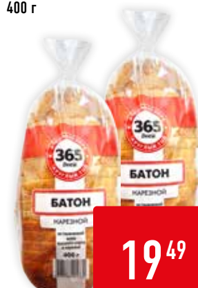
БАТОН 365 ДНЕЙ, нарезка, 400 г