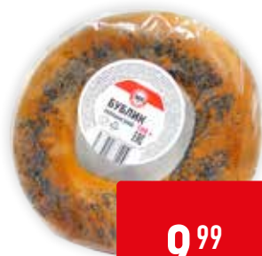
БУБЛИК УКРАИНСКИЙ 365 ДНЕЙ, 100 г