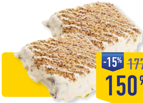
ТОРТ НЕЖНОСТЬ КОНФИ-ТЕРРА, 600 г