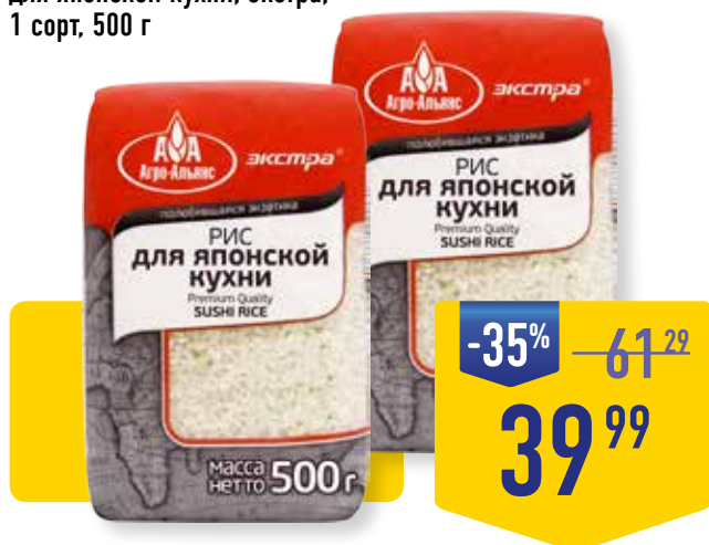
РИС АГРО-АЛЬЯНС SUSHI, для японской кухни, экстра, 1 сорт, 500 г