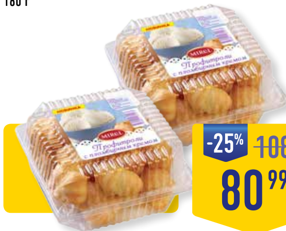
ПИРОЖНЫЕ ПРОФИТРОЛИ MIREL, с пломбирным кремом, 180 г