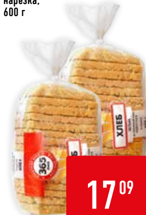
ХЛЕБ БЕЛЫЙ 365 ДНЕЙ, нарезка, 600 г