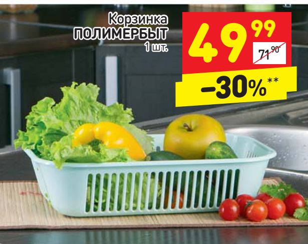
Корзинка ПОЛИМЕРБЫТ 1 шт.