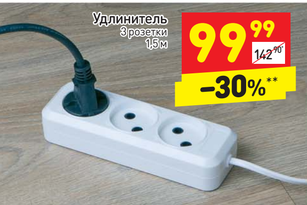
Удлинитель 3 розетки 1,5 м