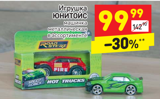
Игрушка ЮНИТОИС машинка металлическая в ассортименте