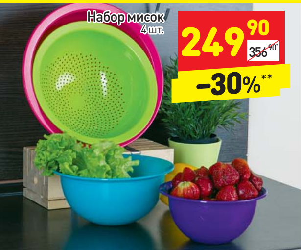
Набор мисок / 4 шт.