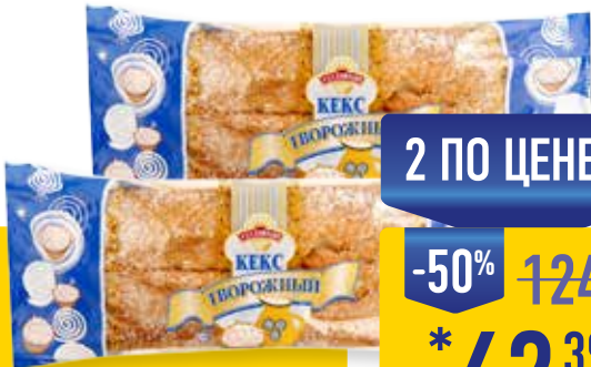
КЕКС ТВОРОЖНЫЙ АЛАДУШКИН, 300 г