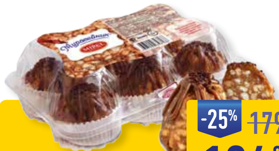
НАБОР ПИРОЖНЫХ МУРАВЕЙНИК MIREL, 420 г