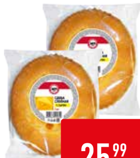
СДОБА С СЫРОМ 365 ДНЕЙ, слоеная, 75 г