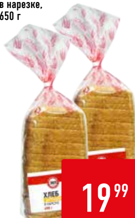
ХЛЕБ ДАРНИЦКИЙ 365 ДНЕЙ, в нарезке, 650 г