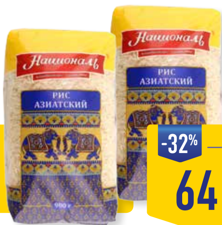
РИС АЗИАТСКИЙ НАЦИОНАЛЬ, 900 г