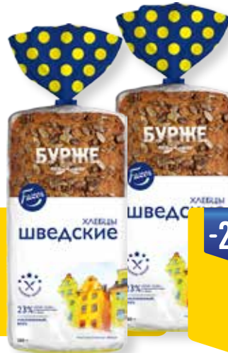
ХЛЕБЦЫ ШВЕДСКИЕ FAZER, 280 г