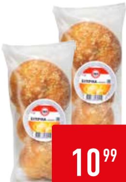
БУЛОЧКА ЧАЙНАЯ 365 ДНЕЙ, 80 г