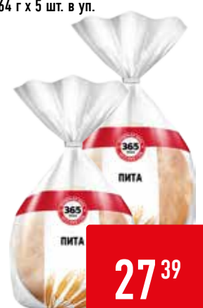
ПИТА 365 ДНЕЙ, 64 г x 5 шт. в уп.