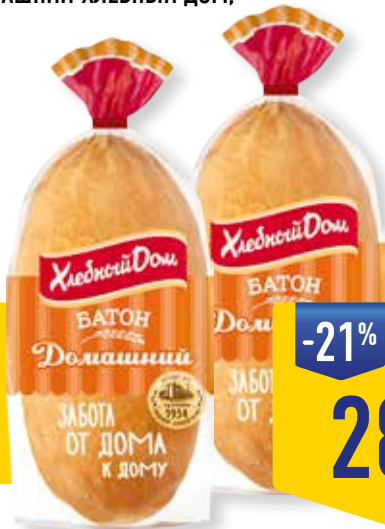
БАТОН ДОМАШНИЙ ХЛЕБНЫЙ ДОМ, 230 г