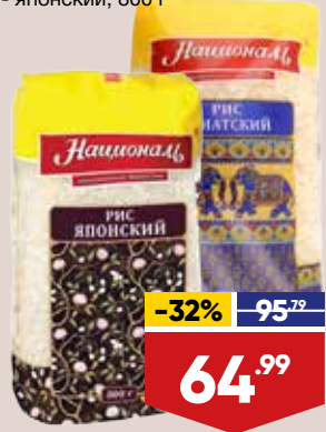
РИС НАЦИОНАЛЬ, - азиатский, 900 г - японский, 800 г