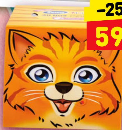
ДЕТСКИЕ БУМАЖНЫЕ САЛФЕТКИ ZEWA KIDS 3-сл., 60 шт.