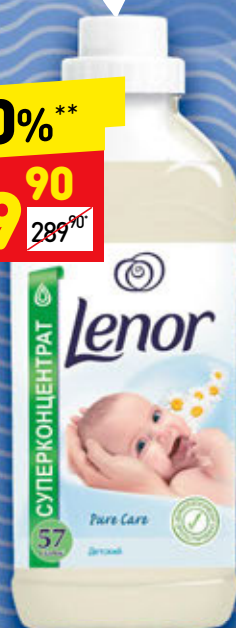
КОНДИЦИОНЕР ДЛЯ БЕЛЬЯ LENOR детский, 2 л