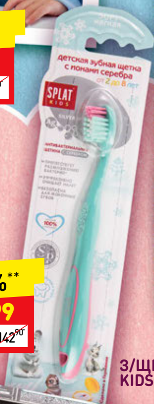
3/ЩЕТКА SPLAT KIDS 1 ШТ.