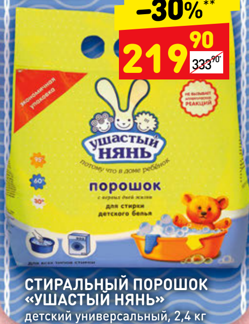
СТИРАЛЬНЫЙ ПОРОШОК «УШАСТЫЙ НЯНЬ» детский универсальный, 2,4 кг