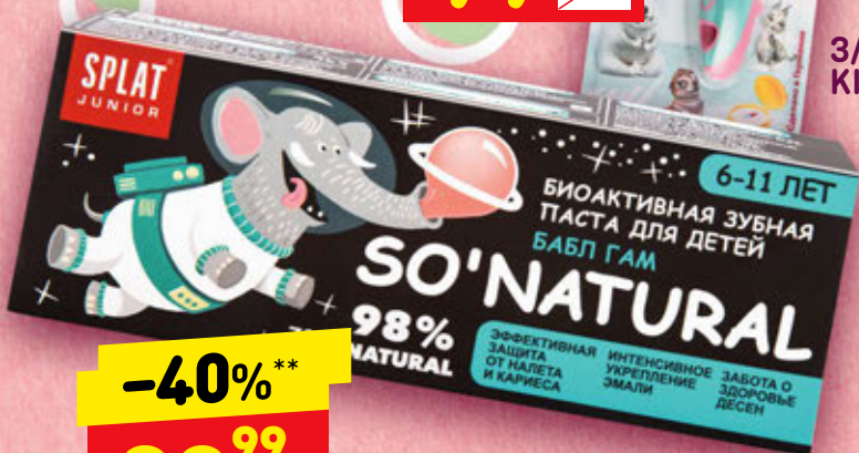
3/ПАСТА SPLAT JUNIOR/ БАБЛ ГАМ 6-11 ЛЕТ