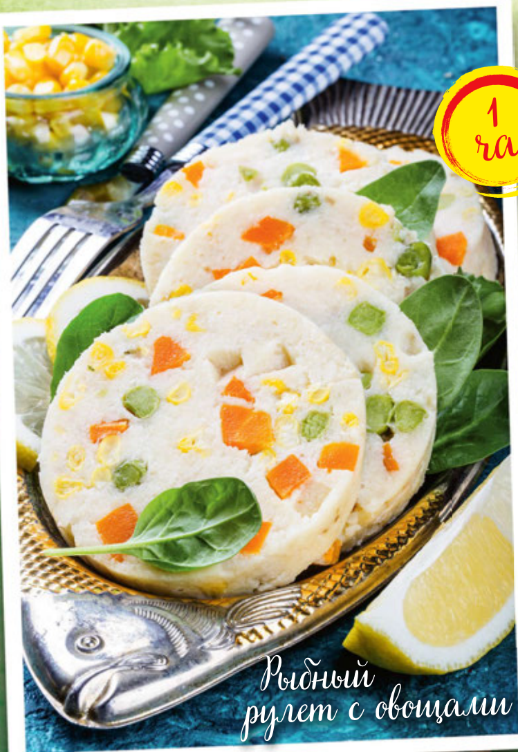
Рыбный рулет с овощами