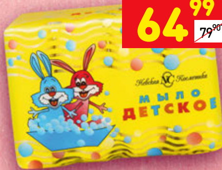
МЫЛО ДЕТСКОЕ 4 шт. x 100 г