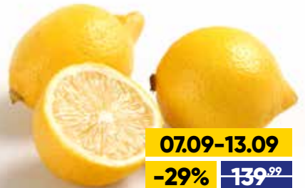
ЛИМОНЫ, весовые, 1 кг