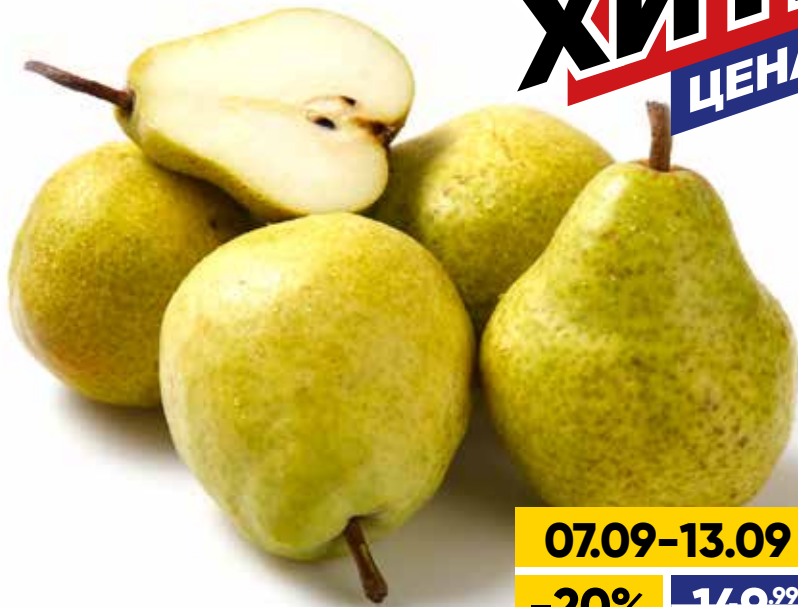
ГРУША ВИЛЬЯМС, весовая, 1 кг