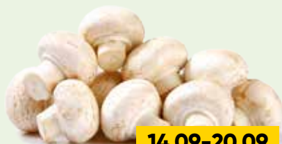
ШАМПИЬОНЫ, весовые, 1 кг