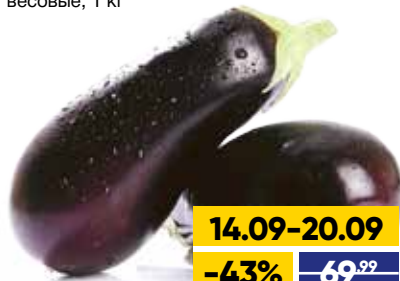
БАКЛАЖАНЫ, весовые, 1 кг