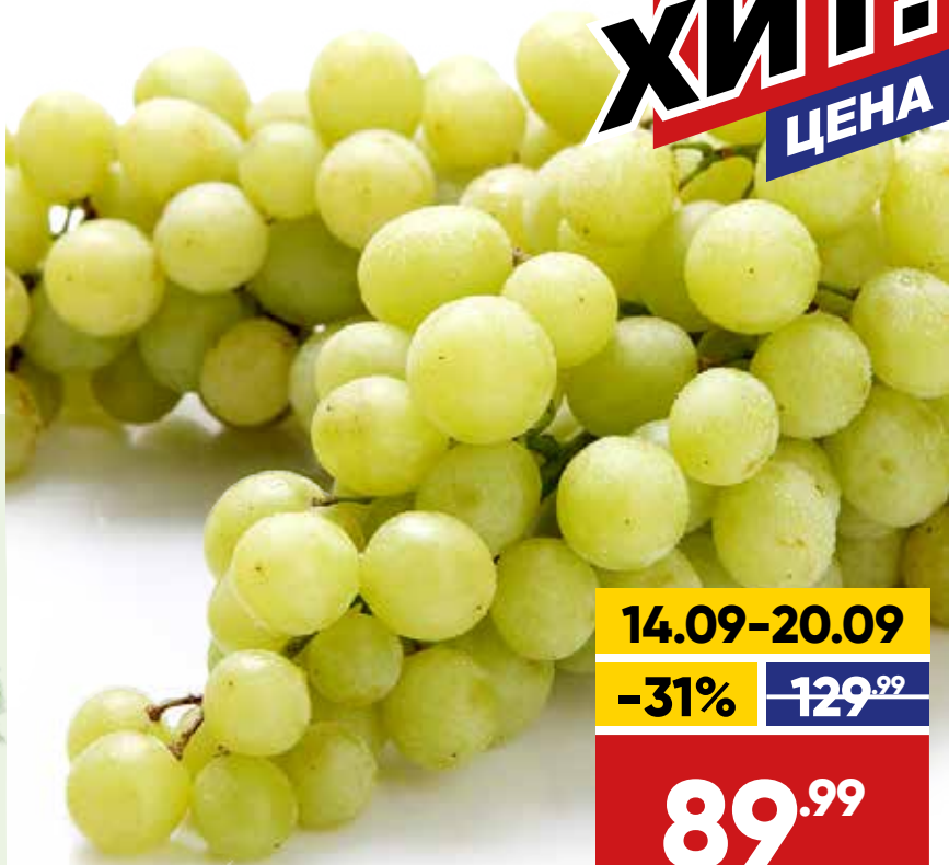
ВИНОГРАД КИШМИШ, зеленый, весовой, 1 кг