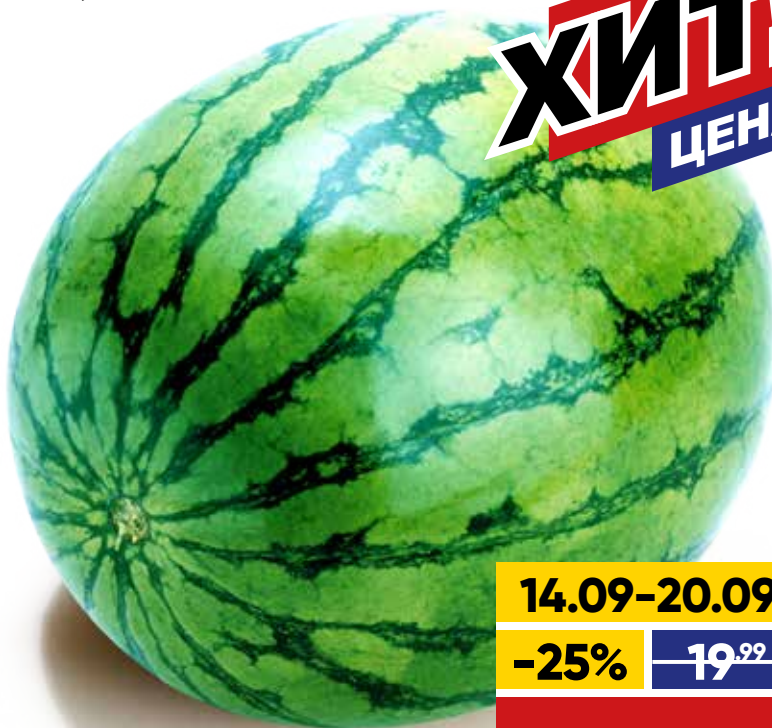
АРБУЗ, весовой, 1 кг