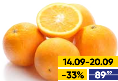
АПЕЛЬСИНЫ, весовые, 1 кг