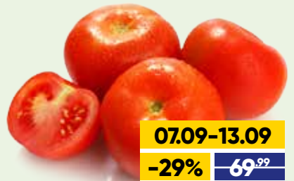
ТОМАТЫ, весовые, 1 кг