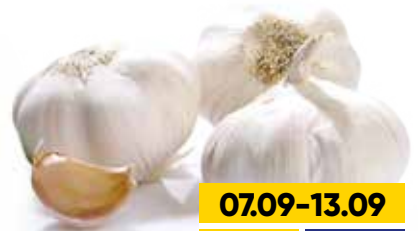
ЧЕСНОК, весовой, 1 кг