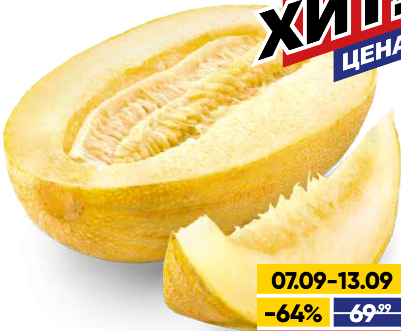
ДЫНЯ ТОРПЕДА, весовая, 1 кг