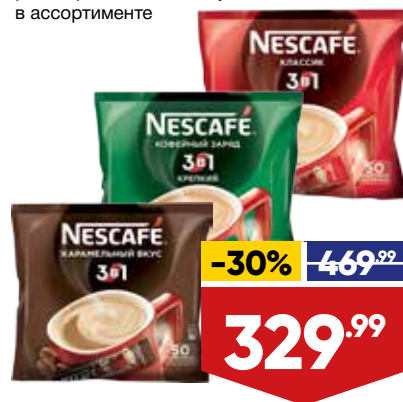
НАПИТОК КОФЕЙНЫЙ 3 В 1 NESCAFE, растворимый, 50 шт. в уп., в ассортименте