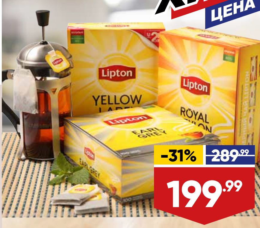
ЧАЙ LIPTON, 100 пак. в уп.: - черный: yellow label, earl grey, royal Ceylon, english breakfast - classic green, зеленый