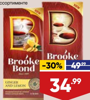
ЧАЙ BROOKE BOND, черный, 25 пак. в уп., в ассортименте