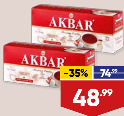
ЧАЙ АКВАР, черный, цейлонский, байховый, 25 пак. в уп.