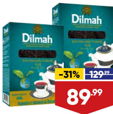
ЧАЙ DILMAH, черный, байховый, крупнолистовой, 100 г