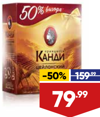
ЧАЙ ПРИНЦЕССА КАНДИ, черный, 100 пак. в уп.