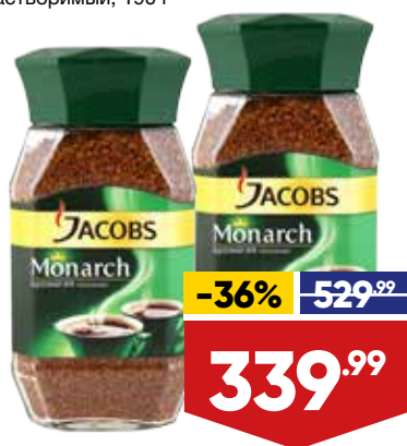
КОФЕ MONARCH JACOBS, растворимый, 190 г