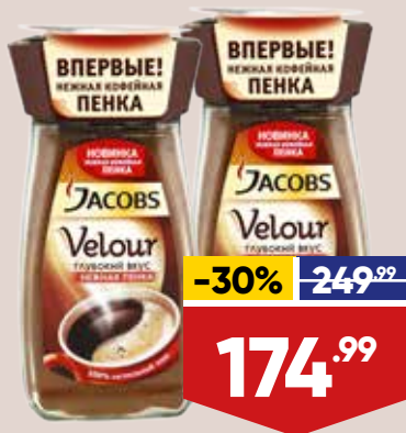
КОФЕ VELOUR JACOBS, растворимый, 95 г