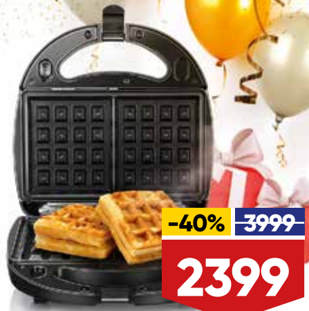
RMB-603 Панели, входящие в комплект