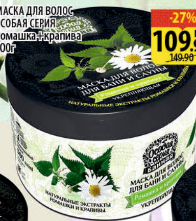
МАСКА ДЛЯ ВОЛОС ОСОБАЯ СЕРИЯ Ромашка+крапива 500г