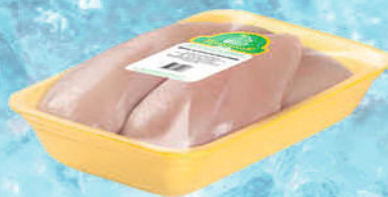
ФИЛЕ ЦЫПЛЕНКА БРОЙЛЕРА ПРИОСКОЛЬЕ Заморож. Подложка 1кг, в ассортименте