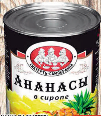
АНАНАСЫ СКАТЕРТЬ-САМОБРАНКА кусочки в сиропе, ж/б 580мл