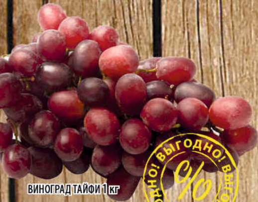
ВИНОГРАД ТАЙФИ 1 кг