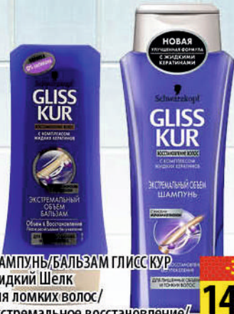
ШАМПУНЬ/БАЛЬЗАМ ГЛИСС КУР Жидкий Шелк для ломких волос/ Экстремальное восстановление/ Экстремальный объем для тонких волос 250мл/200мл