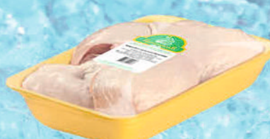
БЕДРО ЦБ ПРИОСКОЛЬЕ Заморож. Подложка 1 кг, в ассортименте