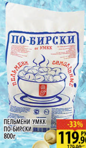
ПЕЛЬМЕНИ УМКК ПО-БИРСКИ 800г