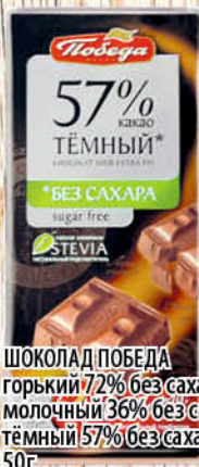
ШОКОЛАД ПОБЕДА горький 72% без сахара/молочный 36% без сахара/тёмный 57% без сахара 50г