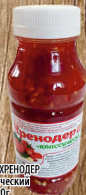
САЛАТ ХРЕНОДЕР классический 200-220г