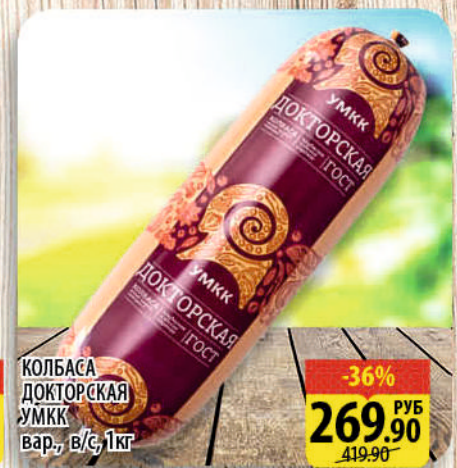
КОЛБАСА ДОКТОРСКАЯ УММК вар., в/с, 1кг