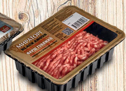
ФАРШ ГОВЯЖИЙ МИРАТОРГ охл., лоток 400г