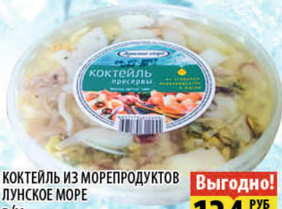
КОКТЕЙЛЬ ИЗ МОРЕПРОДУКТОВ ЛУНСКОЕ МОРЕ в/м 180г