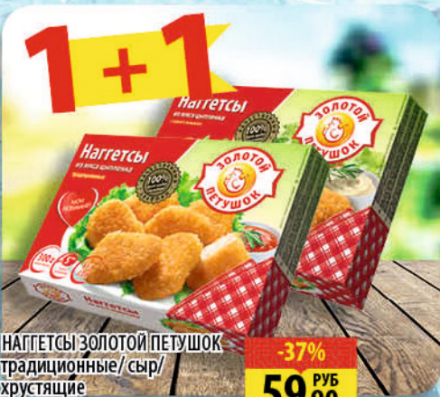
НАГГЕТСЫ ЗОЛОТОЙ ПЕТУШОК традиционные/ сыр/ хрустящие 300г