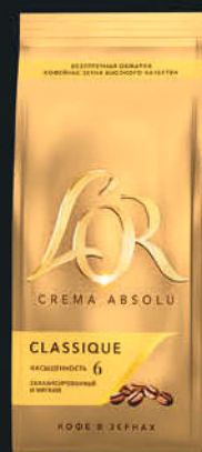
CREMA ABSOLU CLASSIQUE ПАКЕТ 230Г.