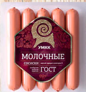
СОСИСКИ МОЛОЧНЫЕ УММК 340г