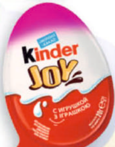
ШОКОЛАДНОЕ ЯЙЦО КИНДЕР ДЖОЙ Девочки