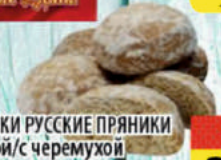
ПРЯНИКИ РУССКИЕ ПРЯНИКИ С маятой/с черемухой 400г