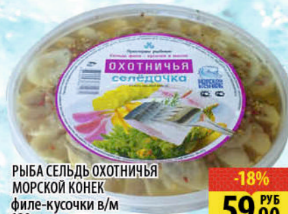
РЫБА СЕЛЬДЬ ОХОТНИЧЬЯ МОРСКОЙ КОНЕК Филе-кусочки в/м 180г