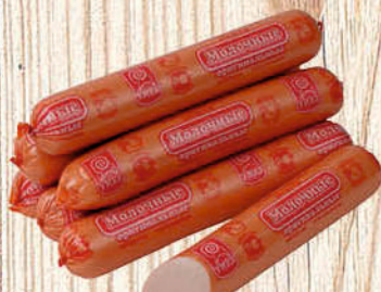
СОСИСКИ МОЛОЧНЫЕ ОРИГИНАЛЬНЫЕ УММК 1 кг