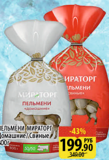
ПЕЛЬМЕНИ МИРАТОРГ Домашние/Свинные 800г