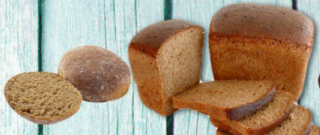
ЛЕПЕШКА РЖАНАЯ 80г