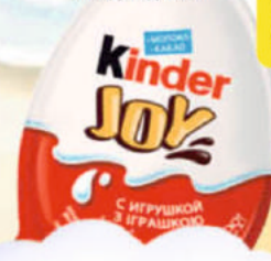
ШОКОЛАДНОЕ ЯЙЦО КИНДЕР ДЖОЙ