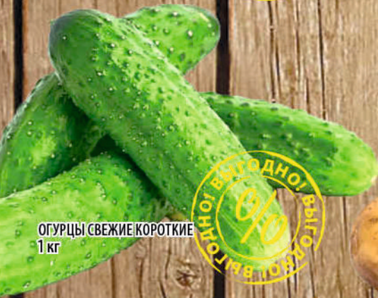
ОГУРЦЫ СВЕЖИЕ КОРОТКИЕ 1 кг