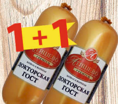
КОЛБАСА ДОКТОРСКАЯ ГОСТ АТЯШЕВО вар., в/у, 500г