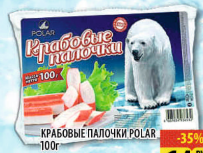
КРАБОВЫЕ ПАЛОЧКИ POLAR 100г