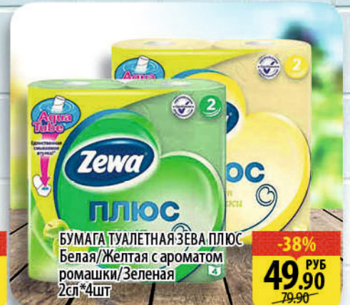
БУМАГА ТУАЛЕТНАЯ ЗЕВА ПЛЮС Белая/Желтая с ароматом ромашки/Зеленая 2сл*4шт