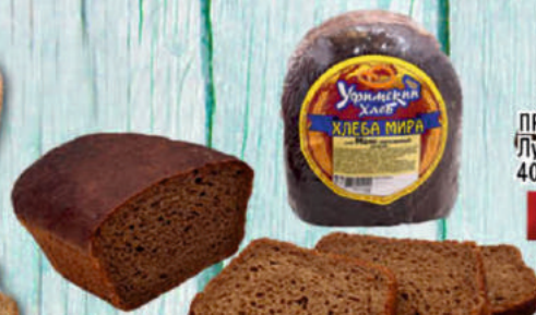
ХЛЕБ МАЯК ЗАВАРНОЙ УФИМСКИЙ ХЛЕБ нарезка в упаковке 300г