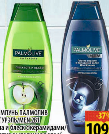
ШАМПУНЬ ПАЛМОЛИВ НАТУРЭЛЬ/MEN/281 Сила и блеск/с керамидами/ Против выпадения волос/ Против выпадения волос с морскими минералами 380мл