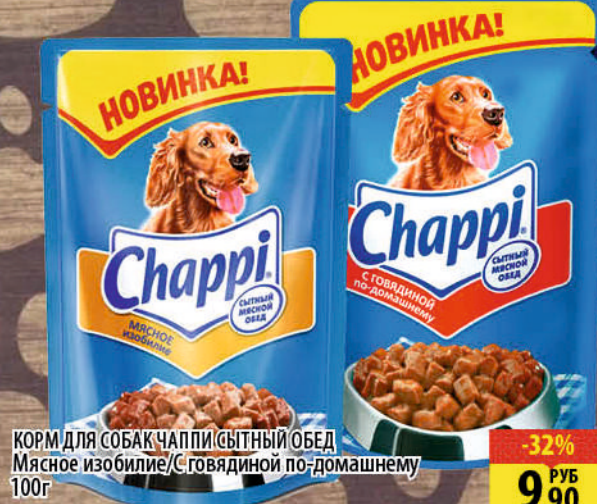
КОРМ ДЛЯ СОБАК ЧАППИ СЫТНЫЙ ОБЕД Мясное изобилие/с говядиной по-домашнему 100г