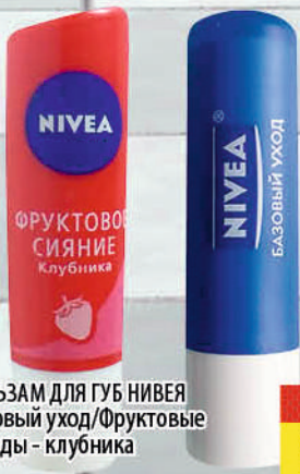
БАЛЬЗАМ ДЛЯ ГУБ НИВЕА Базовый уход/Фруктовые звезды - клубника 4,8г