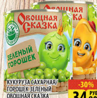
КУКУРУЗА САХАРНАЯ/ГОРОШЕК ЗЕЛЕНЫЙ ОВОЩНАЯ СКАЗКА ж/б, 310гр