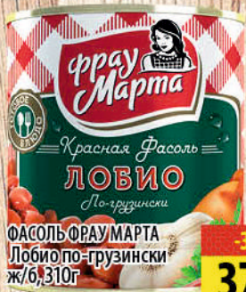
ФАСОЛЬ ФРАУМАРТА Лобио по-грузински ж/б, 310г