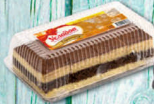
ПИРОЖНОЕ ТИРАМИСУ МИРЭЛЬ 300г