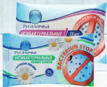
САЛФЕТКИ ВЛАЖНЫЕ РУСАЛОЧКА Антибактериальные/ Антибактериальные с ароматами 15шт в ассортименте