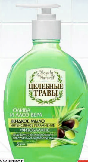
МЫЛО ЖИДКОЕ ЦЕЛЕБНЫЕ ТРАВЫ Мед+ромашка/ Олива+алоэ вера 300мл