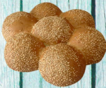
БУЛОЧКА РОМАШКА УФИМСКИЙ ХЛЕБОЗАВОД №7 300г