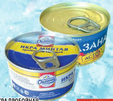
ИКРА ПРОБОЙНАЯ СОКРОВИЩА ОКЕАНА минтай/сазан ж/б, с/к 120г