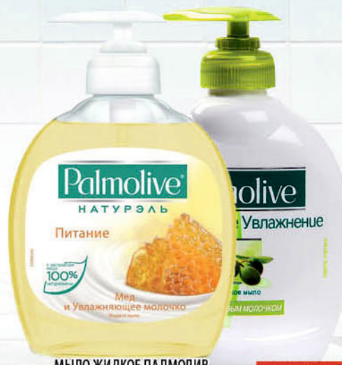
МЫЛО ЖИДКОЕ ПАЛМОЛИВ С оливковым молочком/ Нейтрализирующее запах/ Молоко+мед 300мл