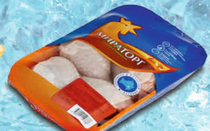
ГОЛЕНЬ ЦБ МИРАТОРГ ЛОТОК 750г