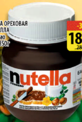
ПАСТА ОРЕХОВАЯ НУТЕЛЛА с какао ст/б 350г