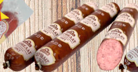
КОЛБАСА СЕРВЕЛАТ САВА в/к, в/у, в/с