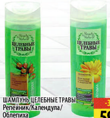
ШАМПУНЬ ЦЕЛЕБНЫЕ ТРАВЫ Репейник/Календула/ Облепиха 250-260мл