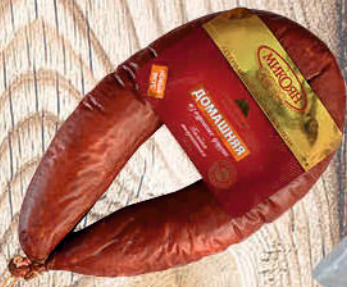
КОЛБАСА ДОМАШНЯЯ ИЗ КУРИНЫХ ГРУДОК МИКОЯН п/к, в/у, 400г