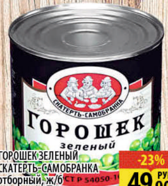
ГОРОШЕК ЗЕЛЕНЫЙ СКАТЕРТЬ-САМОБРАНКА отборный, ж/б 400г