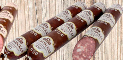
КОЛБАСА МОСКОВСКАЯ САВА в/к, в/у, в/с