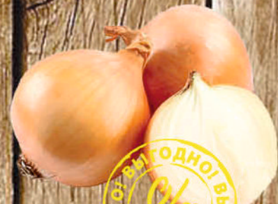
ЛУК НОВЫЙ УРОЖАЙ 1 кг