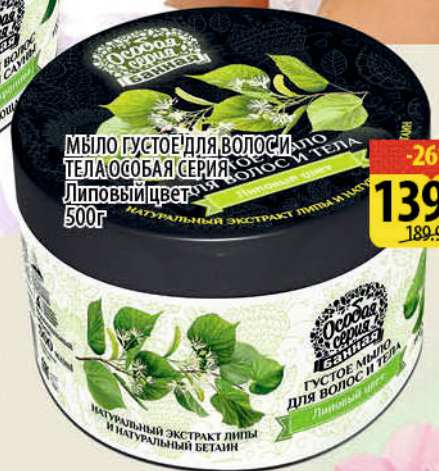
МЫЛО ГУСТОЕ ДЛЯ ВОЛОС И ТЕЛА ОСОБАЯ СЕРИЯ Липовый цвет 500г