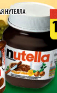
ПАСТА ОРЕХОВАЯ НУТЕЛЛА с какао ст/б 180г