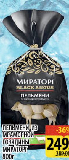
ПЕЛЬМЕНИ ИЗ МРАМОРНОЙ ГОВЯДИНЫ МИРАТОРГ 800г