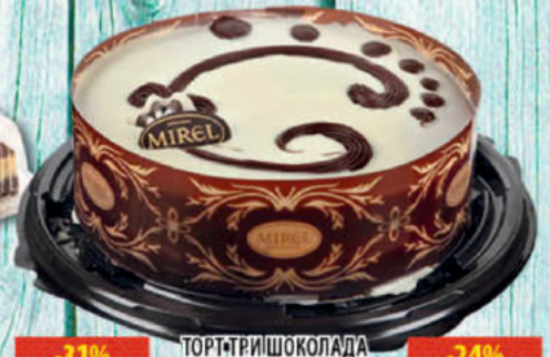
ТОРТ ТРИШОКОЛАДА МИРЭЛЬ 900г