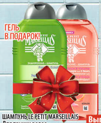
ГЕЛЬ В ПОДАРОК! ШАМПУНЬ LE PETIT MARSEILLAIS Для тонких волос с экстрактом 3 цветов и грейпфрутом/Для нормальных волос с яблоком и оливкой 250мл