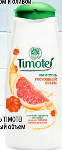
ШАМПУНЬ ТИМОТЕИ Роскошный объем 400мл