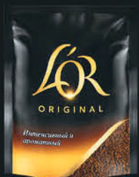
ORIGINAL РЕФИЛ 75Г