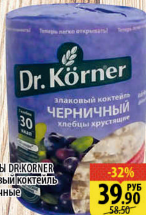
ХЛЕБЦЫ DR.KORNER Злаковый коктейль черничные 100г