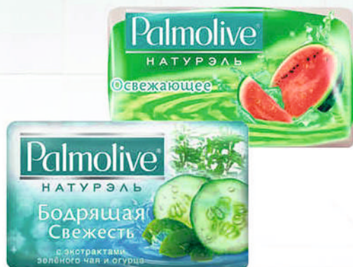
МЫЛО ПАЛМОЛИВ NATURALS Освежающее с арбузом/ Интенсивное увлажнение/ Бодрящая Свежесть 90г