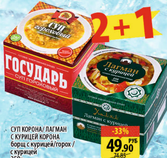
СУП КОРОНА/ ЛАГМАН с КУРИЦЕЙ КОРОНА борщ с курицей/горох / с курицей 250г