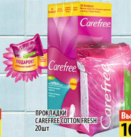
ПРОКЛАДКИ CAREFREE COTTON FRESH 20шт