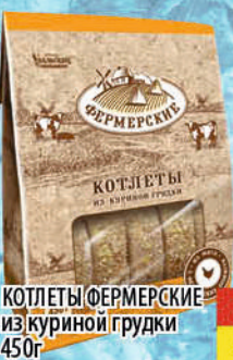
КОТЛЕТЫ ФЕРМЕРСКИЕ из куриной грудки 450г