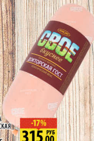
КОЛБАСА ДОКТОРСКАЯ МИКОЯН вар., 1 кг