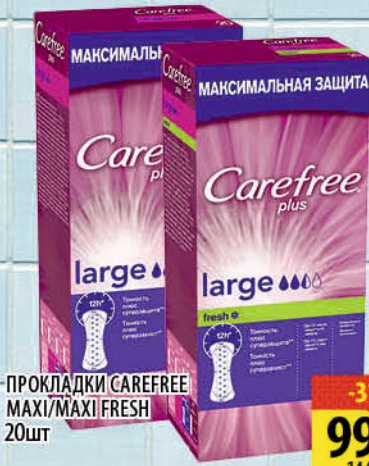
ПРОКЛАДКИ CAREFREE MAXI/MAXI FRESH 20шт