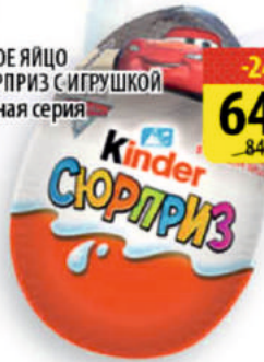
ШОКОЛАДНОЕ ЯЙЦО КИНДЕР СЮРПРИЗ С ИГРУШКОЙ Лицензионная серия