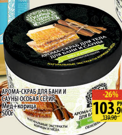
АРОМА-СКРАБ ДЛЯ БАНИ И САУНЫ ОСОБАЯ СЕРИЯ Мед+корица 500г