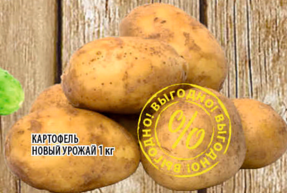
КАРТОФЕЛЬ НОВЫЙ УРОЖАЙ 1 кг