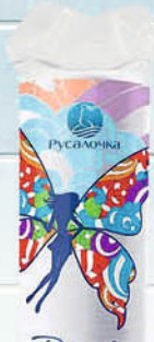
ВАТНЫЕ ДИСКИ РУСАЛОЧКА PERFECT LINE 80шт