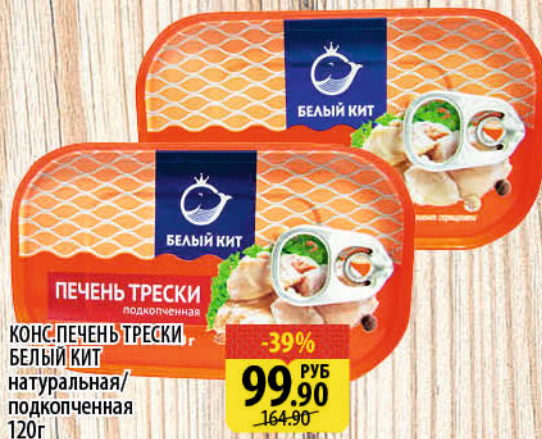
КОНС. ПЕЧЕНЬ ТРЕСКИ БЕЛЫЙ КИТ натуральная/подкопченная 120г