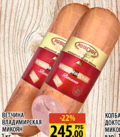
ВЕТЧИНА ВЛАДИМИРСКАЯ МИКОЯН 1 кг