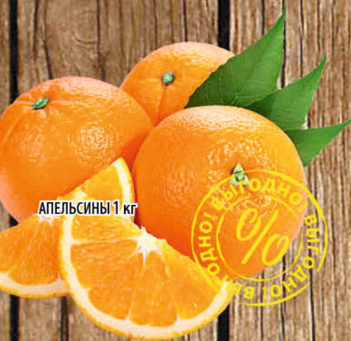
АПЕЛЬСИНЫ 1 кг