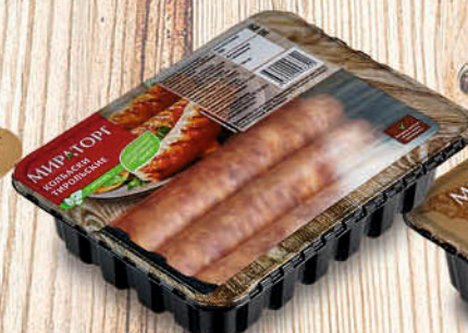
КОЛБАСКИ СВИНЫЕ ТИРОЛЬСКИЕ МИРАТОРГ 400г