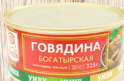
КОНС. ГОВЯДИНА ТУШЕНАЯ БОГАТЫРСКАЯ УМКК 325г