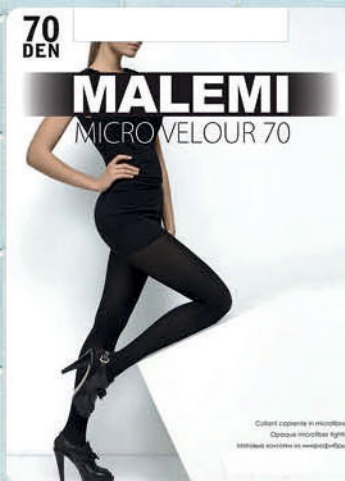
КОЛГОТКИ MALEMI MICRO VELOUR 70