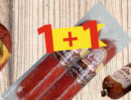
КОЛБАСА СЕРВЕЛАТ ОХОТНИЧИЙ ДЫМ ДЫМЫЧЬ в/к, в/у, 400г