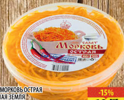
САЛАТ МОРКОВЬ ОСТРАЯ СЕВЕРНАЯ ЗЕМЛЯ 400г