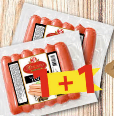
СОСИСКИ ГОСТ АТЯШЕВО 300г