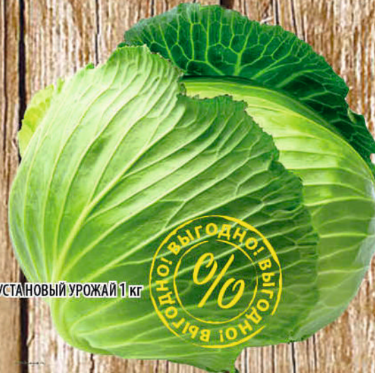
КАПУСТА НОВЫЙ УРОЖАЙ 1 кг