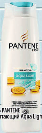
ШАМПУНЬ PANTENE Легкий питающий Aqua Light 400мл