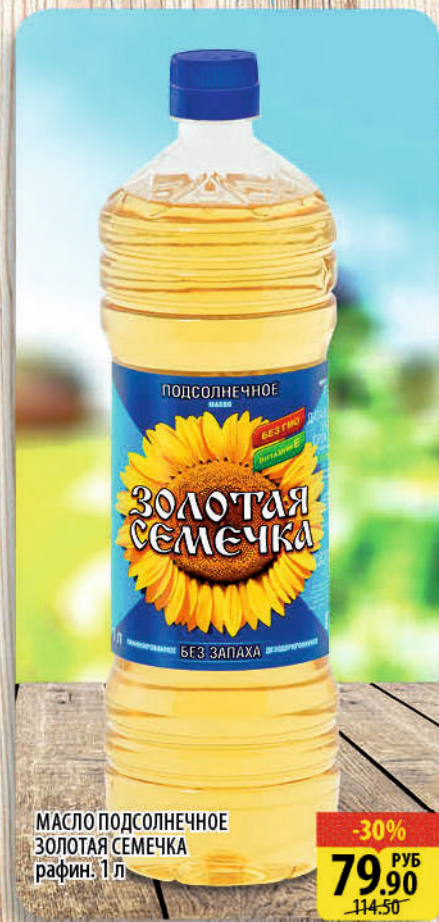
МАСЛО ПОДСОЛНЕЧНОЕ ЗОЛОТАЯ СЕМЕЧКА рафин. 1 л