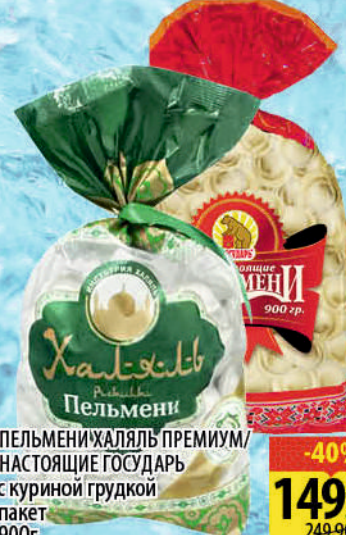
ПЕЛЬМЕНИ ХАЛЯЛЬ ПРЕМИУМ/ НАСТОЯЩИЕ ГОСУДАРЬ с куриной грудкой пакет 900г