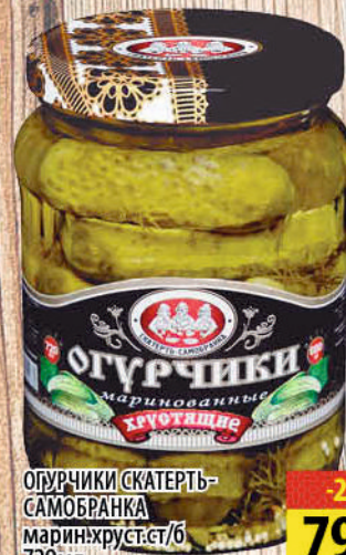
ОГУРЧИКИ СКАТЕРТЬ-САМОБРАНКА марин. хруст. ст/б 720мл