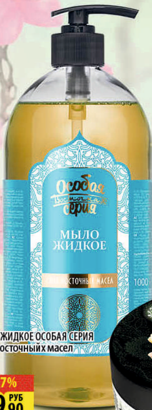
МЫЛО ЖИДКОЕ ОСОБАЯ СЕРИЯ Сила восточных масел 1000г

Особая серия – косметическая линия, созданная на основе натуральных экстрактов и масел, привлекающая гурманов своими особенными вкусными ароматами.