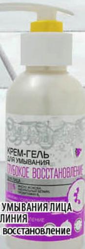
ГЕЛЬ ДЛЯ УМЫВАНИЯ ЛИЦА КРАСНАЯ ЛИНИЯ Глубокое восстановление 150мл