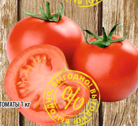
ТОМАТЫ 1 кг