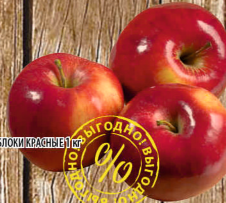
ЯБЛОКИ КРАСНЫЕ 1 кг