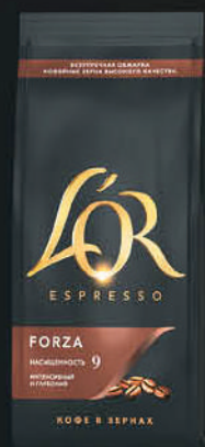
ESPRESSO FORZA ПАКЕТ 230Г.