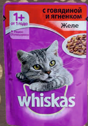
КОРМ Д/КОШЕК ВИСКАС в желе, 85г В ассортименте