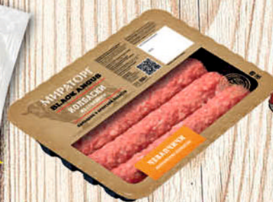
КОЛБАСКИ ИЗ ГОВЯДИНЫ МИРАТОРГ лоток, 300г