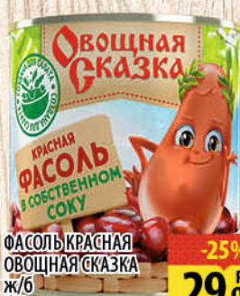
ФАСОЛЬ КРАСНАЯ ОВОЩНАЯ СКАЗКА ж/б 310г