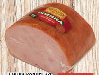
ШИНКА КОПЧЕНАЯ МИКОЯН к/в, в/у