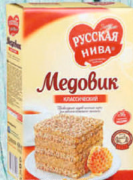
ТОРТ РУССКАЯ НИВА МЕДОВИК КЛАССИЧЕСКИЙ 420г