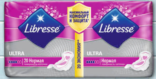
ПРОКЛАДКИ ЛИБРЕСС УЛЬТРА НОРМАЛ 20шт