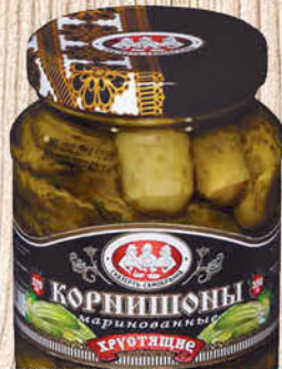
КОРНИШОНЫ СКАТЕРТЬ-САМОБРАНКА марин. хруст. ст/б 370мл