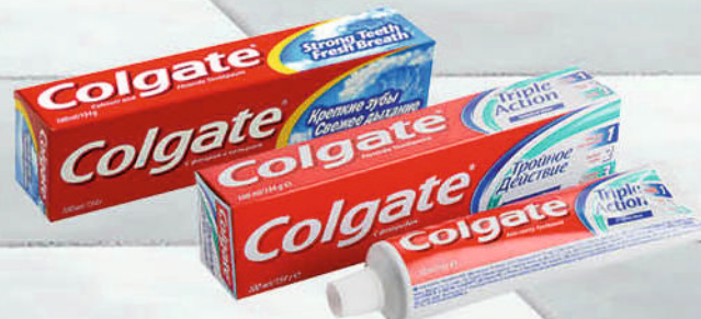
ПАСТА ЗУБНАЯ КОЛГАЙТ Тройное действие/Крепкие зубы+свежее дыхание 100мл