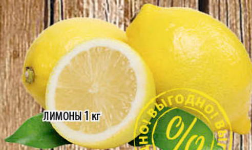
ЛИМОНЫ 1 кг