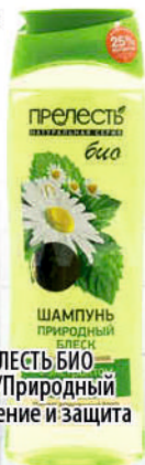
ШАМПУНЬ ПРЕЛЕСТЬ БИО Объем и сила/Природный блеск/Укрепление и защита 500мл