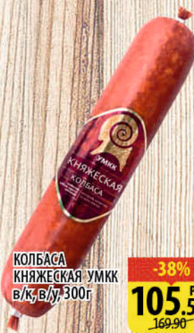
КОЛБАСА КНЯЖЕСКАЯ УММК в/к, в/у, 300г