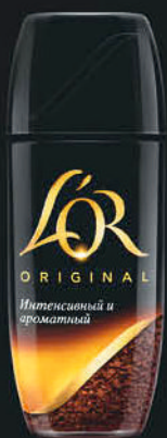
ORIGINAL БАНКА 95Г