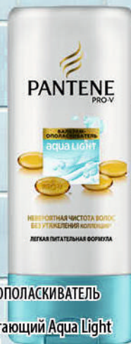
БАЛЬЗАМ-ОПОЛАСКИВАТЕЛЬ PANTENE Легкий питающий Aqua Light 360/400мл