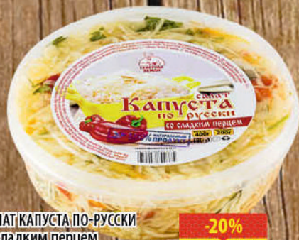
САЛАТ КАПУСТА ПО-РУССКИ со сладким перцем 400г