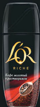
RICHE БАНКА 95Г