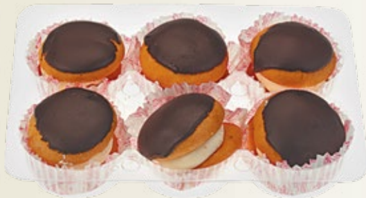
НАБОР ПИРОЖНЫХ «Бушуа» 6 шт. 130 г