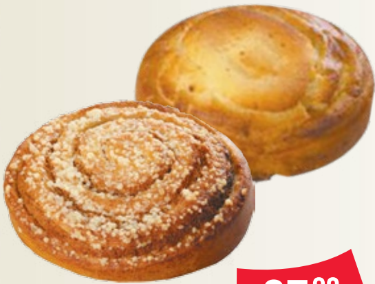
БУЛОЧКА – «Техас» – «Даллас» 109 г