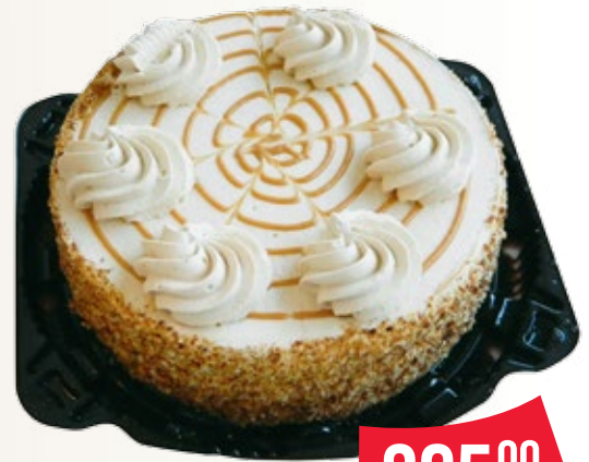
ТОРТ «Крем-брюле» 750 г