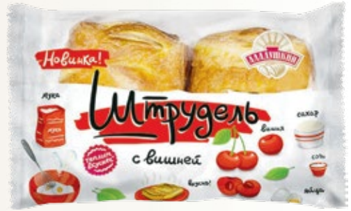
ШТРУДЕЛЬ с вишней 100 г (ГК Дарница)