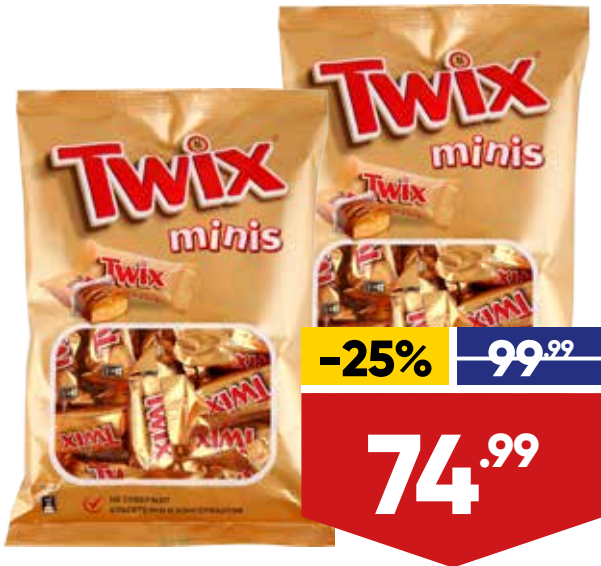
ПЕЧЕНЬЕ TWIX MINIS, 184 г