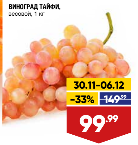
ВИНОГРАД ТАЙФИ, весовой, 1 кг