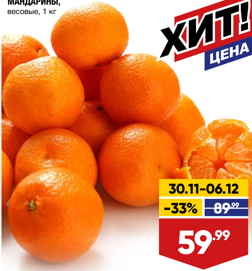
МАНДАРИНЫ, весовые, 1 кг