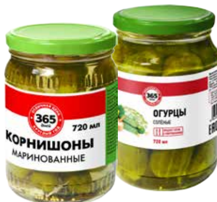
ОВОЩИ 365 ДНЕЙ, 720 мл: - корнишоны маринованные - огурцы соленые