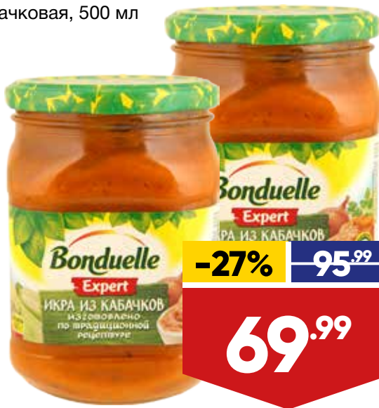
ИКРА BONDUELLE, кабачковая, 500 мл