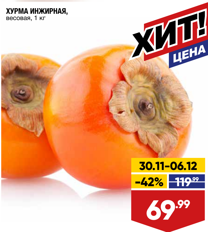
ХУРМА ИНЖИРНАЯ, весовая, 1 кг