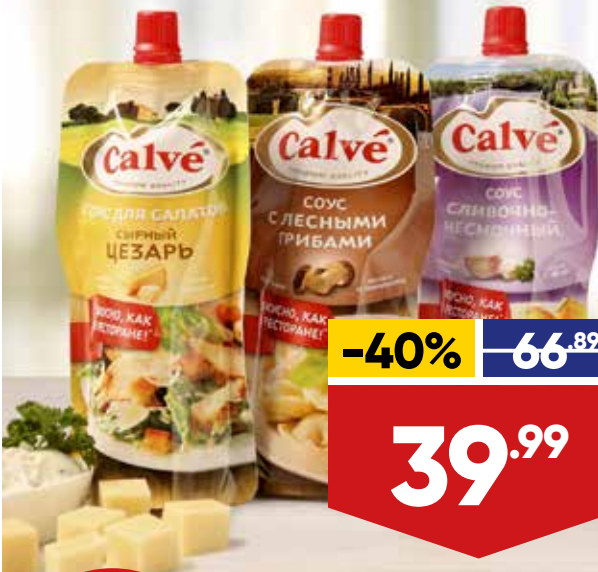
СОУС CALVÉ, 230 г, в ассортименте