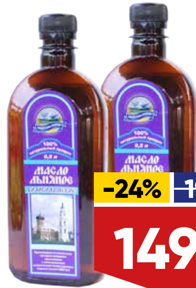
МАСЛО ЛЬНЯНОЕ ВОЛОКОЛАМСКОЕ, 500 мл