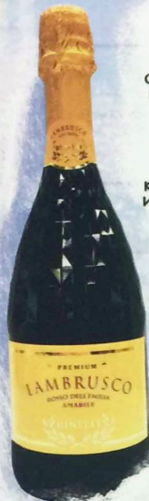
Вино игристое Ламбруско Бинелли Премиум красное полусладкое, алк. 7.5%, 0.75 л Италия

СОРТ ВИНОГРАДА: ЛАМБРУСКО АРОМАТ ВИНА СВЕЖИЙ, ЯРКИЙ С НОТАМИ СПЕЛЫХ ЯГОД ВИНОГРАДА. РОЗОВАЯ БАРХАТНАЯ ПЕНА, КОТОРАЯ ДЕРЖИТСЯ НА ПОВЕРХНОСТИ НЕСКОЛЬКО МГНОВЕНИЙ, КОГДА ВИНО НАЛИВАЮТ В БОКАЛ, ВЕЛИКОЛЕПНА САМА ПО СЕБЕ. ИДЕАЛЬНОЕ ДОПОЛНЕНИЕ К ДЕСЕРТАМ: ПЕЧЕНЬЕ, ТРАДИЦИОННЫЕ ИТАЛЬЯНСКИЕ ПИРОГИ С ФРУКТОВЫМИ ДЖЕМАМИ. РЕКОМЕНДУЕТСЯ ПОДАВАТЬ ОХЛАЖДЕННЫМ ПРИ ТЕМПЕРАТУРЕ +7 - +9°C.