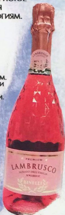
Вино игристое Ламбруско Бинелли Премиум розовое полусладкое, алк. 7.5%, 0.75 л Италия

СОРТ ВИНОГРАДА: ЛАМБРУСКО ОТЛИЧАЕТСЯ СОБЛАЗНИТЕЛЬНЫМ ФРУКТОВЫМ АРОМАТОМ СПЕЛОГО ВИНОГРАДА И СЛАДКОВАТЫМ ВКУСОМ. ПРЕКРАСНО СОЧЕТАЕТСЯ С МЯСНЫМИ ЗАКУСКАМИ, ПАСТАМИ, ЛЕГКИМИ САЛАТАМИ, ФРУКТАМИ И ДЕСЕРТАМИ. РЕКОМЕНДУЕТСЯ ПОДАВАТЬ ОХЛАЖДЕННЫМ ПРИ ТЕМПЕРАТУРЕ +7 - +9°C.