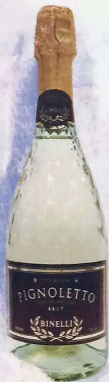
Вино игристое Пинолетто Бинелли Премиум белое брют, алк. 11.5%, 0.75 л Италия

СОРТ ВИНОГРАДА: ГРЕКЕТО ДЖЕНТИЛЕ ОТЛИЧАЕТСЯ ЗОЛОТИСТЫМ ЦВЕТОМ С ЖЕМЧУЖНЫМИ ПЕРЕЛИВАМИ, НЕОБЫКНОВЕННОЙ СВЕЖЕСТЬЮ С ЛЕГКИМ АРОМАТОМ СПЕЛЫХ ФРУКТОВ. ПРЕКРАСНО СОЧЕТАЕТСЯ С САЛАТАМИ, ПАСТОЙ, БЕЛЫМИ СОРТАМИ РЫБЫ И МОРЕПРОДУКТАМИ. РЕКОМЕНДУЕТСЯ ПОДАВАТЬ ОХЛАЖДЕННЫМ ПРИ ТЕМПЕРАТУРЕ +7 - +9°C.