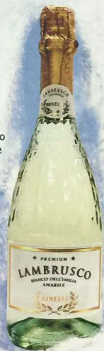
Вино игристое Ламбруско Бинелли Премиум белое полусладкое, алк. 7.5%, 0.75 л Италия

СОРТ ВИНОГРАДА: ЛАМБРУСКО ОТЛИЧАЕТСЯ ЗОЛОТИСТЫМ ЦВЕТОМ, НЕОБЫКНОВЕННОЙ СВЕЖЕСТЬЮ, СОБЛАЗНИТЕЛЬНЫМ АРОМАТОМ СПЕЛЫХ ЯГОД С МЕДОВЫМИ НОТКАМИ. ПРЕКРАСНО ПОДОЙДЕТ ДЛЯ ЗАВЕРШЕНИЯ ТРАПЕЗЫ, К РАЗЛИЧНЫМ ДЕСЕРТАМ И ФРУКТОВЫМ САЛАТАМ. РЕКОМЕНДУЕТСЯ ПОДАВАТЬ ОХЛАЖДЕННЫМ ПРИ ТЕМПЕРАТУРЕ +7 - +9°C.