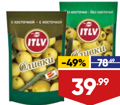
ОЛИВКИ ITLV, зеленые, с косточкой/без косточки, 195 г