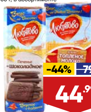
ПЕЧЕНЬЕ ЛЮБЯТОВО, 200-400 г, в ассортименте