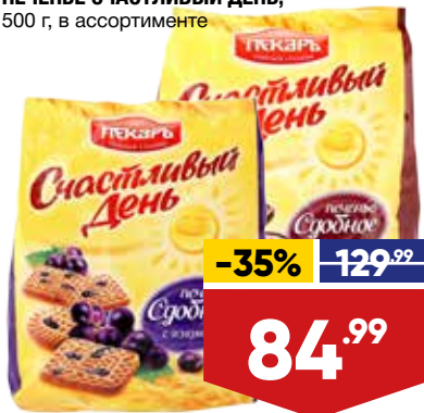
ПЕЧЕНЬЕ СЧАСТЛИВЫЙ ДЕНЬ, 500 г, в ассортименте