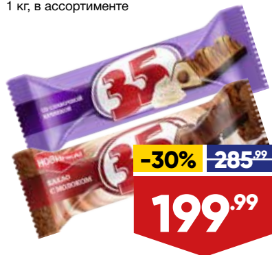
КОНФЕТЫ 35, весовые, 1 кг, в ассортименте