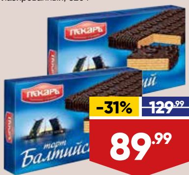
ТОРТ ПЕКАРЬ БАЛТИЙСКИЙ, вафельный, глазированный, 320 г