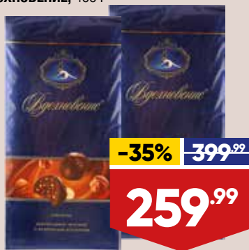
КОНФЕТЫ КРАСНЫЙ ОКТЯБРЬ ВДОХНОВЕНИЕ, 400 г