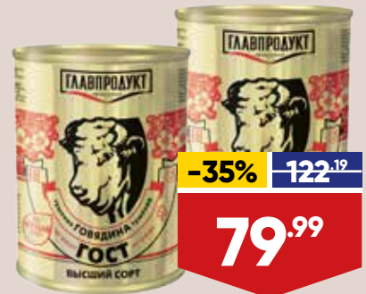
ГОВЯДИНА ГЛАВПРОДУКТ, тушеная, высший сорт, 338 г