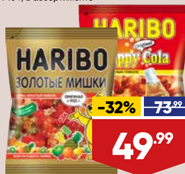
МАРМЕЛАД HARIBO, жевательный, 140 г, в ассортименте