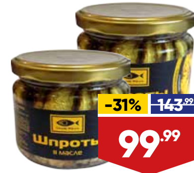
ШПРОТЫ STELLA MARIS, в масле, 250 г