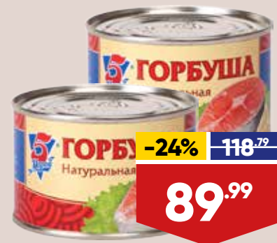
ГОРБУША 5 МОРЕЙ, натуральная, 245 г