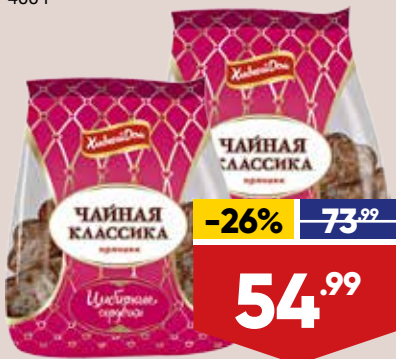
ПРЯНИКИ ХЛЕБНЫЙ ДОМ ИМБИРНЫЕ, 400 г