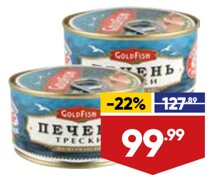
ПЕЧЕНЬ ТРЕСКИ GOLD FISH ПО-МУРМАНСКИ, 190 г