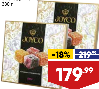
МАРМЕЛАД JOYCO, с сухофруктами, 330 г