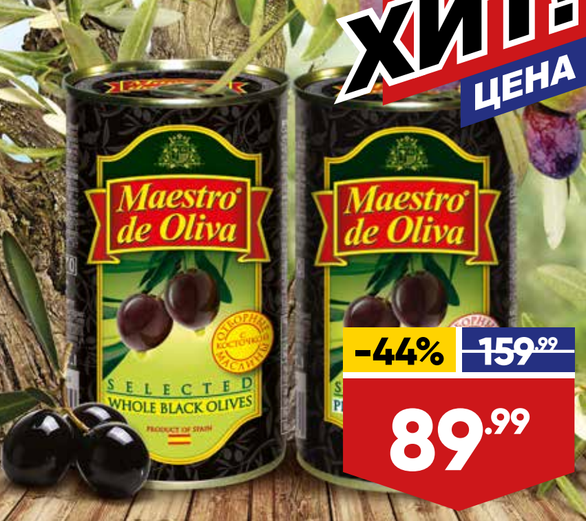
МАСЛИНЫ MAESTRO DE OLIVA, отборные, с косточкой/без косточки, 360 г