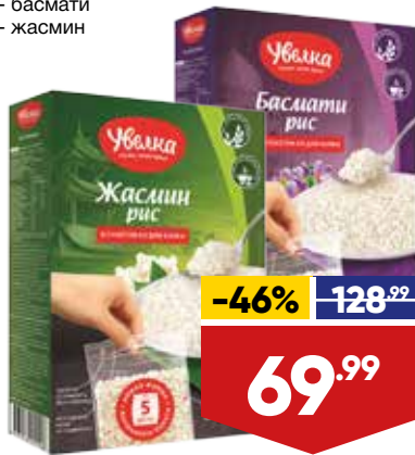
РИС УВЕЛКА, 80 г х 5 пак. в уп.: - басмати - жасмин