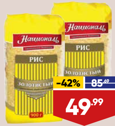
РИС НАЦИОНАЛЬ ЗОЛОТИСТЫЙ, 900 г