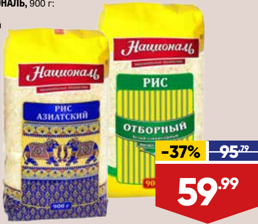
РИС НАЦИОНАЛЬ , 900 г: - отборный - азиатский