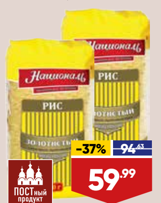
РИС НАЦИОНАЛЬ ЗОЛОТИСТЫЙ, 900 г