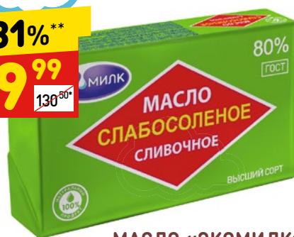
МАСЛО «ЭКОМИЛК» сливочное слабосоленое, 80%, 180 г