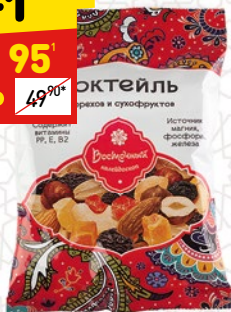
КОКТЕЙЛЬ «ВОСТОЧНЫЙ КАЛЕЙДОСКОП» из орехов и сухофруктов, 50 г

1 цена за 1 шт. при покупке 2 шт. единовременно