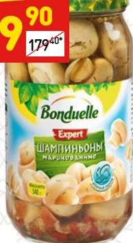
ШАМПИньОНЫ BONDUELLE маринованные целые, с/б, 580 мл