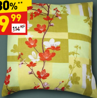
НАВОЛОЧКА «СЭМИ» «Город 37», 70 x 70 см