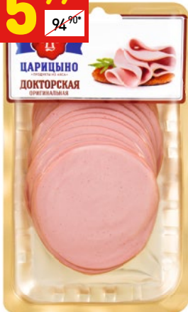
КОЛБАСА «ДОКТОРСКАЯ» ориг. вар. «Царицыно», нар., 200 г