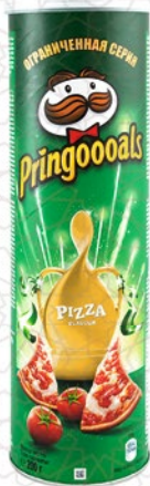
ЧИПСЫ PRINGOALS ПИЦЦА 200 г