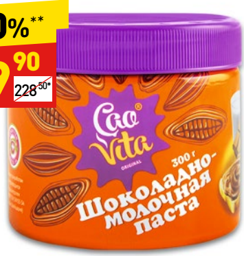
ПАСТА CAOVITA шоколадно-молочная, 300 г