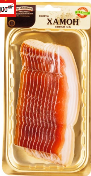
ОКОРОК СВИНОЙ «ХАМОН» «ЕКФ», с/к, нар., 55 г