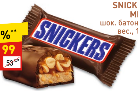
КОНФЕТЫ SNICKERS MINIS шок. батончик, вес., 100 г