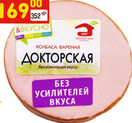
КОЛБАСА «ДОКТОРСКАЯ» «МД Бородина», вар., син., в/у, 500 г