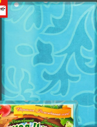
КОМПЛЕКТ ПОСТЕЛЬНОГО БЕЛЬЯ «ПРОТЕКС» микрофибра, 1,5-сп., 1 шт.