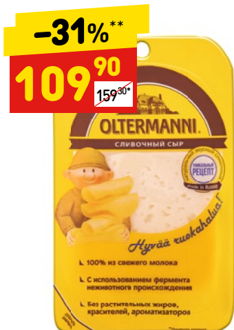
СЫР OLTERMANNI сливочный, 45%, нар., 130 г