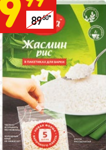
РИС ЖАСМИН в пакетах, «Увелка», 400 г