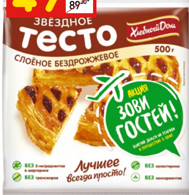
ТЕСТО «ЗВЕЗДНОЕ» слоеное бездрожжевое, зам., 500 г