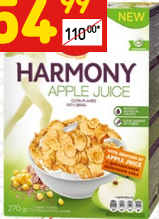
АХА HARMONY хлопья кукурузные с отрубями и яблочным соком, 270 г