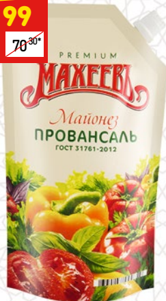
МАЙОНЕЗ ПРОВАНСАЛЬ «Махеев», 50,5%, д/п, 400 мл