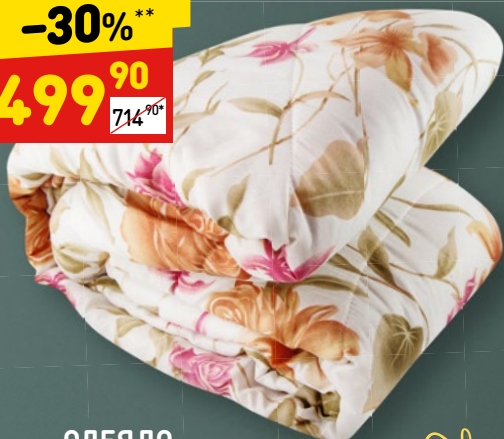
ОДЕЯЛО «МИКРОФАЙБЕР» 2-сп.