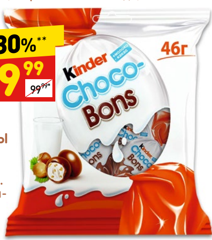
КОНФЕТЫ ШОСО- BONS из молочн. шок. с мол-орех нач., 46 г