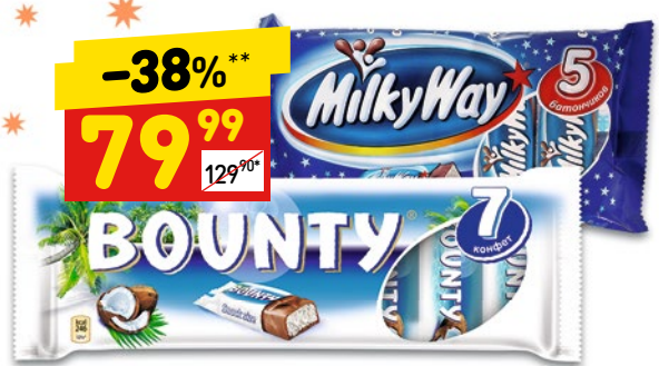
ШОКОЛАДНЫЕ БАТОНЧИКИ в асс.: Bountу мультипак 7x27,5 г, 192,5 г, Milky Way мультипак, 130 г