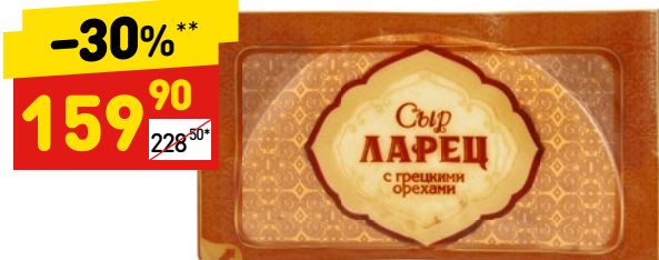
СЫР ЛАРЕЦ с грецкими орехами, 50%, 255 г