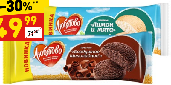
ПЕЧЕНЬЕ «ЛЮБЯТОВО» сдобное, в асс.: воздушное шоколадное, лимон-мята, 250 г