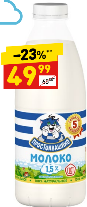
МОЛОКО «ПРОСТОКВАШИНО» паст., 1,5%, 930 мл