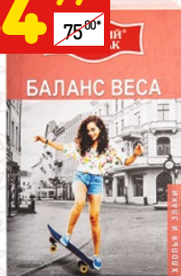
ХЛОПЬЯ «БАЛАНС ВЕСА» «Русский завтрак», 240 г