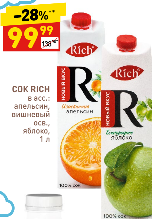
СОК RICH в асс.: апельсин, вишневый, осв., яблоко, 1 л