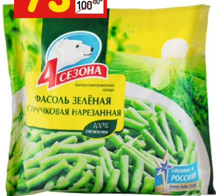
ФАСОЛЬ «4 СЕЗОНА» стручковая зеленая, нар., зам., 400 г