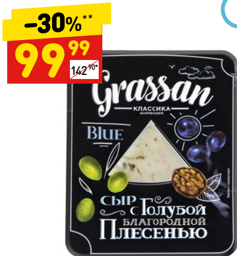
СЫР GRASSAN с благородной голубой плесенью, 50%, 100 г