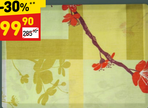
ПРОСТЫНЯ «СЭМИ» «Город 37», 2-сп.