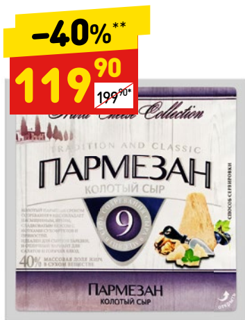
ПАРМЕЗАН HARD CHEESE COLLECTION 9 мес., колот., 40%, 100 г