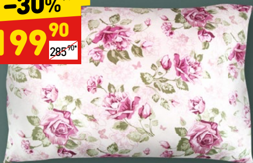
ПОДУШКА «ЭКО», «МИКРОФАЙБЕР» 50 x 70 см