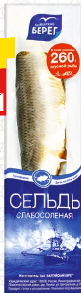
СЕЛЬДЬ ТИХООКЕАНСКАЯ «Балтийский берег», с/с, в/у, 260 г