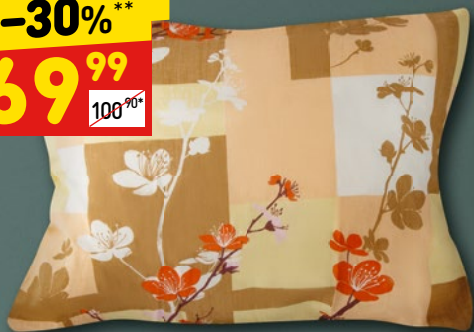
НАВОЛОЧКА «СЭМИ» «Город 37», 50 x 70 см