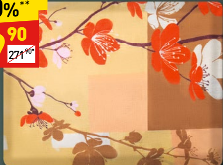
ПРОСТЫНЯ «СЭМИ» «Город 37», 1,5-сп.