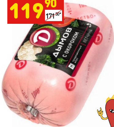
ВЕТЧИНА С ОКОРОКОМ «Дымов», п/а, 400 г