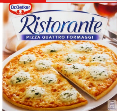
ПИЦЦА RISTORANTE «4 ВИДА СЫРА» Dr.Oetker, 340 г