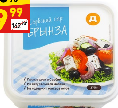
БРЫНЗА СЕРБСКАЯ «Д» 45%, 275 г