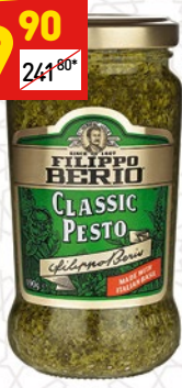
СОУС ПЕСТО Filippo Berio Classic, с/б, 190 г