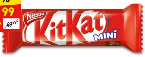
КОНФЕТЫ КИТ-КАТ молочный шоколад с хруст. вафлями, вес., 100 г