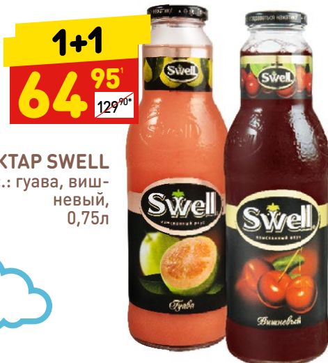
НЕКТАР SWELL в асс.: гуава, вишневый, 0,75л