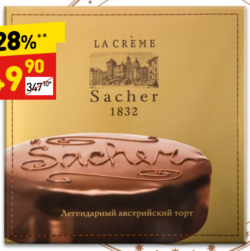
ТОРТ SACHER La creme, 600 г