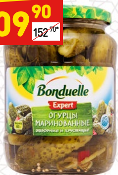
ОГУРЦЫ BONDUELLE маринованные, 6–9 см, с/б, 680 г