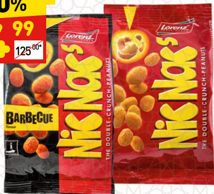
АРАХИС ХРУСТЯЩИЙ NISNACS' в асс.: барбекю, сыр-лук, 110 г