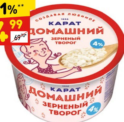
ТВОРОГ ДОМАШНИЙ «КАРАТ» зереный, 4%, п/ст, 200 г