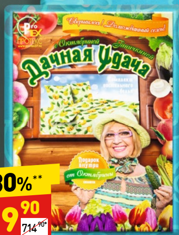
КОМПЛЕКТ ПОСТЕЛЬНОГО БЕЛЬЯ «ПРОТЕКС» микрофибра, 2-сп., 1 шт.