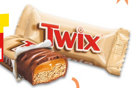
КОНФЕТЫ TWIX MINIS песочное печенье с шоколадом, вес., 100 г