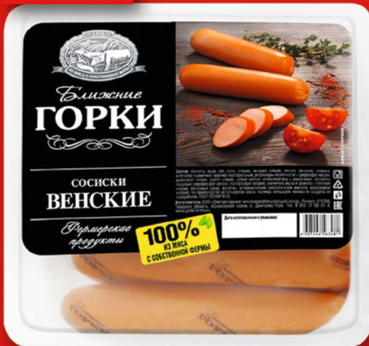
СОСИСКИ «ВЕНСКИЕ» «Ближние горки», ц/о, упак., 450 г

Сосиски «Венские» от бренда «Ближние горки» производятся по классической рецептуре: из охлажденной свинины и говядины с добавлением молока и натуральных специй и пряностей. Именно сочетание 2 видов мяса, пряностей и определенная степень копчения обеспечивают тот самый неповторимый вкус традиционных венских сосисок.