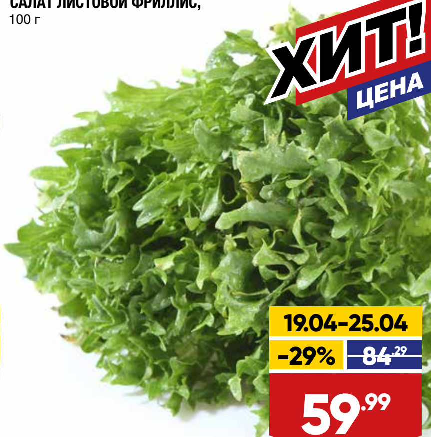
САЛАТ ЛИСТОВОЙ ФРИЛЛИС, 100 г