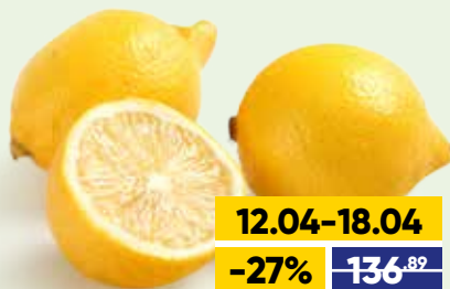
ЛИМОНЫ, весовые, 1 кг