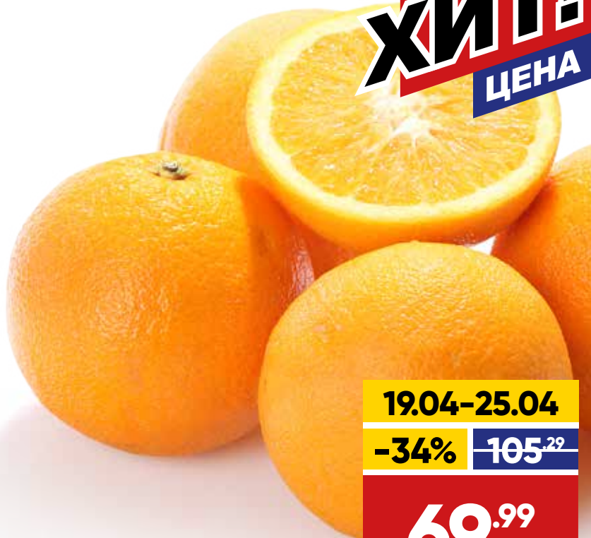
АПЕЛЬСИНЫ, весовые, 1 кг