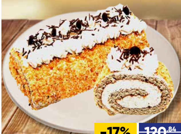
ТОРТ-РУЛЕТ КОНФИ-ТЕРРА СЛИВОЧНЫЙ, 500 г