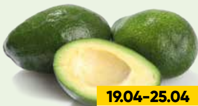
АВОКАДО, 1 шт.