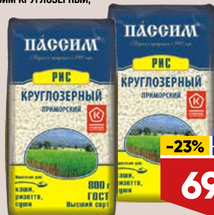
РИС ПАССИМ КРУГЛОЗЕРНЫЙ, 800 г