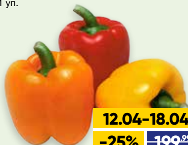
ПЕРЕЦ МИКС, 1 уп.