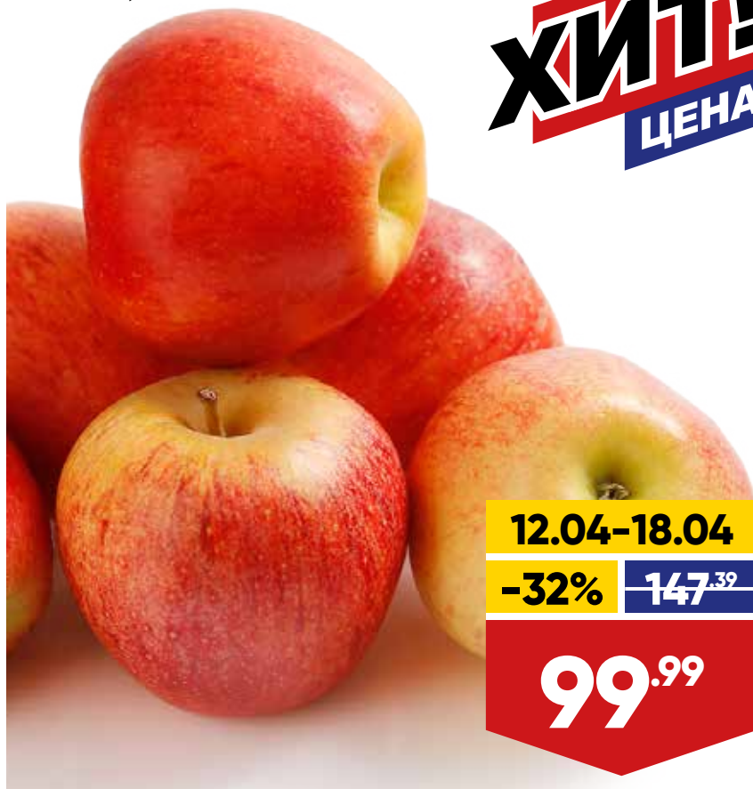
ЯБЛОКИ РОЯЛ ГАЛА, весовые, 1 кг