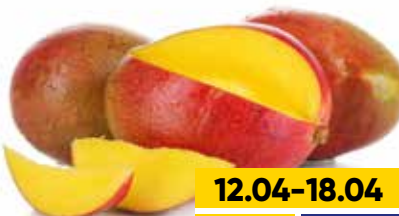
МАНГО, 1 шт.