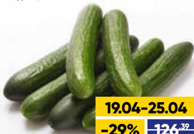
ОГУРЦЫ СРЕДНЕПЛОДНЫЕ, гладкие, 600 г