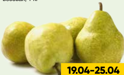
ГРУША ПАКХАМ, весовая, 1 кг