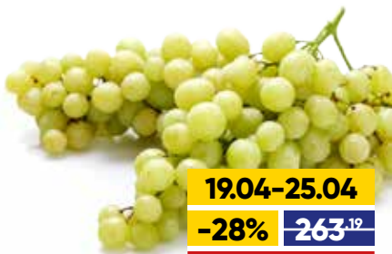
ВИНОГРАД ЗЕЛЕНЬИЙ, весовой, 1 кг