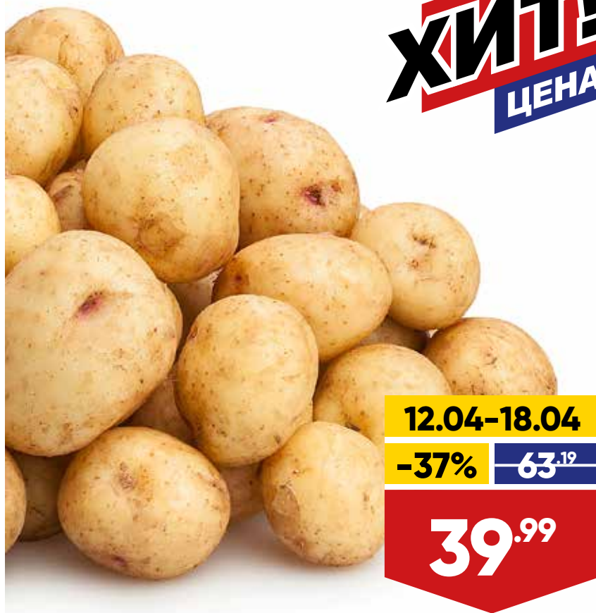
КАРТОФЕЛЬ МОЛОДОЙ, весовой, 1 кг