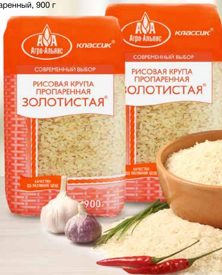
РИС АГРО-АЛЬЯНС, пропаренный, 900 г