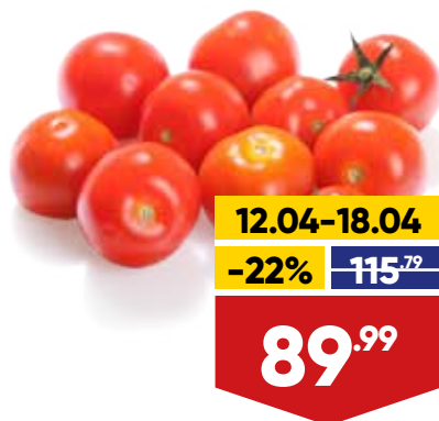
ТОМАТЫ ЧЕРРИ, красные, тепличные, 250 г