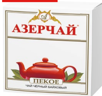
ЧАЙ «АЗЕРЧАЙ» пекое, черный байховый, 100 г