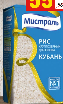
РИС «МИСТРАЛЬ» для плова, круглозерный, 900 г