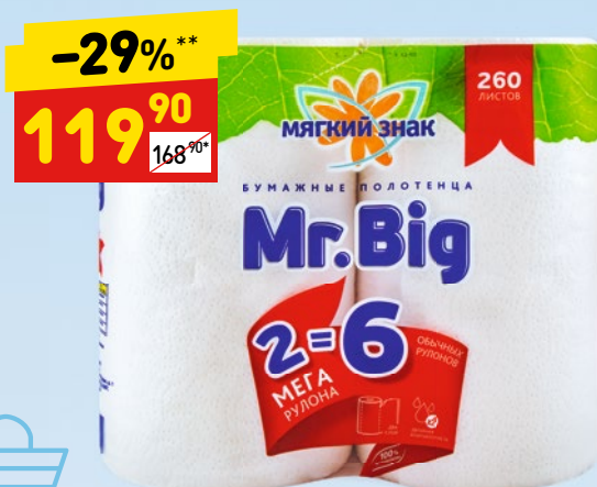
ПОЛОТЕНЦА БУМАЖНЫЕ MR. BIG «Мягкий знак», 2-сл., 2 шт.