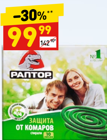
СПИРАЛЬ ОТ КОМАРОВ «Раптор», 10 шт.