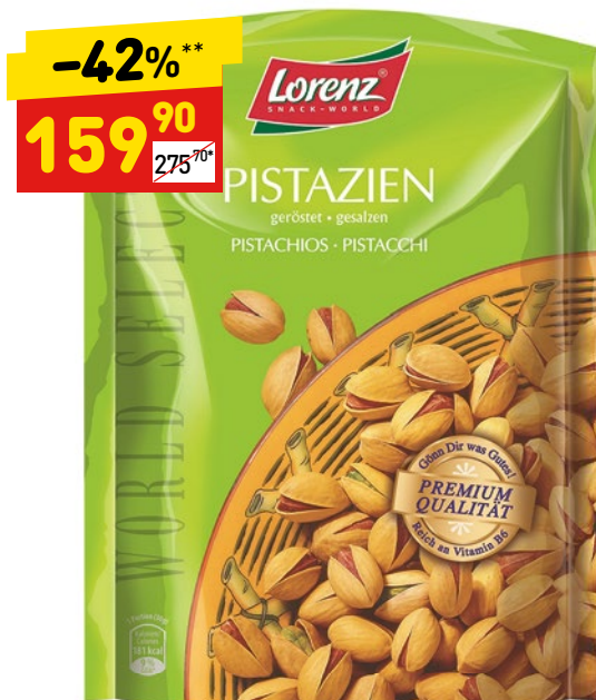
ФИСТАШКИ LORENZ 100 г