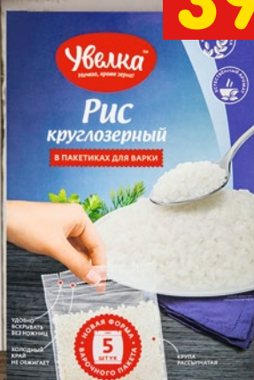
РИС «УВЕЛКА» круглозерный, в пакетах, 5 x 80 г, 400 г