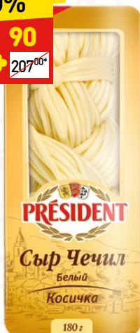
ЧЕЧИЛ PRESIDENT косичка, белый, 35%, 180 г