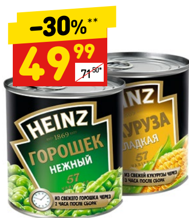
ОВОЩИ HEINZ консерв., горошек зеленый, кукуруза, ж/б, 340 г