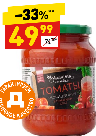
ТОМАТЫ «ОВОЩНАЯ СЕМЕЙКА» в томатном соке, с/б, 720 мл