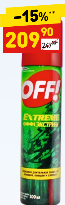
OFF EXTREME аэрозоль от комаров и клещей, 100 мл