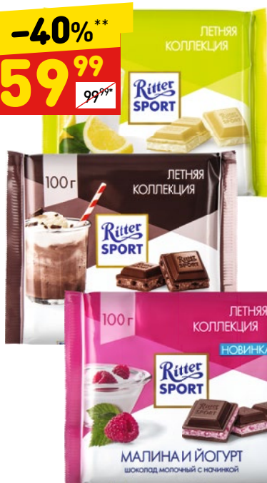
ШОКОЛАД RITTER SPORT в асс.: малина и йогурт, какао-крем, лимон и йогурт, 100 г