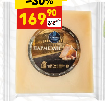
ПАРМЕЗАН «Кабош», 200 г