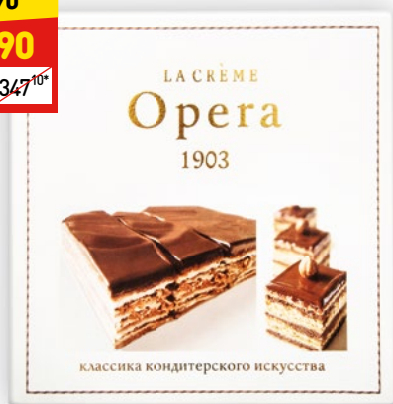
ТОРТ OPERA LA CRÈME 600 г