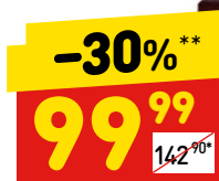
НАБОР СОУСОВ «СЛАВЯНСКИЙ ДАР» аджика сладко-острая, хреновина, горчица

1 цена за 1 шт. при покупке 2 шт. одновременно