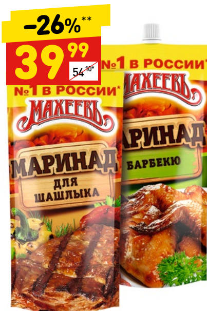
МАРИНАД «МАХЕЕВЪ» в асс.: для шашлыка, барбекю, 300 г

Устройте куриным крылышкам настоящий заплыв! Перед погружением в огненный гриль искупайте их в томатном маринаде. После такого плавания любые крылышки станут отличным угощением для вкусных ощущений.