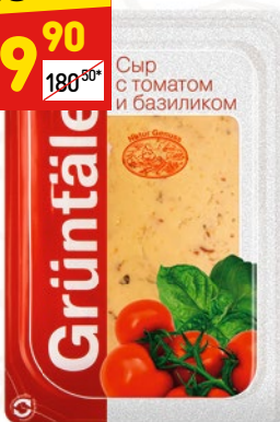
СЫР GRÜNTALER томат-базилик, 50%, нар., 150 г