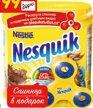
КАКАО NESQUIK + СПИННЕР витамины+минералы, п/б, 500 г