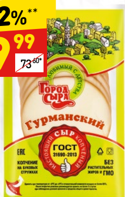
СЫР «ГОРОД СЫРА» плавленный колбасный копченый, 40%, нар., 125 г