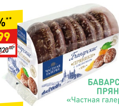
БАВАРСКИЕ ПРЯНИКИ «Частная галерея», 175 г