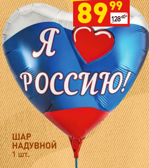
ШАР НАДУВНОЙ 1 шт.