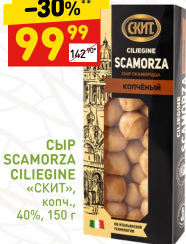
СЫР SCAMORZA CILIEGINE «СКИТ», копч., 40%, 150 г