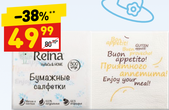
САЛФЕТКИ REINA 1-сл., с рис., 300 шт.