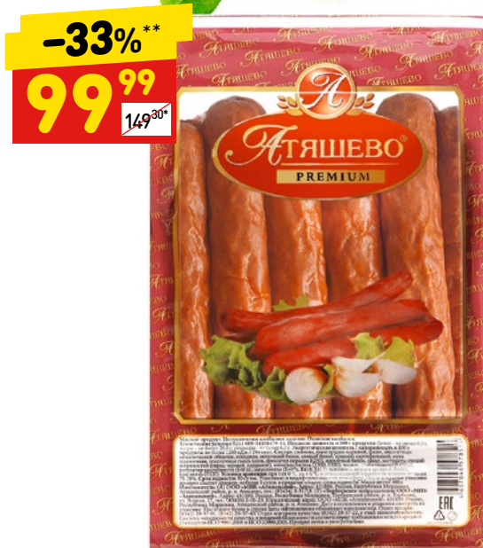
КОЛБАСКИ «ОХОТСКИЕ» «Атяшево», п/к, 500 г