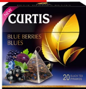
ЧАЙ CURTIS Blue Berries Blues, черн., 20 пак. x 1,8 г, 36 г