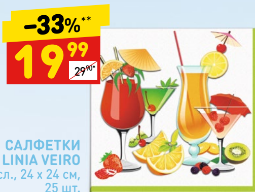
САЛФЕТКИ LINIA VEIRO 2-сл., 24 x 24 см, 25 шт.