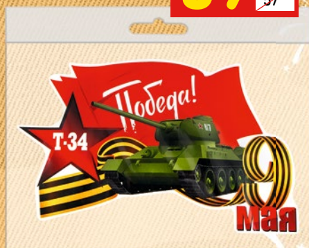
НАКЛЕЙКА НА СТЕКЛО на белой подложке, 12 x 12 см