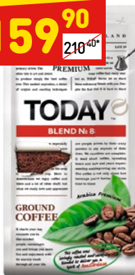
КОФЕ TODAY BLEND мол., м/у, 200 г