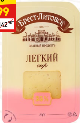
СЫР «БРЕСТ-ЛИТОВСК» легкий, 35%, нар., 150 г