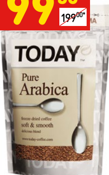
КОФЕ TODAY PURE ARABICA раств., м/у, 75 г