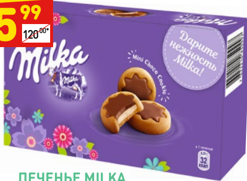
ПЕЧЕНЬЕ MILKA с молочной начинкой в мол. шоколаде, 150 г