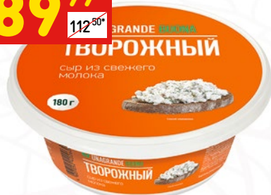
СЫР ТВОРОЖНЫЙ Unagrande, 180 г