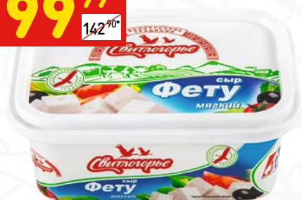
СЫР ФЕТУ «Свитлогорье», 250 г