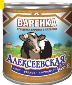
ВАРЕНКА «АЛЕКСЕЕВСКАЯ» с сахаром, ж/б, 370 г