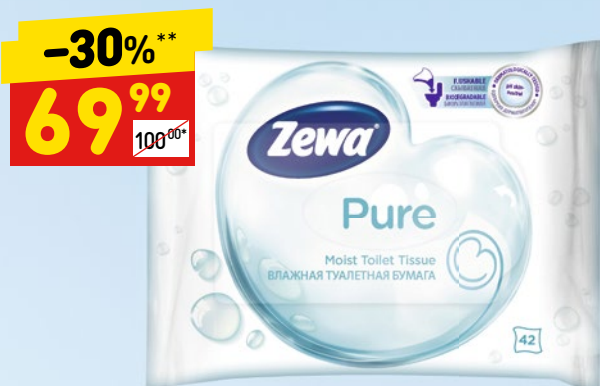
ТУАЛЕТНАЯ БУМАГА ZEWA PURE, влажн., 42 шт.

Что взять с собой на природу на майские праздники? Это не только свежие и вкусные продукты, но еще и все для удобства и красоты. Чтобы праздники прошли комфортно, подумайте не только о столе, но и о себе.