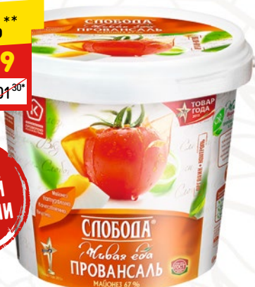
СЛОБОДА ПРОВАНСАЛЬ ведро, 900 мл