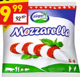
СЫР МОЦАРЕЛЛА Zuger, 45%, 100 г