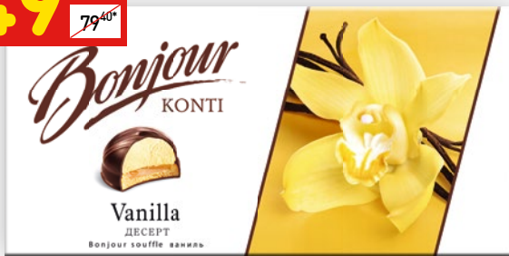
ПЕЧЕНЬЕ С СУФЛЕ BONJOUR «Конти», ваниль, 232 г