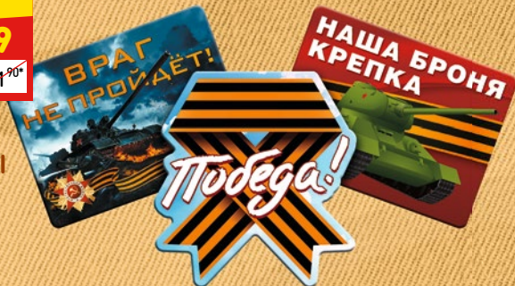
МАГНИТЫ «9 МАЯ» 1 шт.