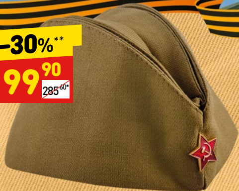
ПИЛОТКА СОЛДАТСКАЯ без подклада