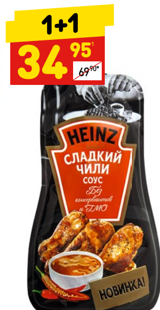
СОУС СЛАДКИЙ ЧИЛИ HEINZ д/пак, 230 г

1 цена за 1 шт. при покупке 2 шт. одновременно