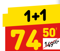
КАБАНОССИ «ЗАЛЬЦБУРГ» «Ладога», п/к, 300 г