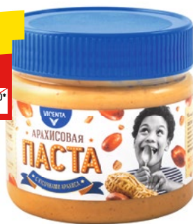
АРАХИСОВАЯ ПАСТА VICENTA с кусочками арахиса, 250 г