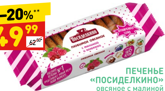
ПЕЧЕНЬЕ «ПОСИДЕЛКИНО» овсяное с малиной и клюквой, 310 г