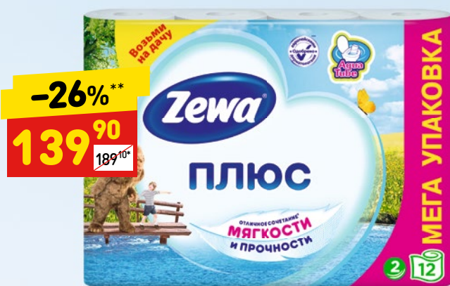
ТУАЛЕТНАЯ БУМАГА ZEWA 2-сл., белая, 12 шт.