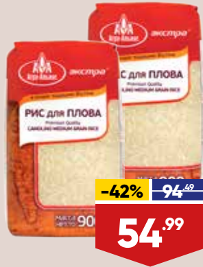
РИС АГРО-АЛЬЯНС ЭКСТРА для ПЛОВА, 900 г