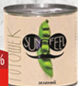
Горошек SUNFEEL 400 Г