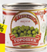
Горошек ПРИНЦЕССА ВКУСА 425 мл