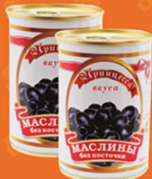
Маслины ПРИНЦЕССА ВКУСА без косточки, 300 мл