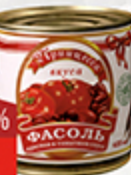
Фасоль красная ПРИНЦЕССА ВКУСА 490 г