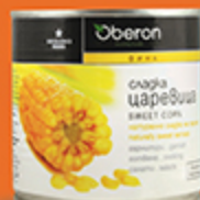
Кукуруза OBERON 340 г