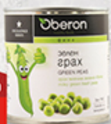
Горошек OBERON 400 г