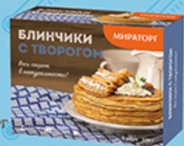
Блинчики МИРАТОРГ с творогом, 370 г