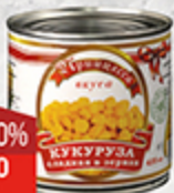
Кукуруза ПРИНЦЕССА ВКУСА 425 г