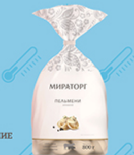
Пельмени ДОМАШНИЕ МИРАТОРГ свино-говяжьи, 800 г