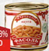
Фасоль белая ПРИНЦЕССА ВКУСА 480 г