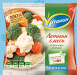
Смесь овощная ЛЕТНЯЯ ВИТАМИН Мираторг, 400 г