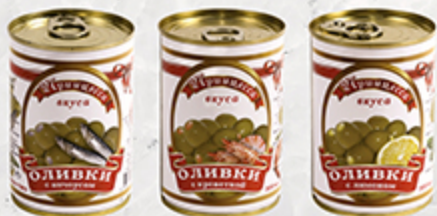
Оливки ПРИНЦЕССА ВКУСА с анчоусом, с лимоном, с креветками, 300 мл