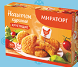
Наггетсы куриные МИРАТОРГ хрустящие, 300 г