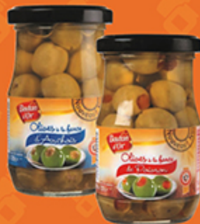
Оливки BOUTON DOR фаршированные анчоусом, красным перцем, 120 г