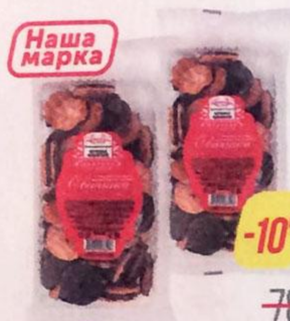
Печенье ЧУДЕСНЫЙ КРАЙ , С сахарной посыпкой В шоколадной глазури, 375 г