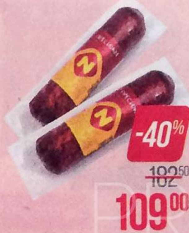
Колбаса ПРЕСИЖН , По-останкински, сырокопченая (ОМПК), 250 г