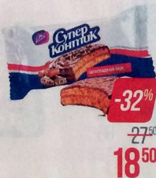
Печенье СУПЕР КОНТИК , шоколадное, 100 г