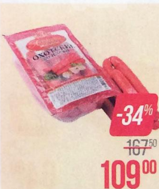
Колбаски ОХОТСКИЕ , Полукопченые (МПК Атяшевский), 500 г