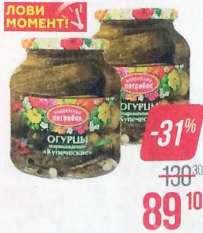
Огурцы ВАЛДАЙСКИЙ ПОГРЕБОК , Купеческие, 650 г