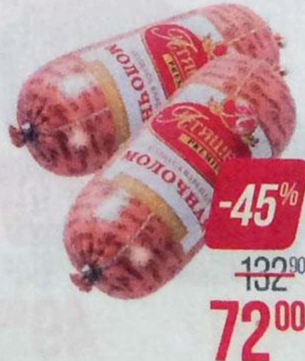
Колбаса МОЛОЧНАЯ , Вареная, Премиум, мини (Атяшевский МПК), 500 г