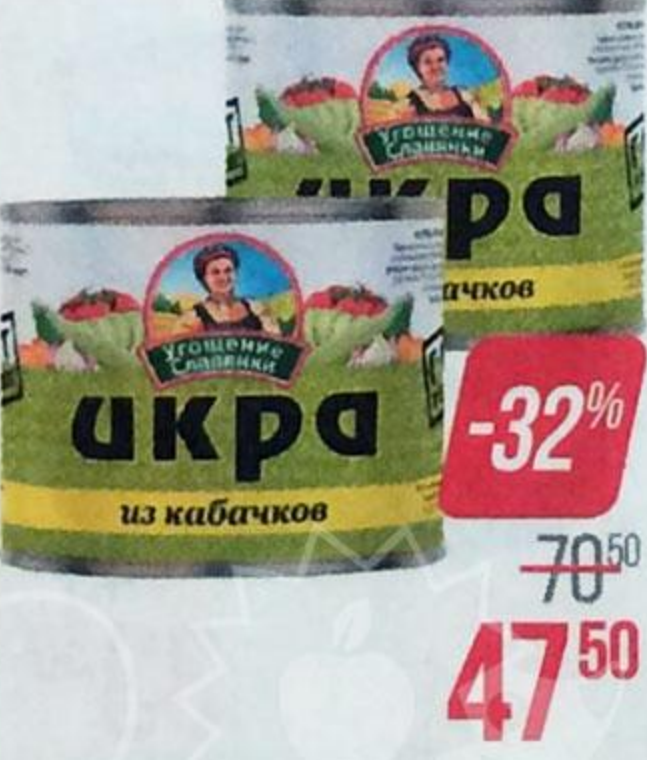
Икра кабачковая УГОЩЕНИЕ СЛАВЯНКИ , 545 г