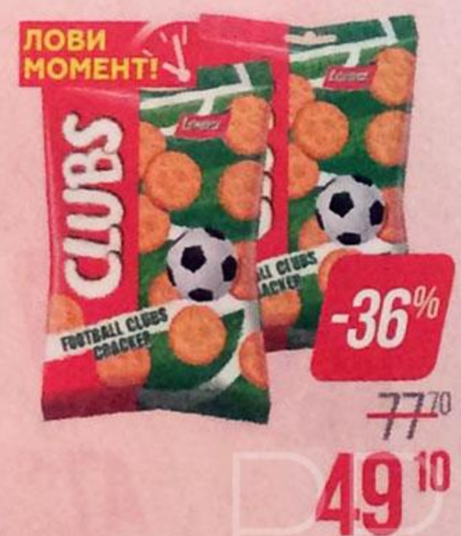
Крекер ЛОРЕНЦ , Футбол Клубс, 100 г