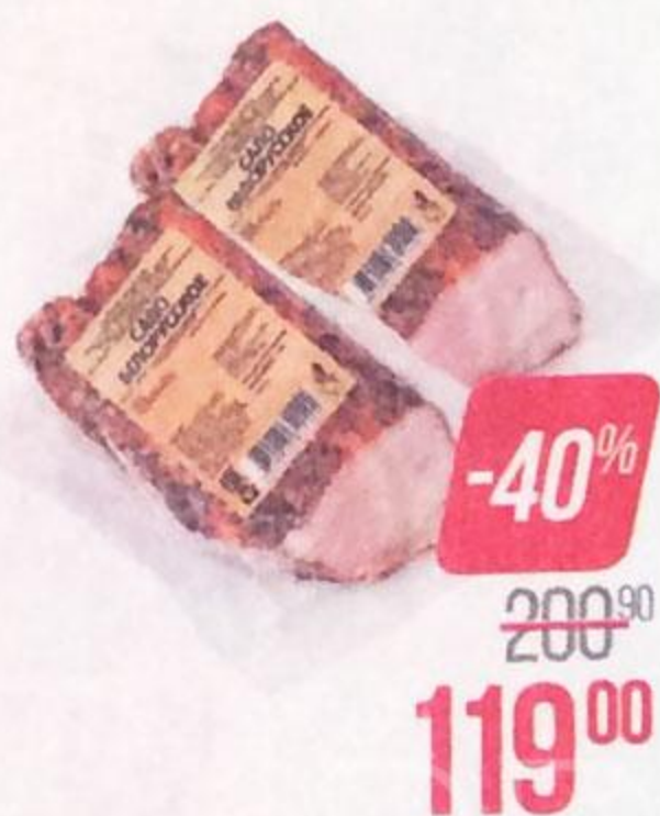
Сало БЕЛУРУССКОЕ , Копчено-вареное (Копченое), 370 г