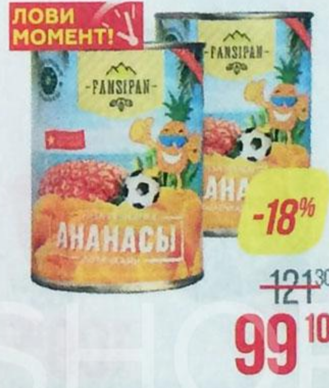
Ананасы ФАНСИПАН , кольца, в сиропе, 565 г