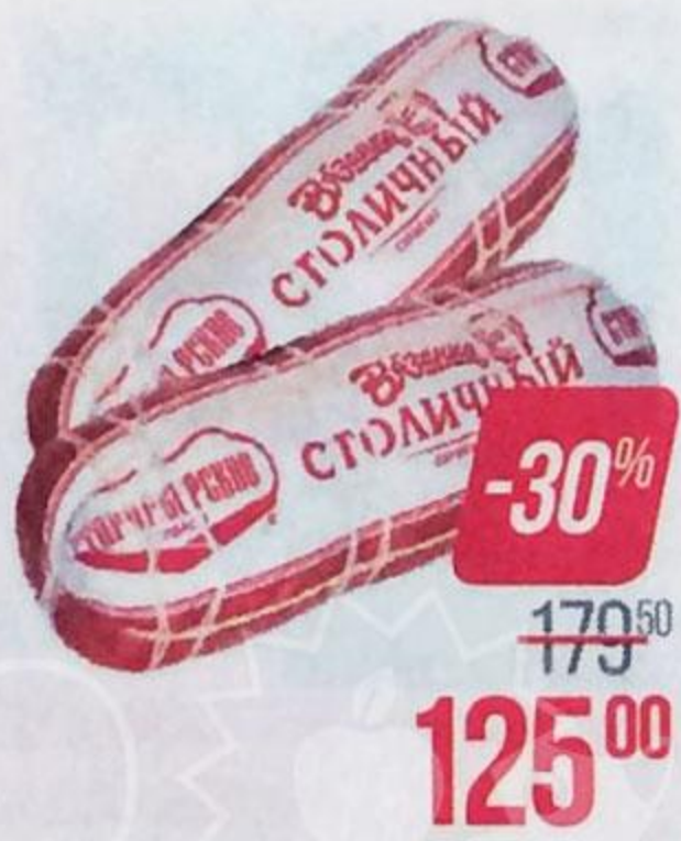
Сервелат СТОЛИЧНЫЙ , Вязанка, Варено-копченый (Стародворские колбасы), 350 г