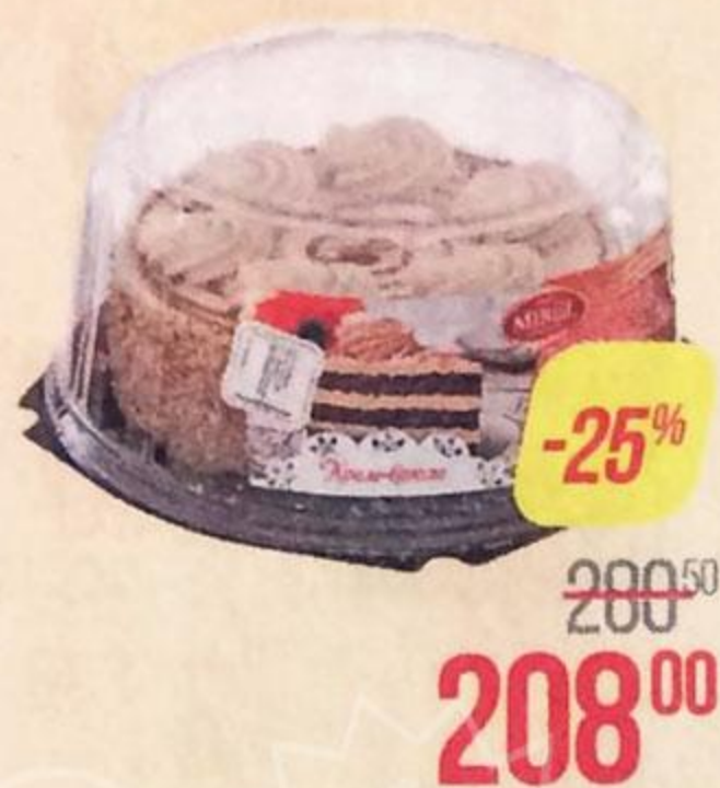
Торт КРЕМ-БРЮЛЕ , Мирэль (Хлебпром ОАО), 750 г