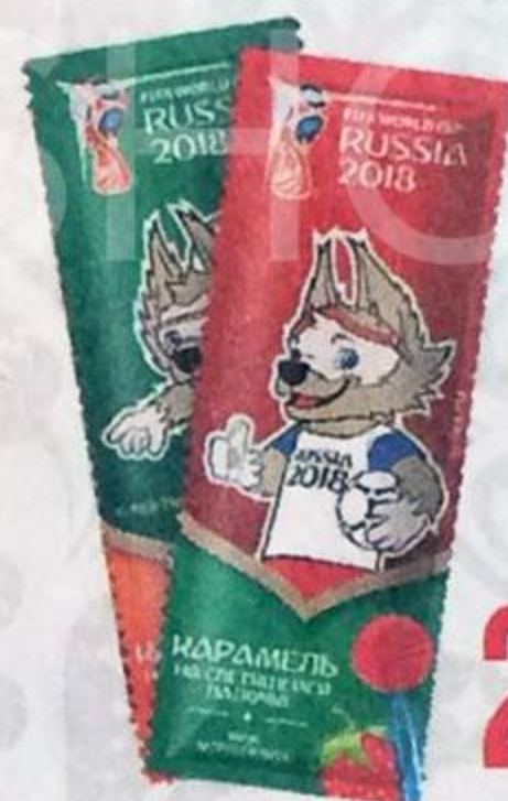
КАРАМЕЛЬ , на палочке, 10 г

Официальная лицензионная продукция Чемпионата мира по футболу FIFA 2018 в России™