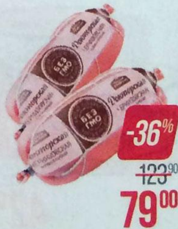
Колбаса ДОКТОРСКАЯ , Черкизовская (ЧМПЗ), 500 г