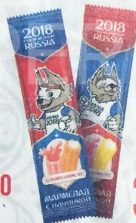
МАРМЕЛАД , жевательный, с начинкой, 16 г