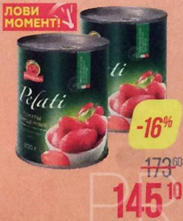
Томаты ПОМИДОРКА , Пелати, очищенные, в собственном соку, 800 г