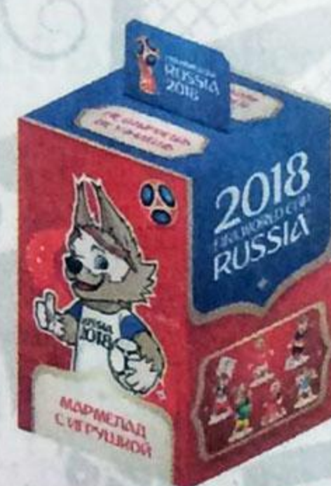
МАРМЕЛАД , с натуральным соком, 10 г