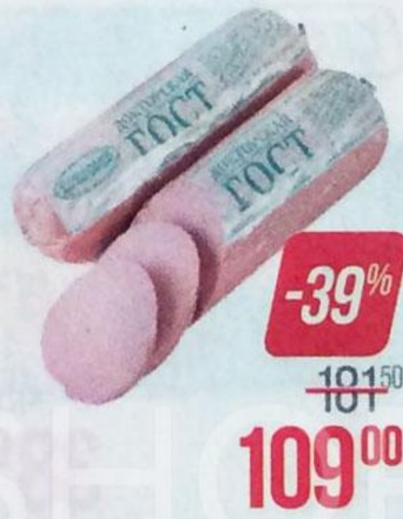
Колбаса ДОКТОРСКАЯ , ГОСТ (Великолукский МК), 500 г