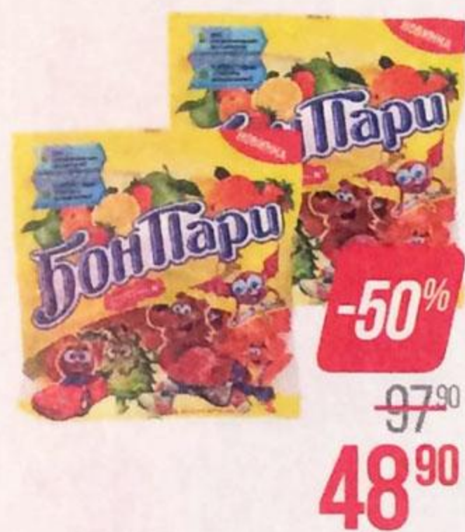
Мармелад жевательный БОН ПАРИ , Медвежонок и Ко, 150 г