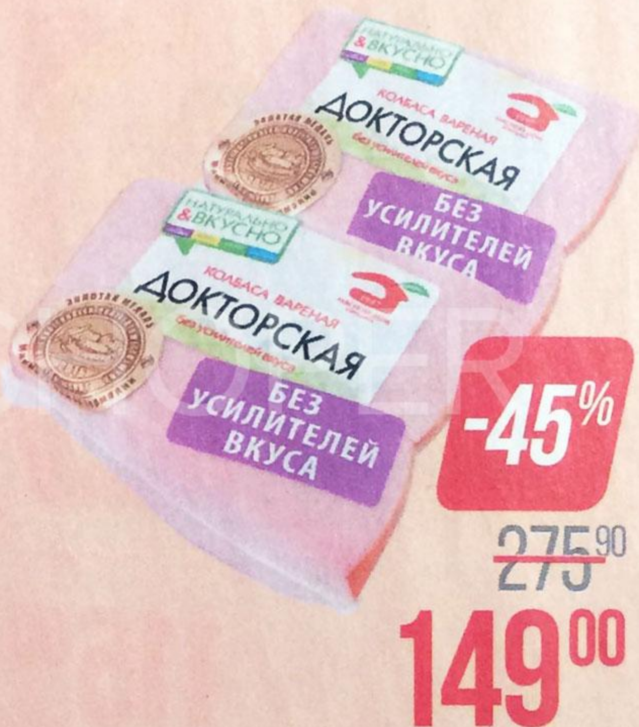
Колбаса ДОКТОРСКАЯ , ГОСТ (МД Бородина), 500 г