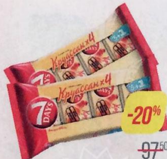
Круасаны СЕВЕН ДЭЙЗ , какао 3+1, 260 г