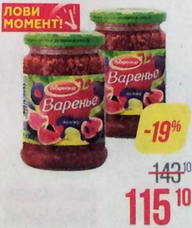
Варенье АБРИКО , инжирное, 390 г