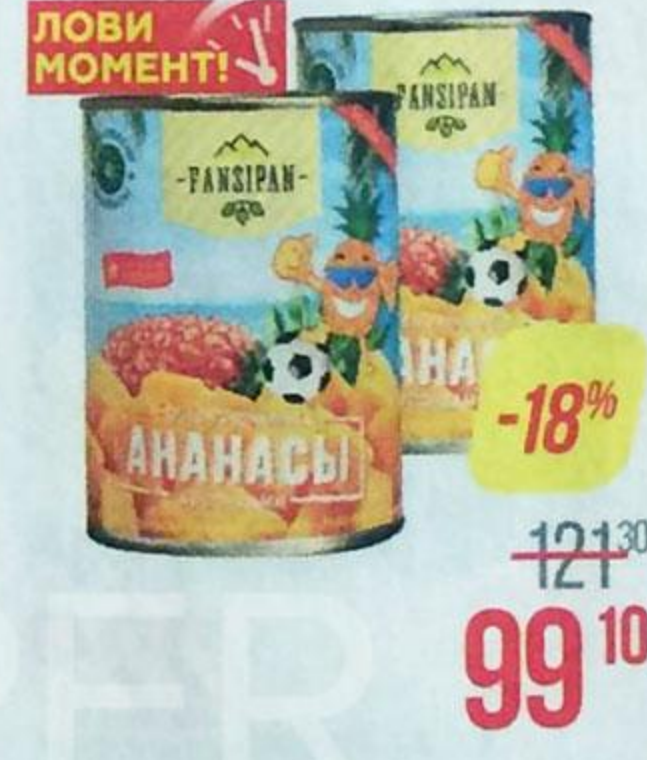
Ананасы ФАНСИПАН , кусочки в сиропе, 565 г