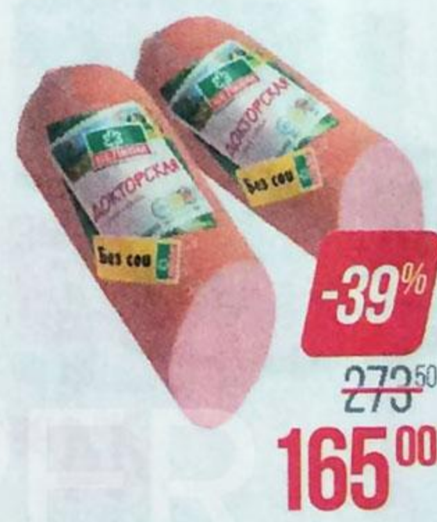
Колбаса ДОКТОРСКАЯ , Вареная (Велком), 440 г