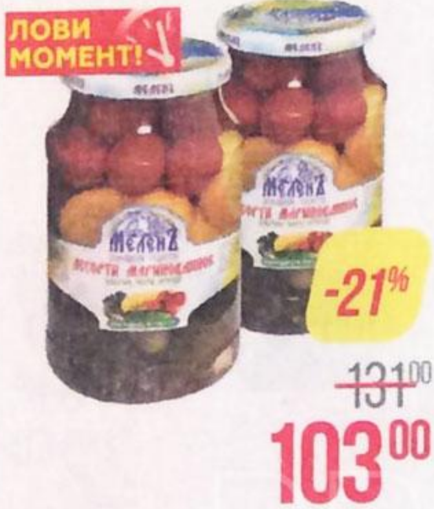
Ассорти МЕЛЕНЬ , Кабачки-черри-огурцы, 900 г