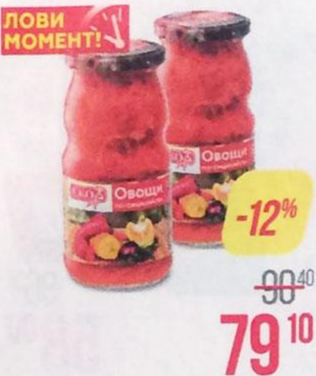
Овощи ЕКО , по-сицилийски, 500 г