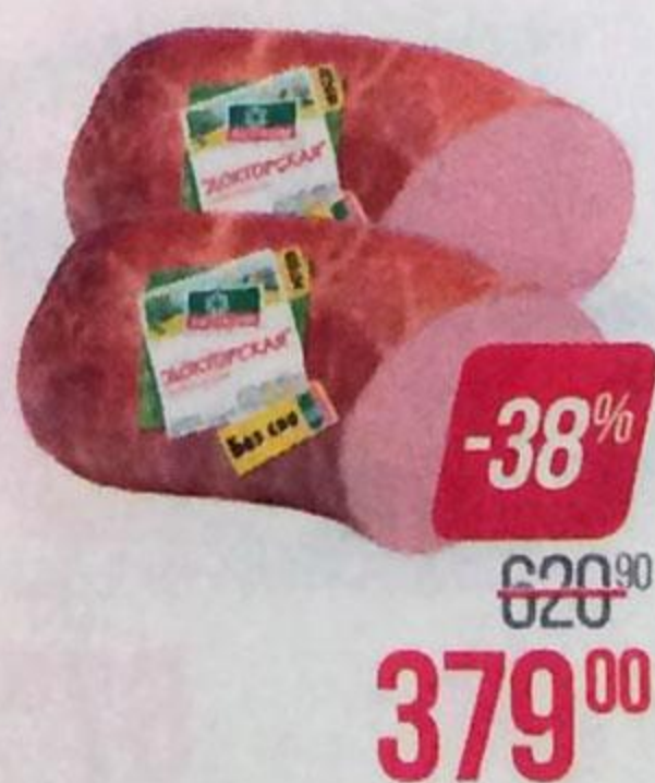
Колбаса ДОКТОРСКАЯ (Велком), 1 кг