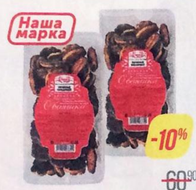
Печенье ЧУДЕСНЫЙ КРАЙ , с маком, в шоколадной глазури, 375 г