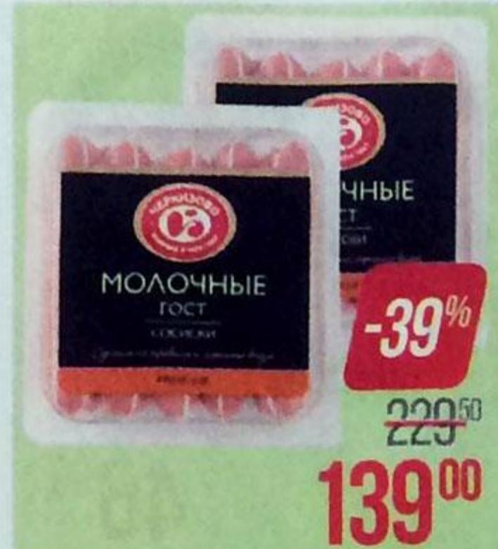
Сосиски МОЛОЧНЫЕ , ГОСТ (ЧМПЗ), 500 г