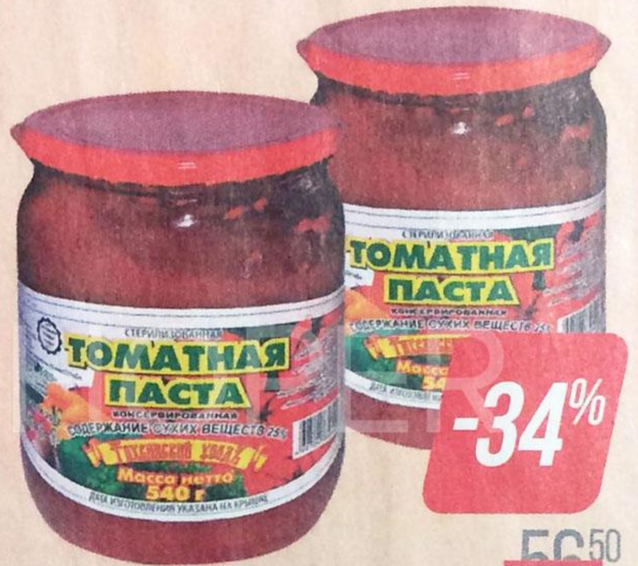
Паста томатная ТИХВИНСКИЙ УЕЗДЪ , 540 г