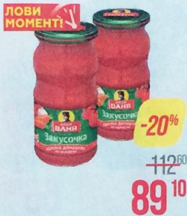
Закусочка ДЯДЯ ВАНЯ , Аджика по-аджарски, 460 г