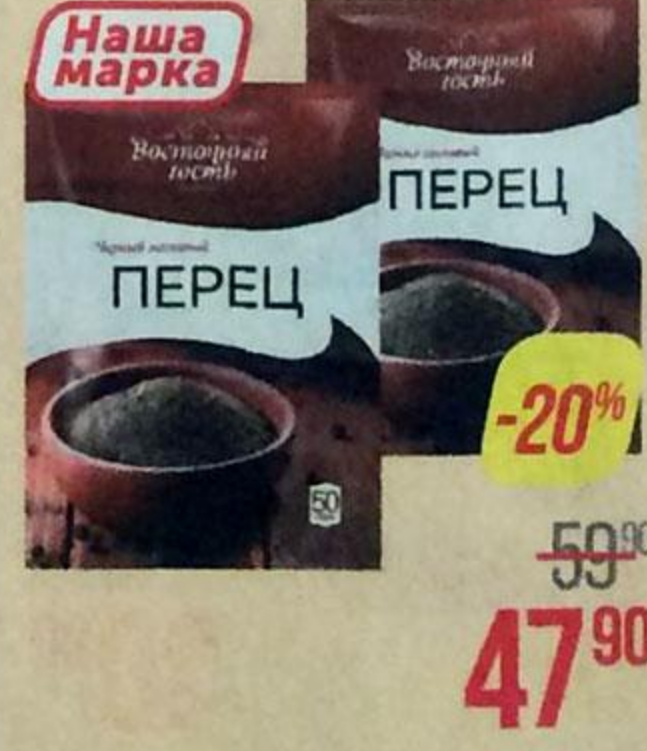
Перец черный ВОСТОЧНЫЙ ГОСТЬ , молотый, 50 г