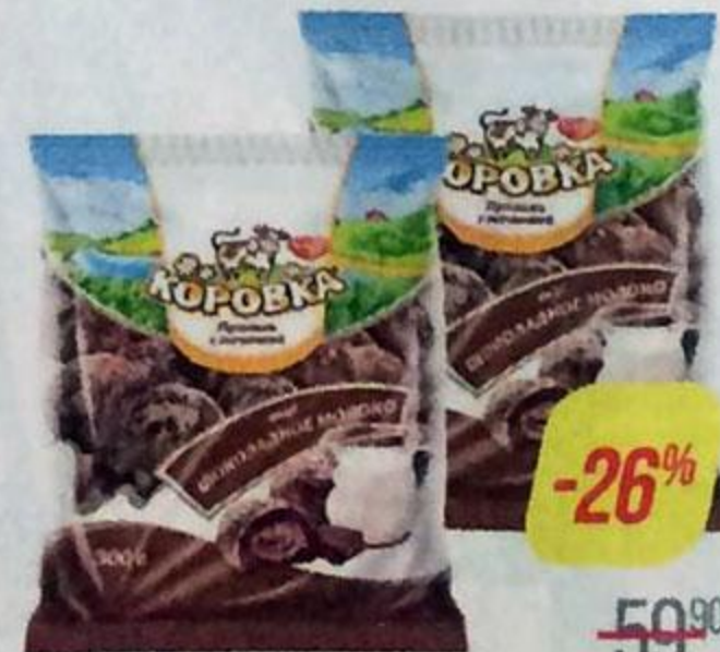
Пряники КОРОВКА , Шоколадное молоко, 300 г