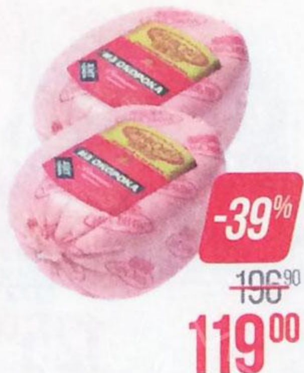
Ветчина МИКОЯН , Из окорока, мини, 600 г