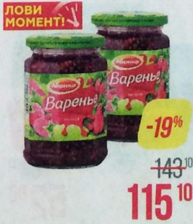
Варенье АБРИКО , малиновое, 390 г