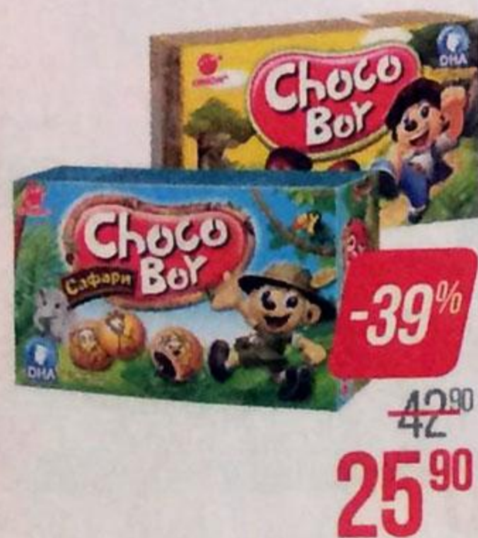
Печенье ЧОКО БОЙ , Грибочки, 45 г/Сафари, 42 г

© FIFA/ФИФА, логотипы официальной лицензионной продукции FIFA, а также эмблемы, талисманы, плакаты и кубки Чемпионата мира по футболу FIFA™ являются объектами авторского права и/или товарными знаками FIFA.