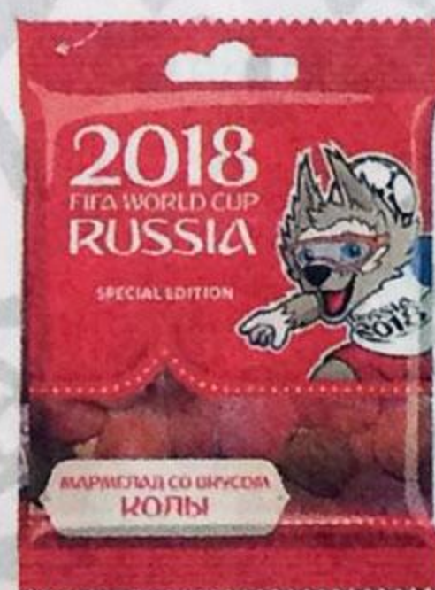
МАРМЕЛАД , Кола, 65 г