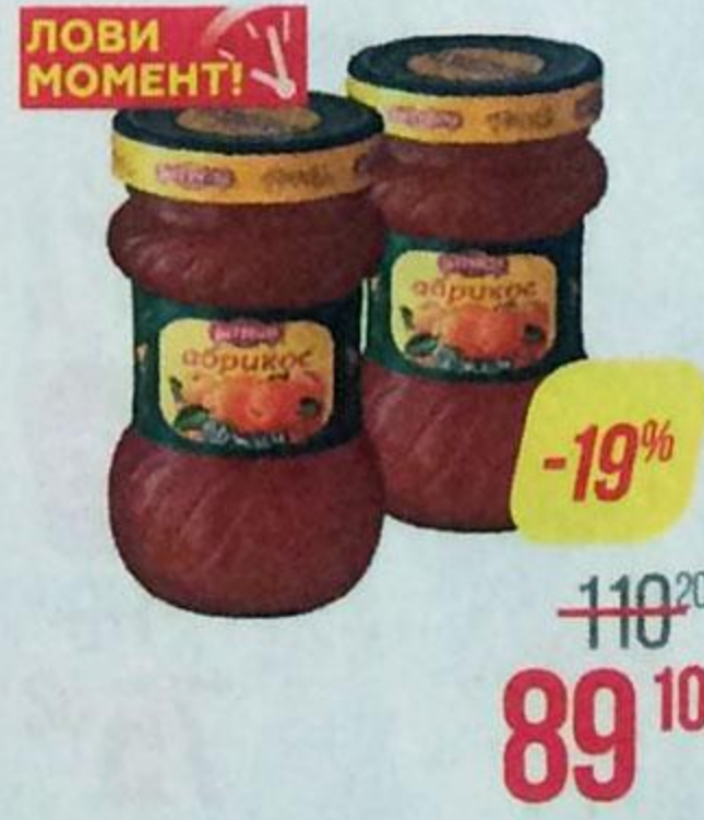
Джем РАТИБОР , Абрикос, 360 г