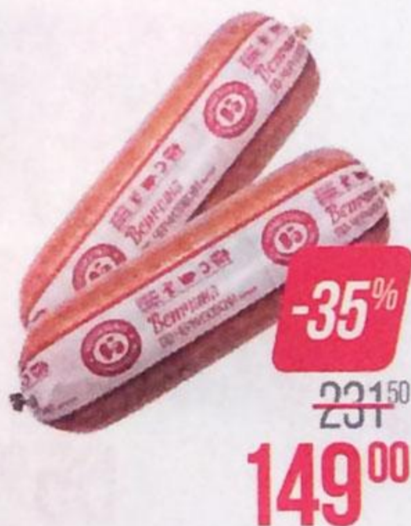
Ветчина ПО-ЧЕРКИЗОВСКИ (ЧМПЗ), 500 г