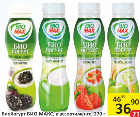
Бийогурт БИО МАКС, в ассортименте, 270 г

ИМЕЮТСЯ ВОЗРАСТНЫЕ ОГРАНИЧЕНИЯ. НЕОБХОДИМА КОНСУЛЬТАЦИЯ СПЕЦИАЛИСТА.