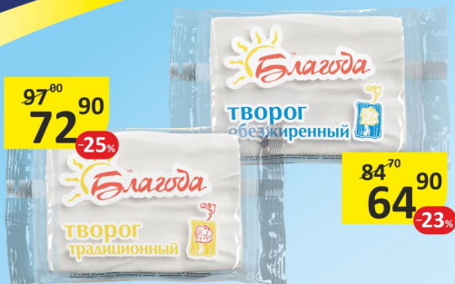
Творог БЛАГОДА, традиционный, обезжиренный, 180 г