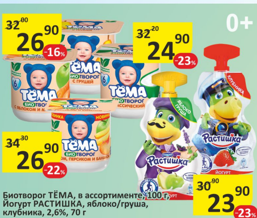
Биотворог ТЁМА, в ассортименте, 100 г, урт Йогурт РАСТИШКА, яблоко/груша, клубника, 2,6%, 70 г

ИМЕЮТСЯ ВОЗРАСТНЫЕ ОГРАНИЧЕНИЯ. НЕОБХОДИМА КОНСУЛЬТАЦИЯ СПЕЦИАЛИСТА.