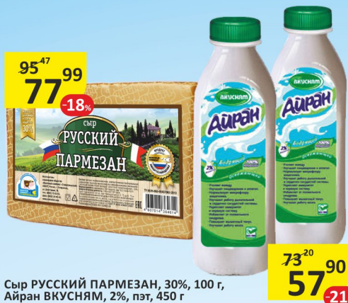
Сыр РУССКИЙ ПАРМЕЗАН, 30%, 100 г, Айран ВКУСНЯМ, 2%, пэт, 450 г