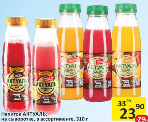
Напиток АКТУАЛЬ, на сыворотке, в ассортименте, 310 г