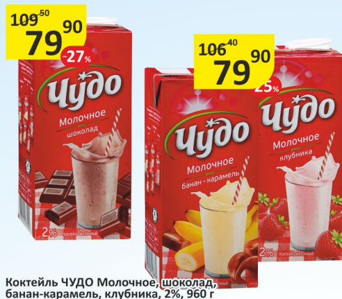
Коктейль ЧУДО Молочное, шоколад, банан-карамель, клубника, 2%, 960 г