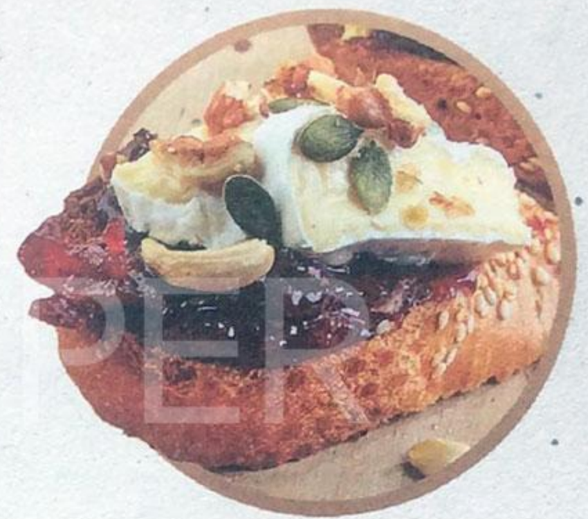
Брускетта ... с пикантным сыром и вареньем ...