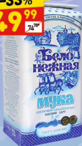
МУКА ПШЕНИЧНАЯ «БЕЛО-НЕЖНАЯ» 2 кг