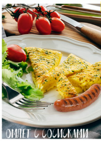
ОМЛЕТ С СОСИСКАМИ

СОСИСКИ «ГРИЛЬ-МАСТЕР» «ПАПА МОЖЕТ» «Останкино», п/о, 940 г