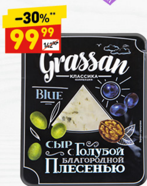
СЫР GRASSAN с благородной голубой плесенью, 50%, 100 г