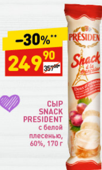
СЫР SNACK PRESIDENT с белой плесенью, 60%, 170 г