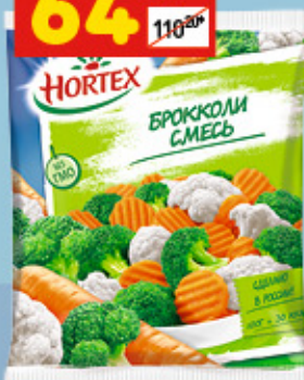
СМЕСЬ БРОККОЛИ Hortex, 400 г