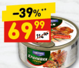
КРЫЛЫШКИ КУРИНЫЕ в асс.: гриль, в соусе барбекю, 300 г

Наши салаты мы готовим с любовью из натуральных ингредиентов и заправляем майонезом нашего собственного производства. Традиционный оливье с вареной колбаской, сельдь под шубой с нежными овощами на пару и салат из крабовых палочек со сладкой кукурузой и хрустящими свежими огурчиками — вкусный ужин для всей семьи уже готов!