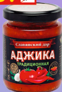
АДЖИКА «ТРАДИЦИОННАЯ» «Славянский дар», с/б, 170 г