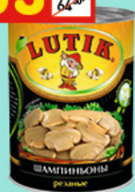
ШАМПИЊОНЫ РЕЗАННЫЕ Lutik, ж/б, 425 мл