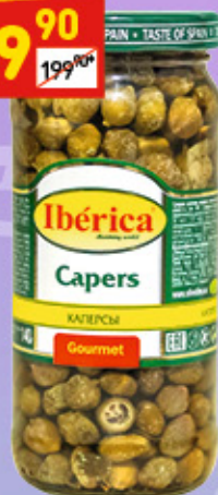
КАПЕРСЫ Iberica, с/б, 250 г