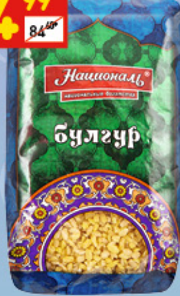
БУЛГУР «НАЦИОНАЛЬ» 450 г