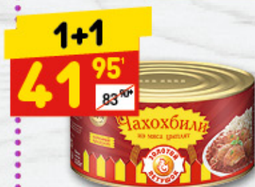
ЧАХОХБИЛИ ИЗ КУРИЦЫ «Золотой петушок», 325 г

1 цена за 1 шт. при покупке 2 шт. одновременно