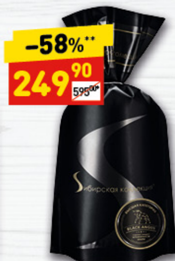
ПЕЛЬМЕНИ РУССКИЕ «Сибирская коллекция», 800 г