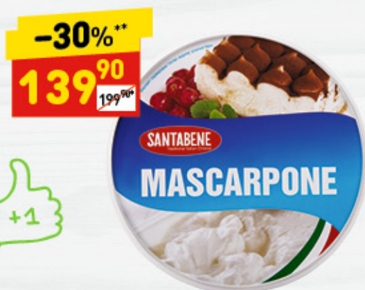
МАСКАРПОНЕ SANTABENE 80%, 250 г