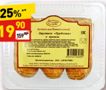
ПИРОЖНОЕ ТРУБОЧКА С КРЕМОМ «Престиж», 300 г