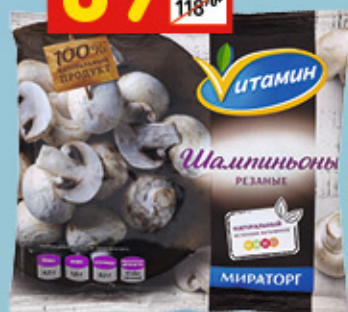
ШАМПИньОНЫ «Витамин», зам., 400 г