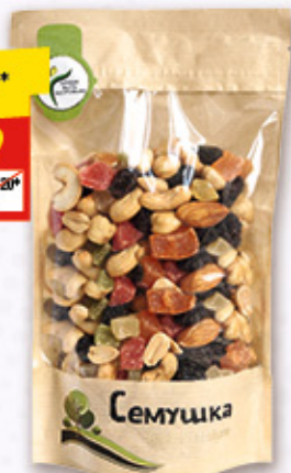
СМЕСЬ СЛАДКАЯ «СЕМУШКА» орехи-цукаты, 150 г