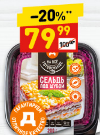
САЛАТ «СЕЛЬДЬ ПОД ШУБОЙ»