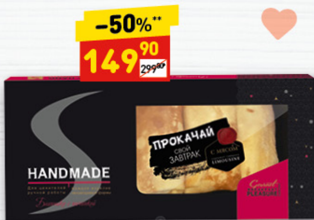
БЛИНЧИКИ С МЯСОМ «Сибирская коллекция», 400 г