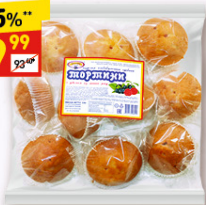
КЕКСЫ «ТОРТИНИ» с джемом из лесных ягод, 330 г