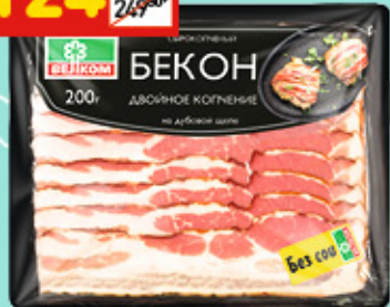
БЕКОН ДВОЙНОЕ КОПЧЕНИЕ «Велком», с/к, в/у, нар., 200 г