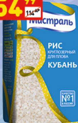
РИС «КУБАНЬ» «Мистраль», круглозерный для плова, 900 г