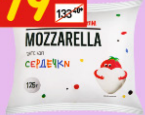
МОЦАРЕЛЛА UNAGRANDE PER BAMBINI, 50%, 125 г