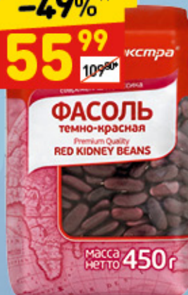
ФАСОЛЬ ТЕМНО-КРАСНАЯ «Агро-Альянс», 450 г