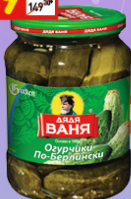
ОГУРЦЫ «ДЯДЯ ВАНЯ» маринованные «По-берлински», с/б, 680 г