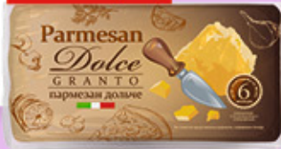
ПАРМЕЗАН DOLCE 40%, 200 г