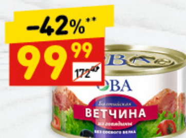
ВЕТЧИНА «БАЛТИЙСКАЯ» из говядины, 325 г

1 цена за 1 шт. при покупке 2 шт. одновременно