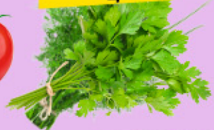
ЗЕЛЕНЬ АССОРТИ упак., 70 г