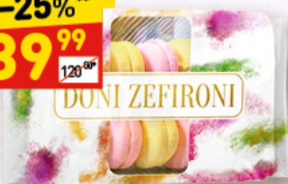
ЗЕФИР DONI ZEFIRONI 420 г