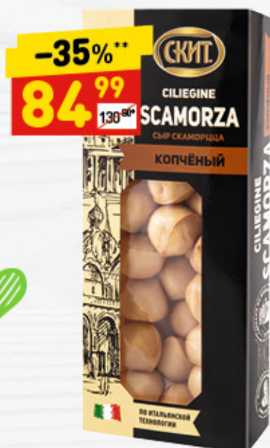
СЫР SCAMORZA CILIEGINE «СКИТ», 40%, 150 г