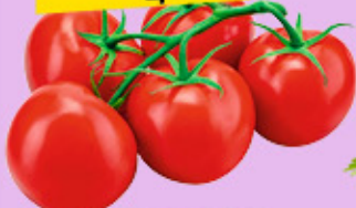
ТОМАТЫ РОЗОВЫЕ фас., 600 г