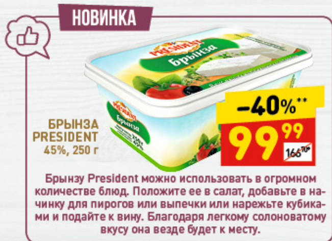
БРЫНЗА PRESIDENT 45%, 250 г

Брынзу President можно использовать в огромном количестве блюд. Положите ее в салат, добавьте в начинку для пирогов или выпечки или нарежьте кубиками и подайте к вину. Благодаря легкому солоноватому вкусу она везде будет к месту.