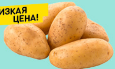
КАРТОФЕЛЬ МЫТЫЙ упак., вес.