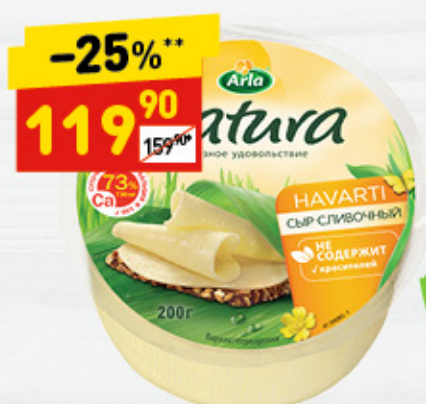
СЫР NATURA ARLA сливочный, 45%, 200 г