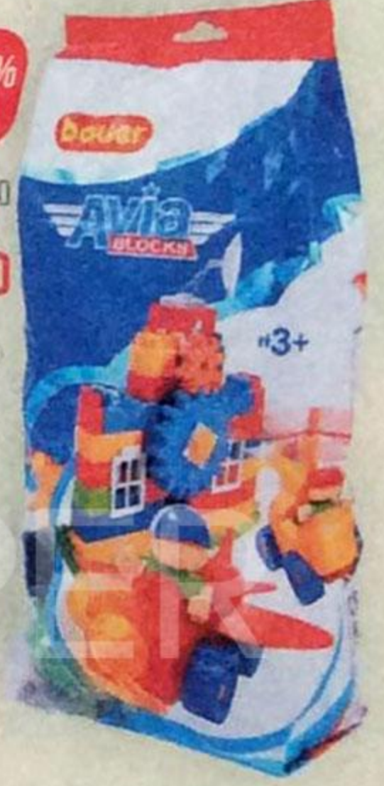
Конструктор BAUER АВИА , 90 элементов