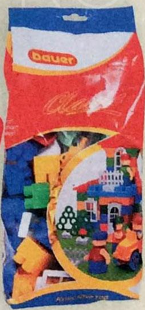
Конструктор BAUER КЛАССИК , 90 элементов