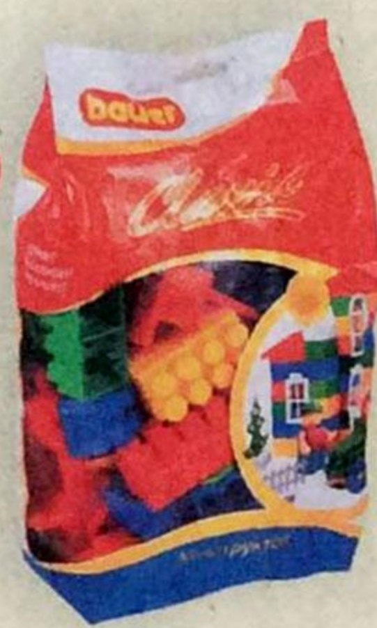
Конструктор BAUER КЛАССИК , 60 элементов