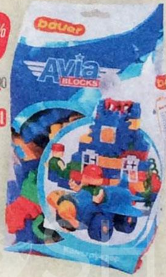
Конструктор BAUER АВИА , 60 элементов