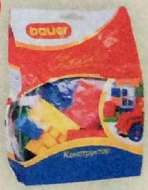
Конструктор BAUER КЛАССИК , 30 элементов