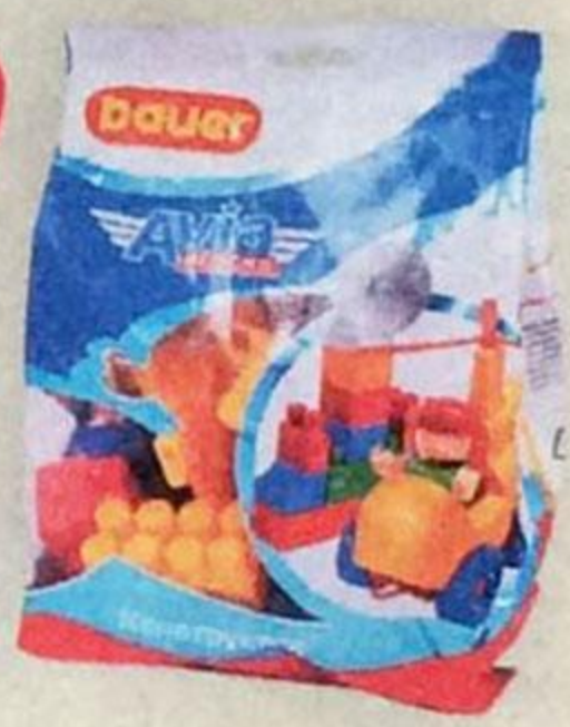
Конструктор BAUER АВИА , 30 элементов