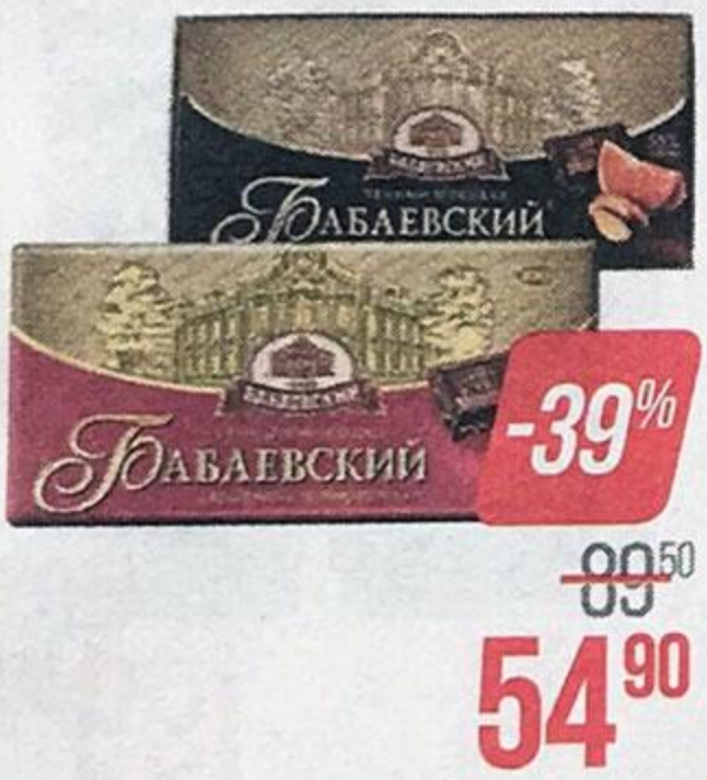
Шоколад БАБАЕВСКИЙ , Апельсин-миндаль/Темный, с фундуком/Грейпфрут/Фирменный/С миндалем/Элитный/Горький, 100 г