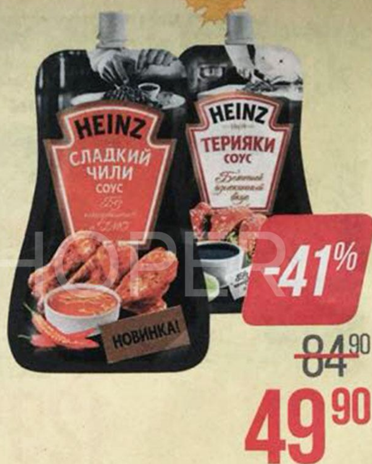
Соус ХАЙНЦ , Терияки/ Сладкий чили, 230 г