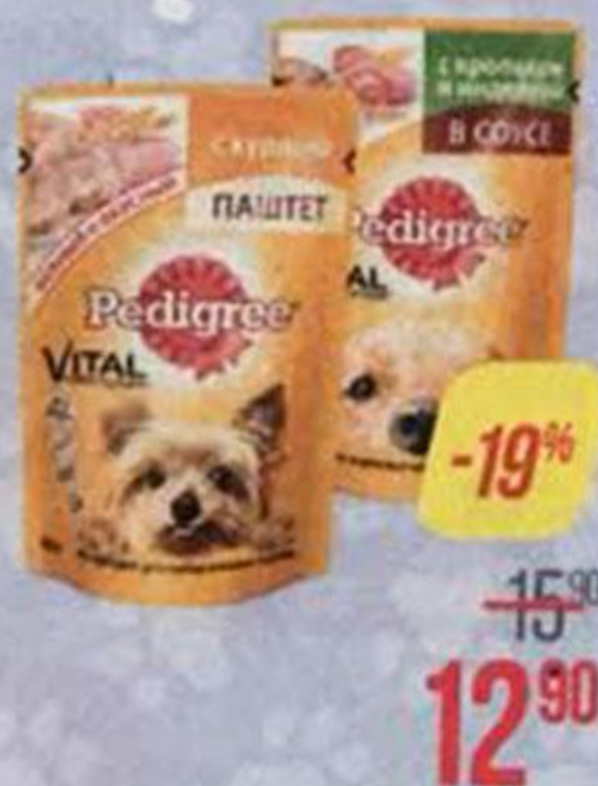
Корм для собак ПЕДИГРИ , Для маленьких пород: Паштет с курицей/ Говядина, 80 г; Для щенков: Говядина, 85 г; Для взрослых собак: Говядина-ягненок/ Кролик-индейка/ Говядина, 100 г