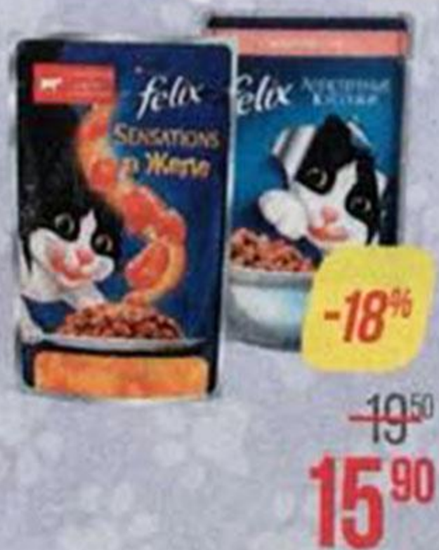
Корм для кошек ФЕЛИКС , В ассортименте***, 85 г