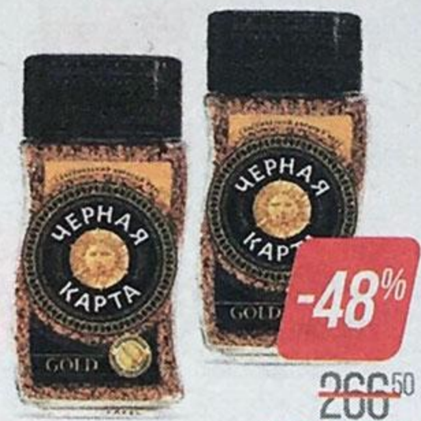
Кофе ЧЕРНАЯ КАРТА , Голд, сублимированный, 150 г