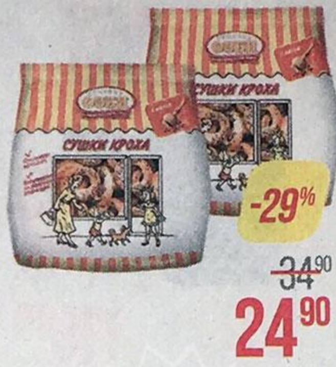
Сушки СЕМЕЙКА ОЗБИ , Кроха, с маком, 200 г