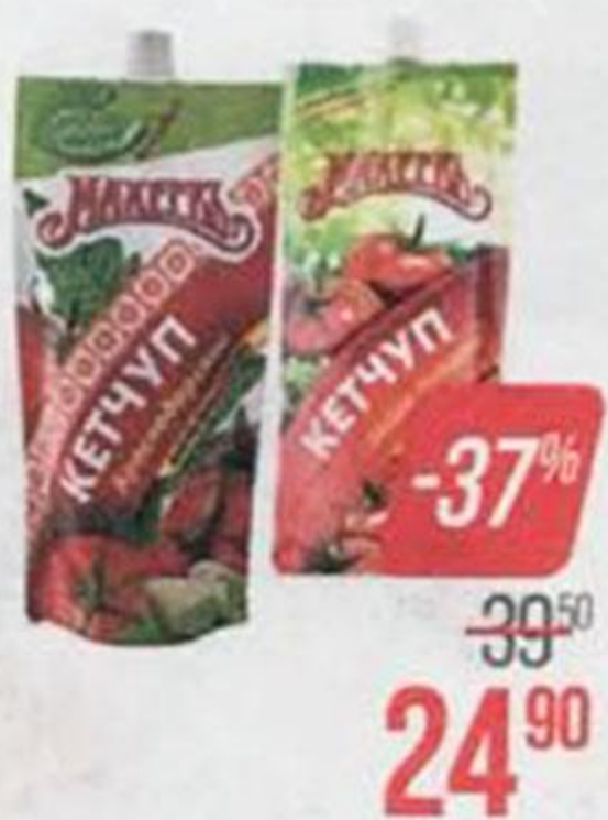
Кетчуп МАХЕЕВЪ , Шашлычный/Краснодарский, 260 г