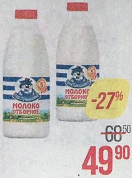
Молоко ПРОСТОКВАШИНО , Отборное пастеризованное, 3,4-4,5%, 930 мл