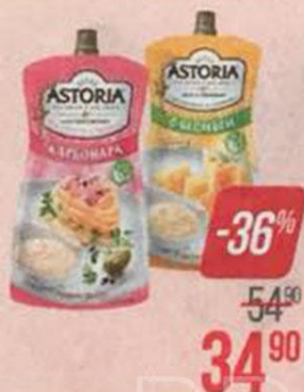
Соус майонезный АСТОРИЯ , Карбонара, 200 г/ Лук со сметаной/ Сырный/ Сметанный с грибами/ Сливочно-чесночный, 233 г