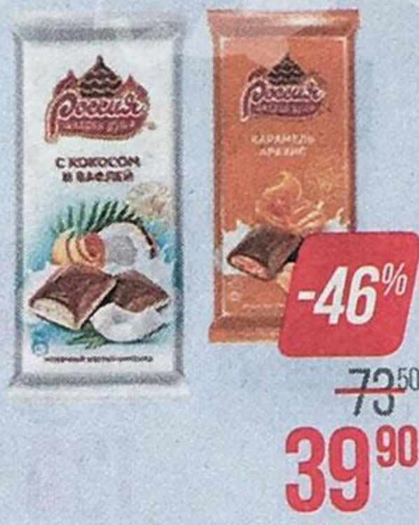
Шоколад молочный РОССИЯ , Миндаль и вафля/Карамель и арахис/Фундук и изюм/С кокосом и вафель/Очень молочный, 90 г