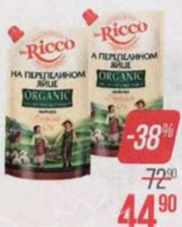
Майонез МИСТЕР РИККО , Органик на перепелином яйце, 67%, 400 мл