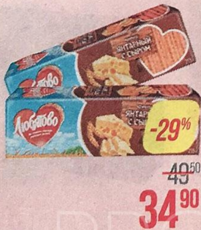
Крекер ЛЮБЯТОВО , Янтарный, с сыром, 235 г