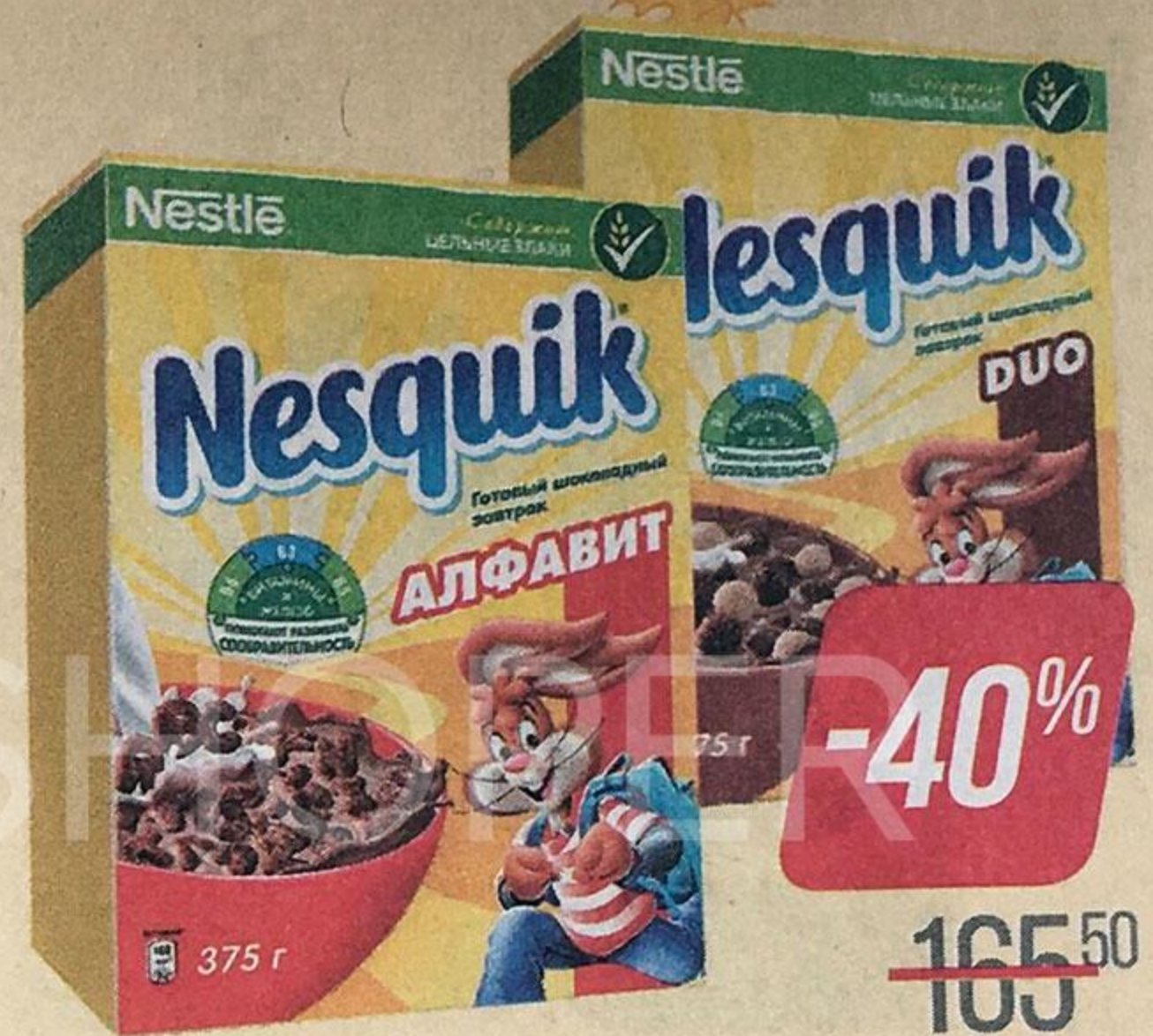
Готовый завтрак НЕСКВИК , Дуо/Алфавит, 375 г