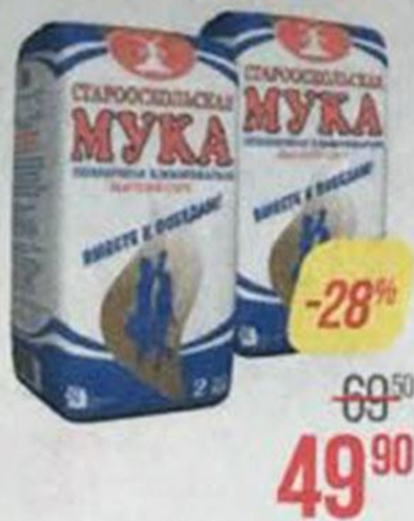
Мука пшеничная СТАРООСКОЛЬСКАЯ , Хлебопекарная, высший сорт, 2 кг