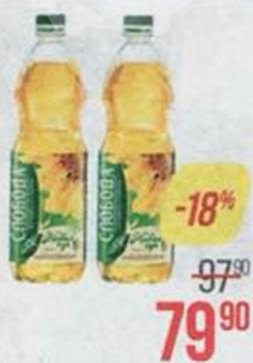
Масло подсолнечное СЛОБОДА , рафинированное, 1 л