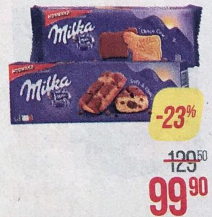
МИЛКА , Печенье Чоко Му, 200 г/Пирожное Софт&Чок, 175 г