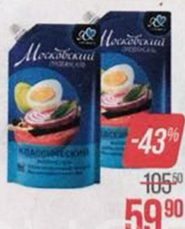
Майонез МОСКОВСКИЙ , Провансаль, классический, 67%, 720 г