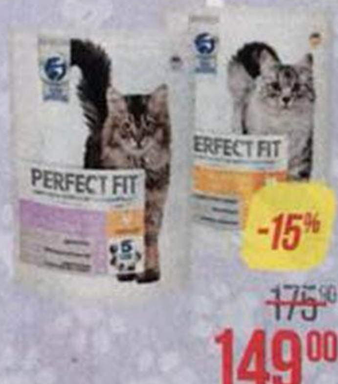
Сухой корм ПЕРФЕКТ ФИТ , Для котят, с курицей/ Для стерилизованных кошек с курицей/ Для кошек с чувствительным пищеварением, с индейкой/ Для домашних кошек, с курицей, 550 г