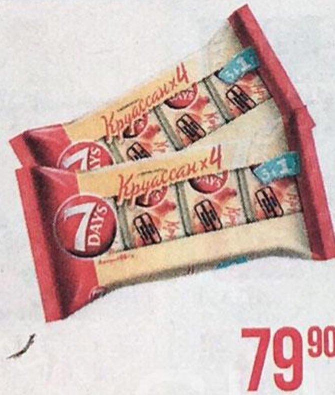
Круассаны СЕВЕН ДЭЙЗ , Какао, 4 шт. x 65 г