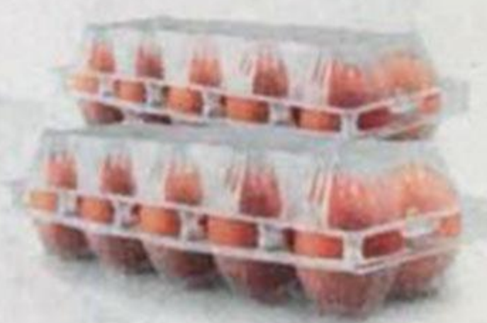
ЯЙЦО СТОЛОВОЕ , 1-й сорт (МД Россия), 10 шт.