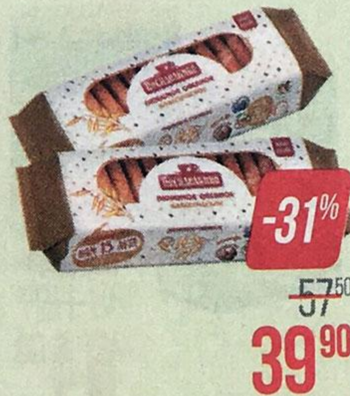
Печенье ПОСИДЕЛКИНО , овсяное классическое, 320 г