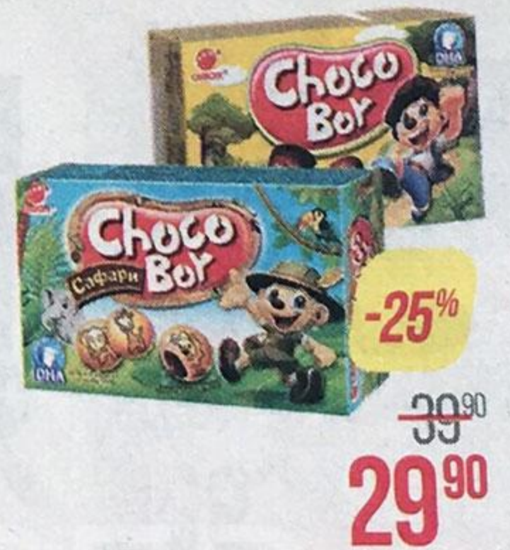
Печенье ЧОКО БОЙ , Грибочки, 45 г/Сафари, 42 г