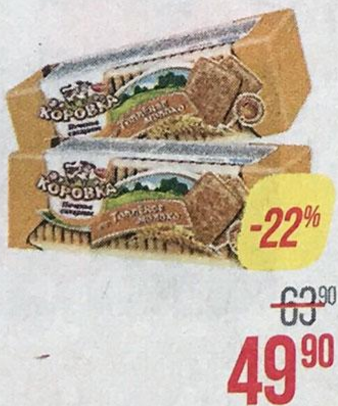
Печенье КОРОВКА , Топленое молоко, 375 г