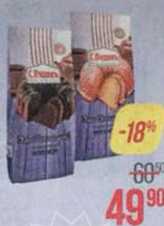
Смесь мучная С.ПУДОВЪ , Кекс: Ваниль/Шоколад, 400 г