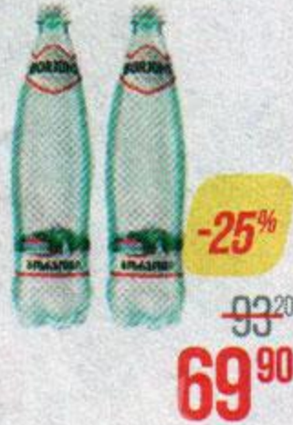
Вода минеральная БОРЖОМИ, 750 мл