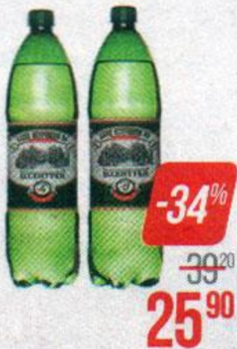
Вода минеральная ЭССЕНТУКИ, № 4/ №17, 1,5 л