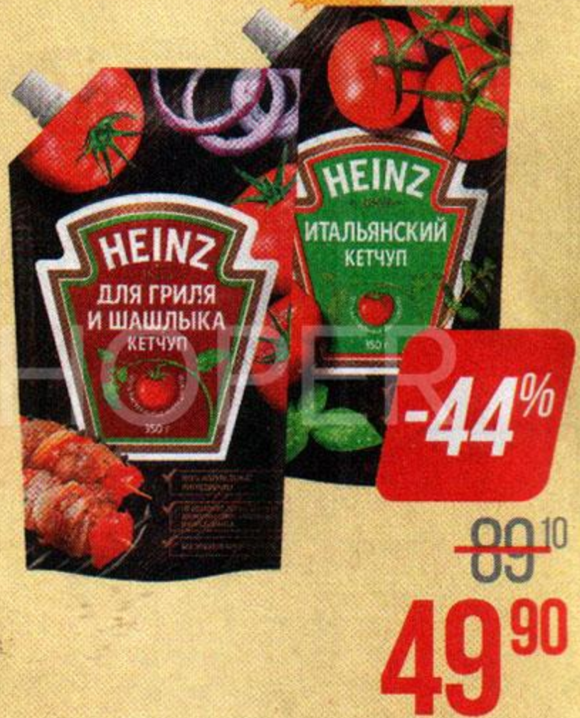
Кетчуп ХАЙНЦ , Итальянский/ Для гриля и шашлыка/ С чесноком и пряностями, 350 г