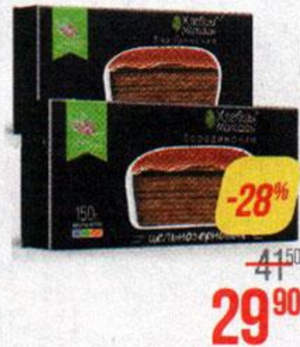
ХЛЕБЦЫ МОЛОДЦЫ , Хрустящие бородинские, 150 г