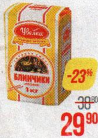
Мука УВЕЛКА , блинная Блинчики Русские 1 кг