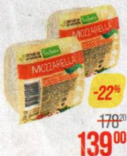
Сыр моцарелла БОНФЕСТО , Пицца, 45%, 250 г