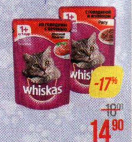
Корм для кошек ВИСКАС , В ассортименте***, 85 г