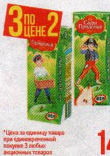
*Цена за единицу товара при одновременной покупке 3 любых акционных товаров