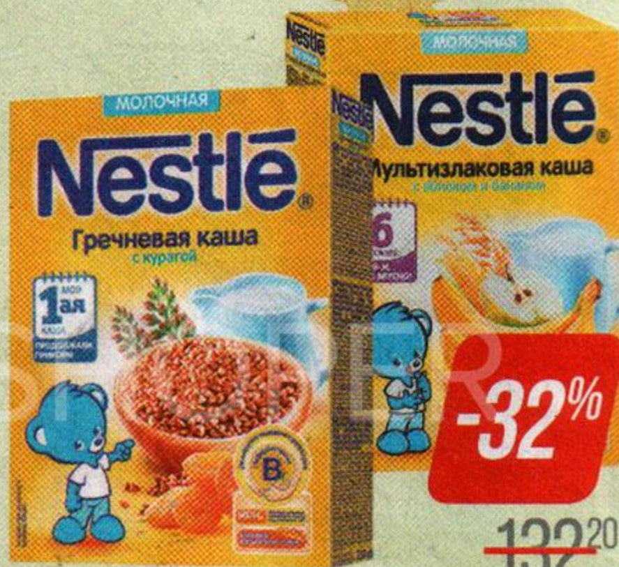
Каша молочная** НЕСТЛЕ, Мультизлаковая, яблоко-банан/ Овсяная, груша-банан/ Пшеничная, земляника-яблоко/ Пшеничная, тыква/ Гречневая, с курагой, 220 г