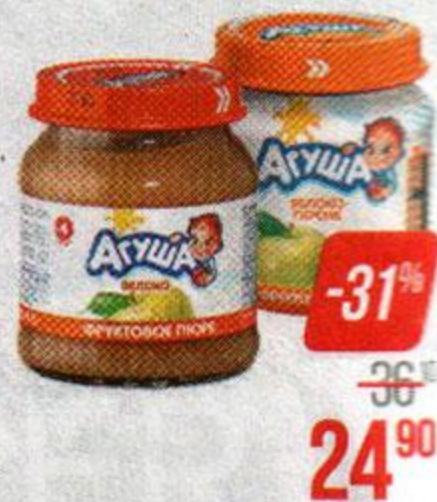
Пюре** АГУША, Яблоко/ Яблоко-банан/ Груша-яблоко/ Груша/ Яблоко-Персик, 115 г