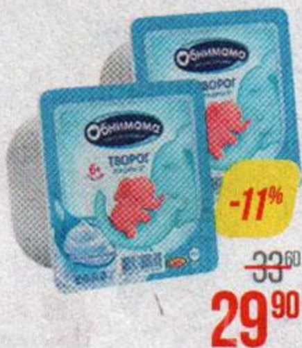
Творог** ОБНИМАМА, 5%, 100 г