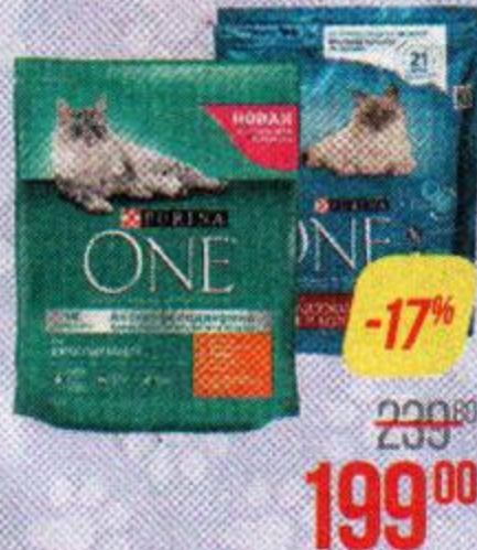
Корм сухой для кошек ПУРИНА ВАН , Для стерилизованных, Говядина-пшеница/ Для взрослых, Курица-цельные злаки, 750 г