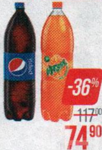
Напиток газированный МИРИНДА/ ПЕПСИ/ 7-АП, 2,25 л