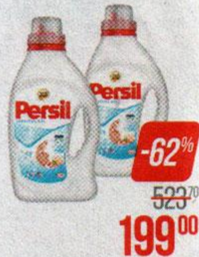
Гель для стирки PERSIL®, Сенситив, 1,46 л