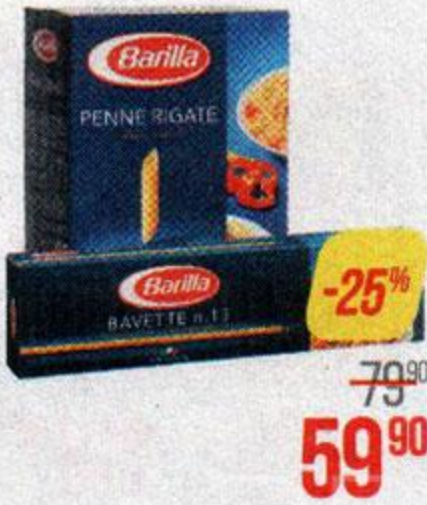
Макаронные изделия БАРИЛЛА , Пенне ригате/ Спагетти/ Пиле ригате/ Баветте, 500 г