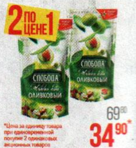
Майонез СЛОБОДА , Оливковый 67%, 375 г