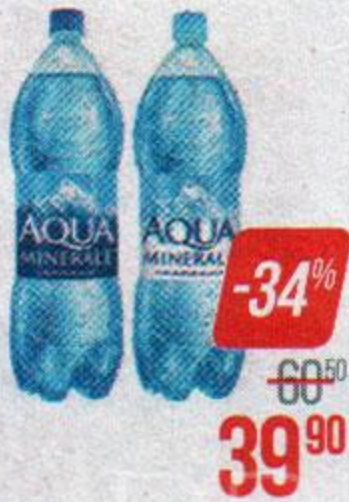
Вода питьевая АКВА МИНЕРАЛЕ, Негазированная/ Газированная, 2 л