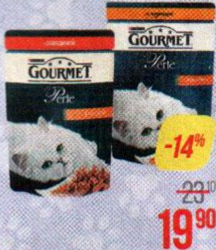
Корм для кошек ГУРМЭ , Перл, В подливе: С говядиной/ Суткой/ С лососем/ С курицей, 85 г