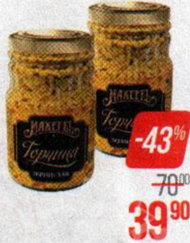
Горчица зернистая МАХЕЕВЪ , 190 г