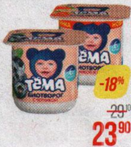
Биотворог** ТЕМА, Черника/ Банан/ Яблоко-персик-банан/ Груша/ Яблоко-морковь/ Классический/ Клубника-банан, 100 г