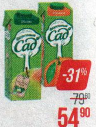
Соки и нектары ФРУКТОВЫЙ САД, Яблочный, осветленный/ Мультифруктовый, с мякотью/ Персик-яблоко, с мякотью/ Апельсин, с мякотью/ Томатный, с мякотью, 950 мл