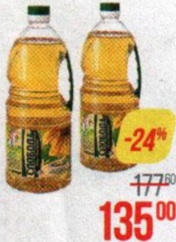
Масло подсолнечное СЛОБОДА , рафинированное, дезодорированное, 1,8 л