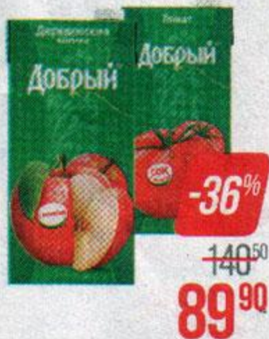
Соки и нектары ДОБРЫЙ, Персик-яблоко/ Деревенские яблочки/ Апельсиновый/ Мультифруктовый/ Томатный/ Яблочный, 2 л