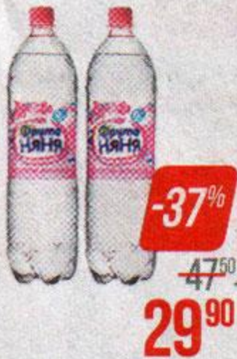
Вода детская** ФРУТОНЯНЯ, высшей категории (с рождения), 1,5 л