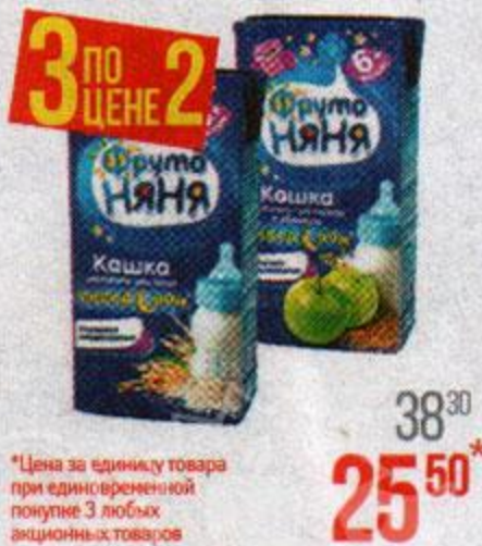
*Цена за единицу товара при одновременной покупке 3 любых акционных товаров Каша жидкая** ФРУТОНЯНЯ, Молочно-рисовая/ Молочно-пшеничная/ Молочно-мультизлаковая/ Молочно-гречневая с яблоком, 200 г