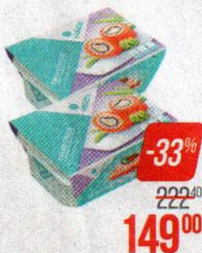
Сыр сливочный ВИОЛЕТТЕ , 60% (Карат), 400 г