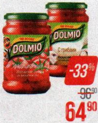
Соус ДОЛМИО , Традиционный томатный/ С грибами, 350 г