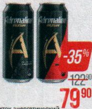
Напиток энергетический АДРЕНАЛИН, Игровая энергия, лайм-имбирь/ Джуси/ Раш, Ягодный/ Игровая энергия/ Раш, 500 мл