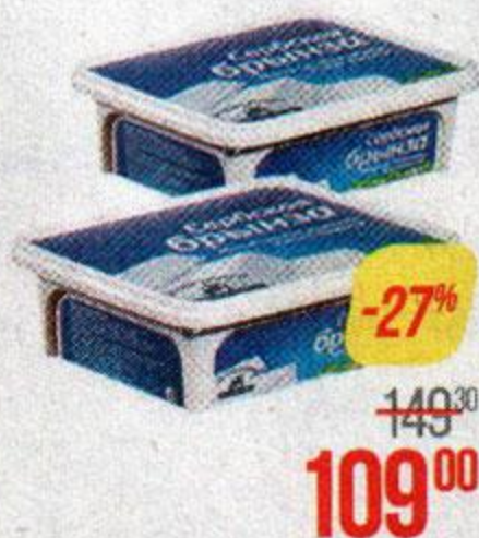
Сыр БРЫНЗА СЕРБСКАЯ , 45% (Фармаком), 250 г