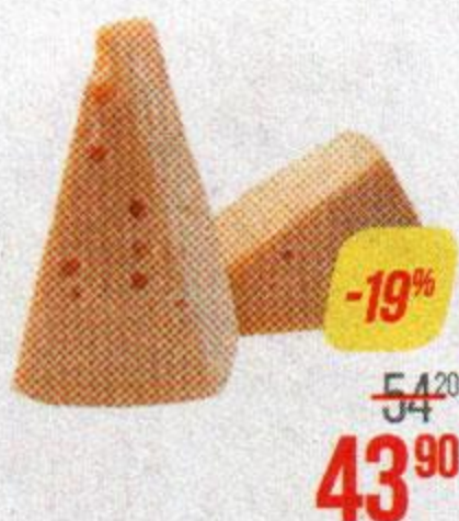
Сыр КАРЛОВ ДВОР , Маасдам, 45% (Ровеньки-МСЗ), 100 г