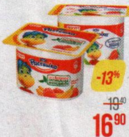
Йогурт РАСТИШКА, Клубника/ Малина-банан/ Яблоко-груша, 110 г