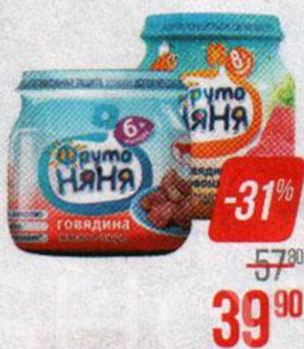
Пюре** ФРУТОНЯНЯ, Говядина/ Цыпленок, 80 г; Говядина-гречка-морковь/ Цыпленок-рис-овощи/ Говядина с овощами, 100 г