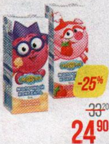
Коктейль молочный СМЕШАРИКИ, Ванильное мороженое/ Клубника, 200 г