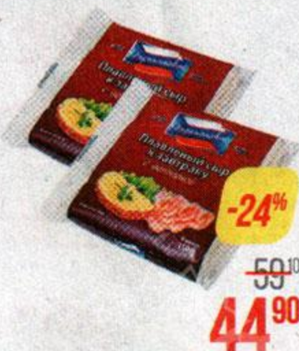
Сыр плавленный ПЕРЕЯСЛАВЛЬ , С ветчиной, 40% (РЗПС), 150 г