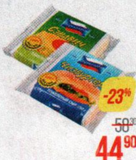
Сыр плавленный ПЕРЕЯСЛАВЛЬ , Чизбургер/ Сэндвич (Рязанский ЗПС), 150 г