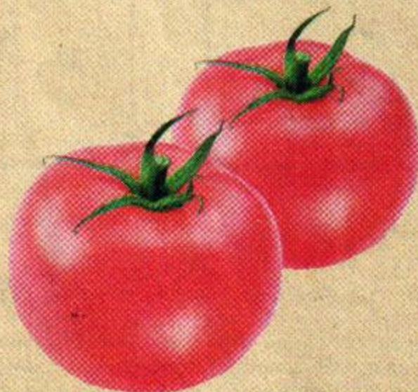
ТОМАТЫ, ЧЕРРИ, 1 уп. (250 г)