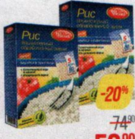
Рис УВЕЛКА, длиннозерный, классический, 800 г