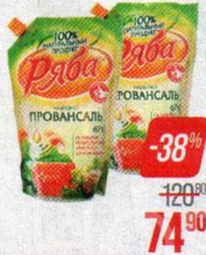
Майонез РЯБА , Провансаль, 67%, 744 г