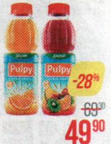
Напиток сокодержательный ДОБРЫЙ ПАЛПИ, Тропик/ Апельсин/ Манго-ананас, 450 мл