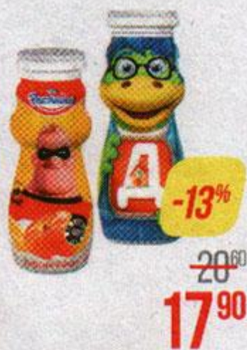
Йогурт питьевой РАСТИШКА, Земляника/ Персик-банан, 90 г