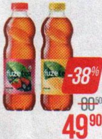
Чай холодный ФЬЮЗ ТИ, Черный: Лесные ягоды/ Лимон; Зеленый: Манго-ромашка 1 л