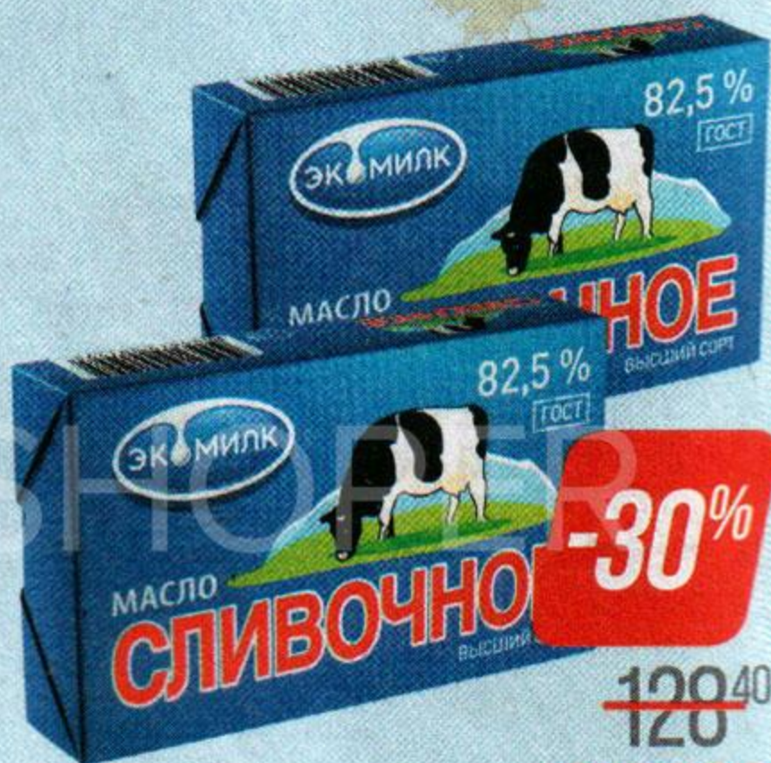
Масло сливочное ЭКОМИЛК , 82,5% (Озерецкий МК), 180 г