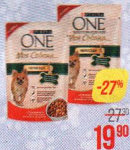
Корм для собак ПУРИНА ВАН , Говядина-картофель-морковь/ Курица-морковь-фасоль, 100 г