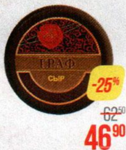
Сыр ГРАФ , 45% (Ровеньки-МСЗ), 100 г