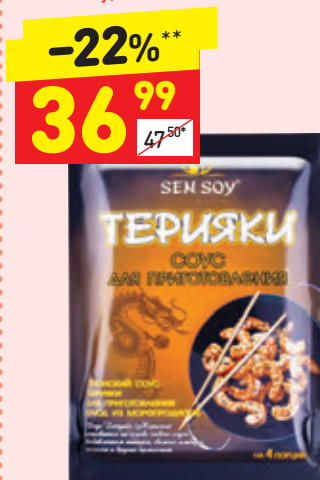
СОУС ТЕРИЯКИ PREMIUM SEN SOY Premium Sen Soy, п/пак, 120 г