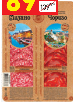
КОЛБАСЫ «ЧОРИЗО», «МИЛАНО» «Иней», с/к, нар., 100 г