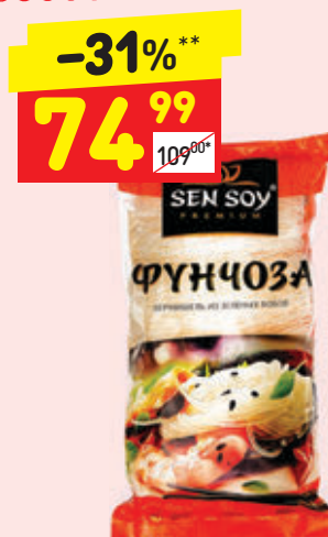
ВЕРМИШЕЛЬ ФУНЧОЗА Sen Soy Premium, 200 г