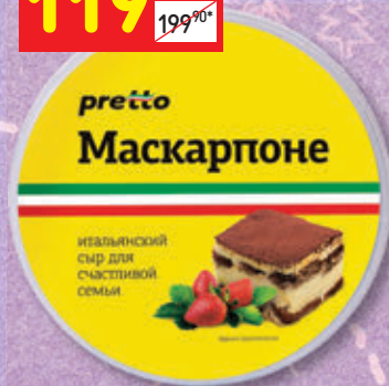
МАСКАРПОНЕ PRETTO 80%, 250 г