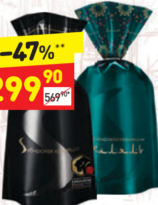
ПЕЛЬМЕНИ «Сибирская коллекция», в асс.: халяль, русские, 800 г