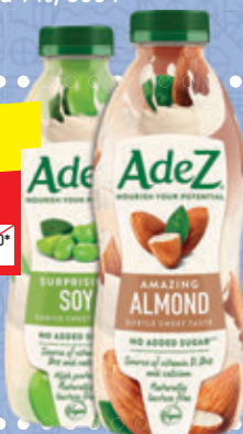
НАПИТОК ADEZ в асс.: соевый, миндальный, у-паст., п/6, 800 мл