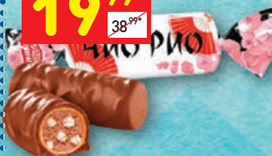
КОНФЕТЫ «ЧИО РИО» «Яшкино», вес., 100 г