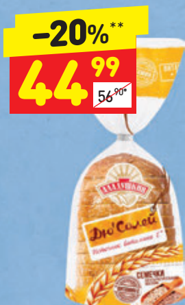
ХЛЕБ «ДЮ СОЛЕЙ» «Дарница», нар., 350 г