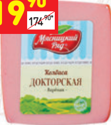
КОЛБАСА «ДОКТОРСКАЯ» «Мясницкий ряд», вар., 400 г