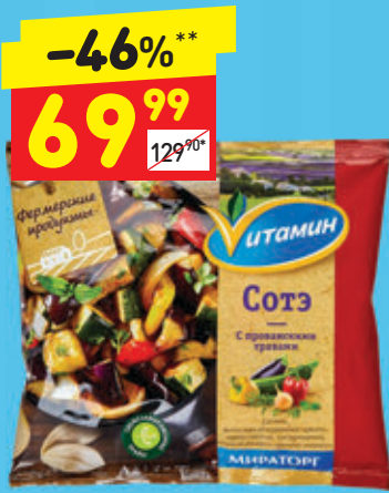
СОТЕ С ПРОВАНСКИМИ ТРАВАМИ «Витамин», зам., 400 г