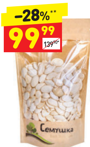
СЕМЕЧКИ ТЫКВЕННЫЕ «Семушка», 150 г