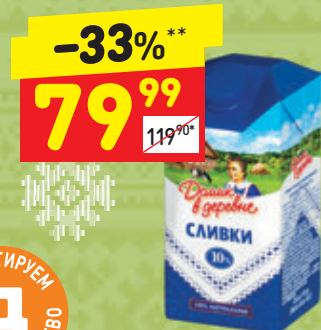
СЛИВКИ «ДМИК В ДЕРЕВНЁ» стер., 10%, 470/480 г