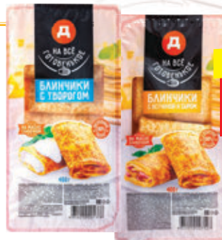
БЛИНЧИКИ «НА ВСЕ ГОТОВЕНКОЕ» в асс.: с творогом, с ветчиной и сыром, зам., 400 г