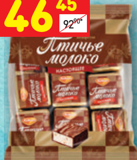
КОНФЕТЫ «ПТИЧЬЕ МОЛОКО» «Рот Фронт», сливочно-ваниль- ные, 225 г