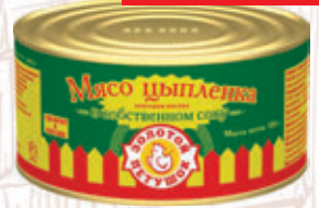
МЯСО ЦЫПЛЕНКА в с/соку «Золотой петушок», ж/б, 325 г