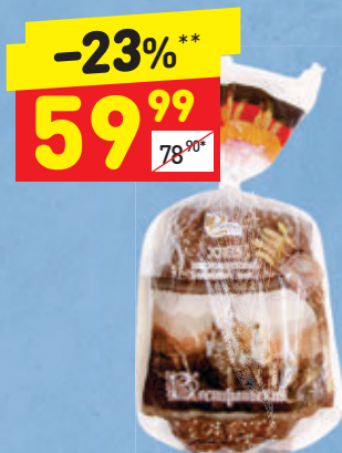
ХЛЕБ «ВЕСТФАЛЬСКИЙ» многозерновой, 350 г