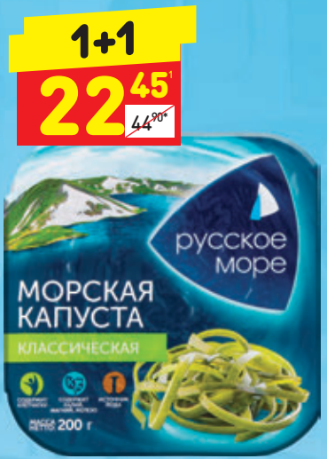
САЛАТ ИЗ МОРСКОЙ КАПУСТЫ «Русское море» классич., 200 г

1 цена за 1 шт. при покупке 2 шт. одновременно