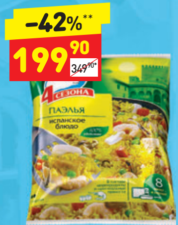
СМЕСЬ «ПАЭЛЬЯ ИСПАНСКАЯ» «4 сезона», зам., 600 г