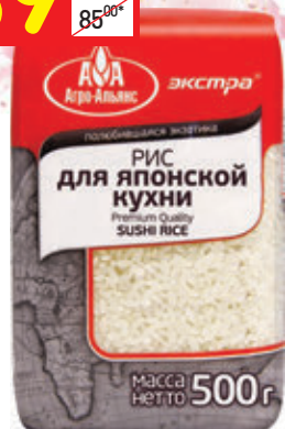
РИС ДЛЯ ЯПОНСКОЙ КУХНИ «Агро-Альянс», 500 г