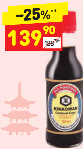
СОУС СОЕВЫЙ КИККОМАН с/б, 150 мл