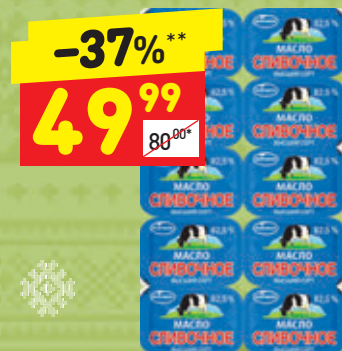
МАСЛО СЛИВОЧНОЕ порционное, «Экомилк», 82,5%, 10 x 10 г, 100 г