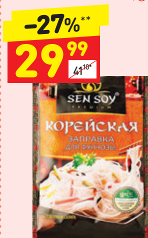
ЗАПРАВКА ДЛЯ ФУНЧОЗЫ ПО-КОРЕЙСКИ Sen Soy, 80 г