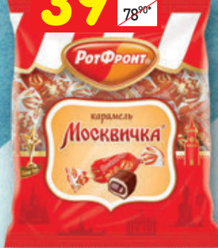
КАРАМЕЛЬ «МОСКВИЧКА» «Рот Фронт», 250 г