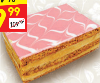
ПИРОЖНОЕ «ДЖИНДЖЕР» «Престиж», 300 г