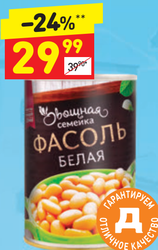
ФАСОЛЬ БЕЛАЯ «Овощная семейка», ж/б, 400 г