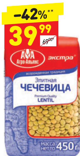
ЧЕЧЕВИЦА «Агро-Альянс», 450 г