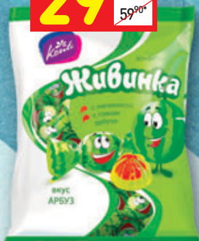
КОНФЕТЫ «ЖИВИНКА» вкус «арбуз», Konti, 250 г