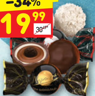
КОНФЕТЫ «МАРСИАНКА» АССОРТИ «Сладкий орешек», вес., 100 г