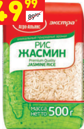
РИС «ЖАСМИН» «Агро-Альянс», 500 г