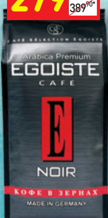
КОФЕ EGOISTE NOIR зерно, 250 г