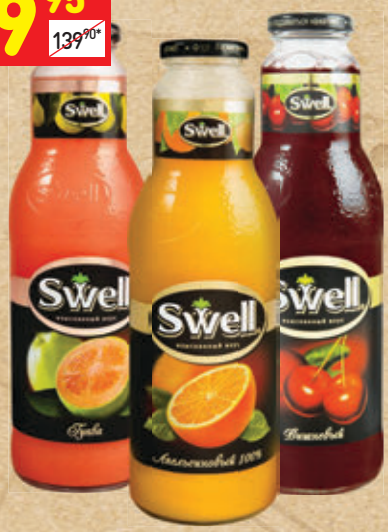
СОКИ И НЕКТАРЫ SWELL , в асс.: апельсин- новый, гуава, вишневый, с/б, 0,75 л