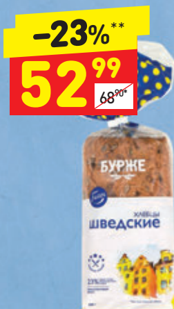
ХЛЕБЦЫ «ШВЕДСКИЕ», 280 г