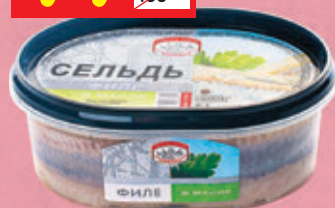
СЕЛЬДЬ В МАСЛЕ «Рыбная кухня», 500 г