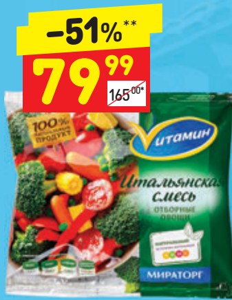
СМЕСЬ «ИТАЛЬЯНСКАЯ» «Витамин», зам., 400 г