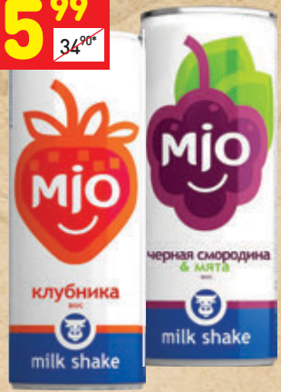
НАПИТОК MJO в асс.: черная смородина, клубника, б/а, ж/б, 0,33 мл