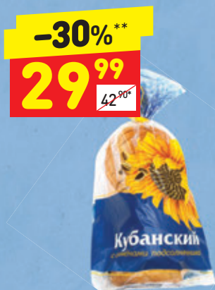
ХЛЕБ «КУБАНСКИЙ» нар., 350 г

Дания — страна рыбных деликатесов. Морепродуктов тут так много, что датчанам приходится постоянно выдумывать, какие же еще блюда можно из них приготовить. Видимо, однажды им это надоело — и они решили смешать все ингредиенты и намазать их на хлеб. Так и появился на свет большой, вкусный и красивый сморреброд. Еще вкуснее с зерновым хлебом!