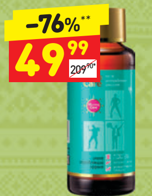
НАПИТОК ОТ ПОХМЕЛЯ MORNING CARE, б/а, 100 мл