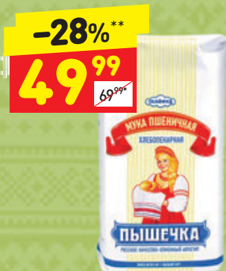
МУКА «ПЫШЕЧКА» пшеничная, в/с, 2 кг