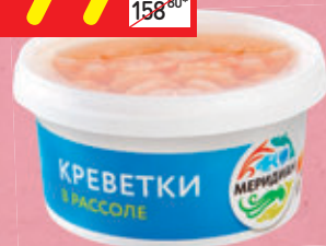
КРЕВЕТКИ В РАССОЛЕ «Меридиан», 180 г