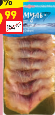
ФИЛЕ ОМУЛЯ В ЛОМТИКАХ Laplandia fish, с/с, в/у, 90 г