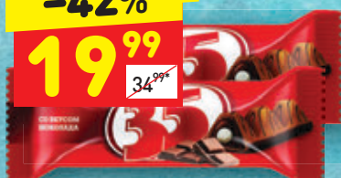
КОНФЕТЫ «35» со вкусом шоколада, вес., 100 г