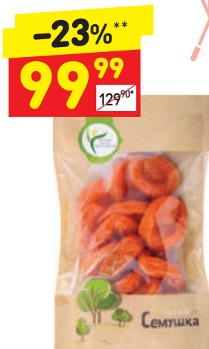
КУРАГА «Семушка», 150 г