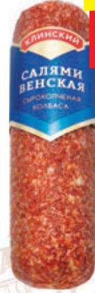
САЛЯМИ «ВЕНСКАЯ» «Клинский МК», с/к, в/у, 300 г