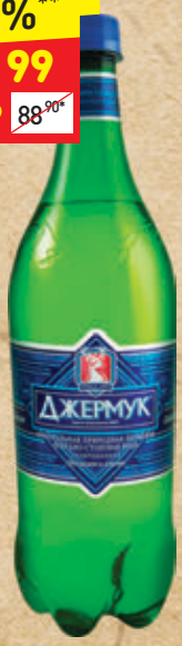
ВОДА МИНЕРАЛЬНАЯ «ДЖЕРМУК» газ., п/б, 1 л