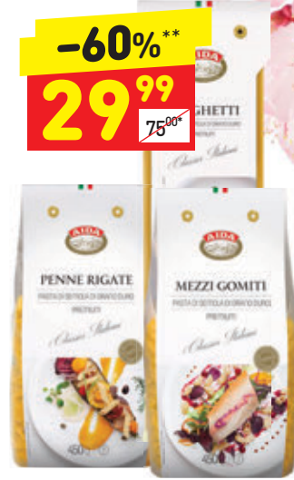
МАКАРОННЫЕ ИЗДЕЛИЯ АИДА в асс.: спагетти, 500 г, мези гимитти, пине ригате, 450 г