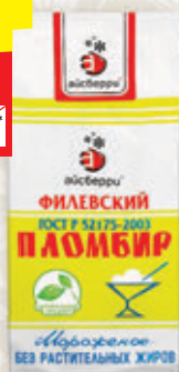
ПЛОМБИР «ФИЛЕВСКИЙ» в бумажном пакете, 450 г