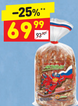
ХЛЕБ «АКТИПАН» в нарезке, 300 г