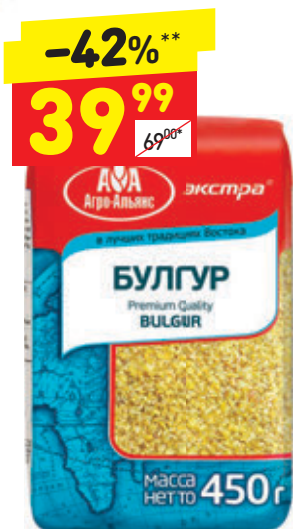
КРУПА БУЛГУР «Агро-Альянс», 450 г