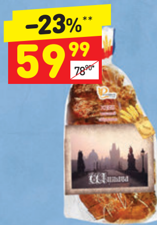
ХЛЕБ ЧЕШСКИЙ «ШУМАВА», 250 г