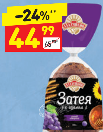
ХЛЕБ «ЗАТЕЯ» «Дарница», с изюмом, нар., 350 г