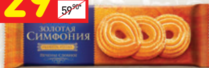
ПЕЧЕНЬЕ СДОБНОЕ «ЗОЛОТАЯ СИМФОНИЯ» «Кухмастер», 230 г

1 цена за 1 шт. при покупке 2 шт. одновременно