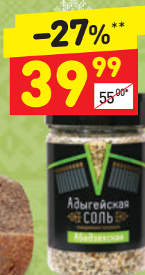
АДЫГЕЙСКАЯ СОЛЬ «Абдзехская», п/б, 300 г