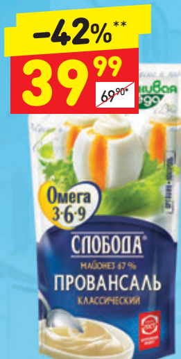
МАЙОНЕЗ ПРОВАНСАЛЬ Омега 3-6-9, «Слобода», 67%, д/пак, 400 мл