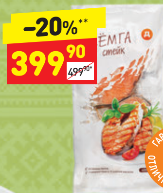
СТЕЙК СЕМГИ «Д» зам., 400 г