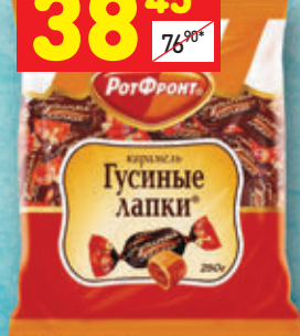
КАРАМЕЛЬ «ГУСИНЫЕ ЛАПКИ» «Красный Октябрь», 250 г