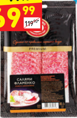
САЛЯМИ «ФЛАМЕНКО» «Черкизово», с/к, нар., 100 г