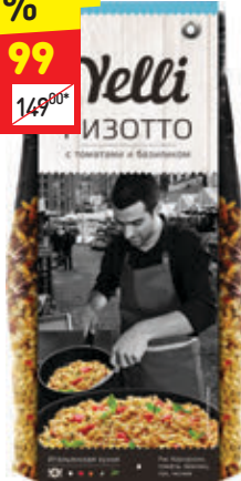
РИЗОТТО С ТОМАТАМИ И БАЗИЛИКОМ «Ярмарка», 250 г