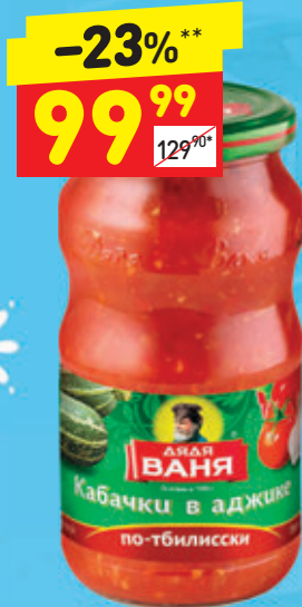
КАБАЧКИ В АДЖИКЕ «ПО-ТБИЛИСКИ» с/б, 460 г