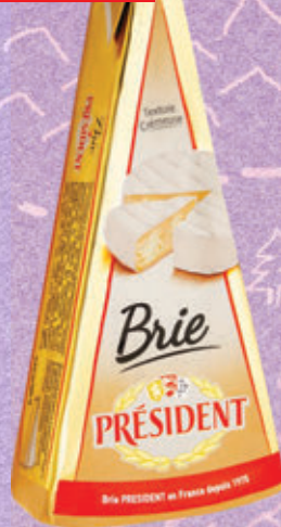
БРИ PRESIDENT 60%, 200 г