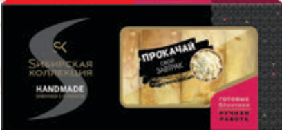
БЛИНЫ С ТВОРОГОМ «Сибирская коллекция», 400 г