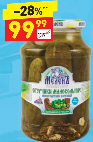
ОГУРЦЫ МАЛОСОЛЬНЫЕ БОЧКОВЫЕ «МЕЛЬНЬ» с/б, 900 г