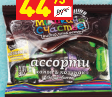
КОНФЕТЫ «МИШКИНО СЧАСТЬЕ» в асс.: халва, козинак, 200 г