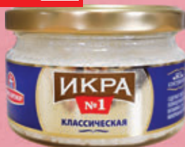
ИКРА МОЙВЫ ДЕЛИКАТЕСНАЯ «Санта Бремор», класс., с/б, 180 г