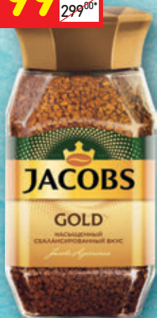
КОФЕ JACOBS GOLD раств., с/б, 95 г