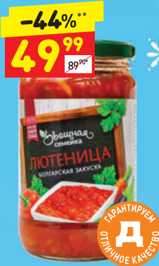
ЛЮТЕНИЦА «Овощная семейка», с/б, 340 г