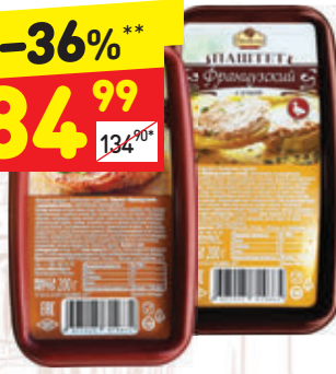
ПАШТЕТ ФРАНЦУЗСКИЙ «Рублевские колбасы», в асс.: с шампиньонами, с уткой, 200 г