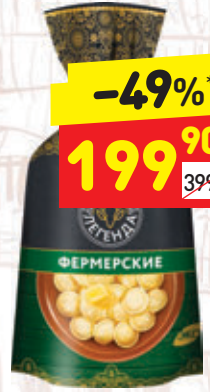
ПЕЛЬМЕНИ «ФЕРМЕРСКИЕ» «Легенда», 800 г

Мы готовим наши блинчики для того, чтобы у вас под рукой всегда был вкусный обед. Блинчики «Д» всегда отличная идея для вкусного перекуса.