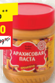
ПАСТА АРАХИСОВАЯ кремовая, 340 г