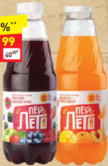
НАПИТОК СОК/С «ПЕЙ ЛЕТО» в асс.: фруктово-ягодный микс, мультифруктовый, 0,92 л