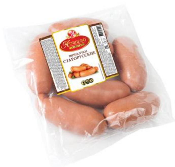
ШПИКАЧКИ "СТАРОРУССКИЕ" Атяшево, 1 кг