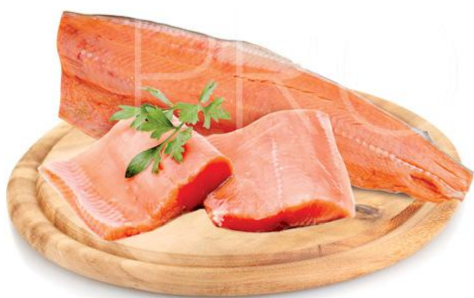
ФИЛЕ ГОРБУШИ свежемороженое Ладья, 1 кг