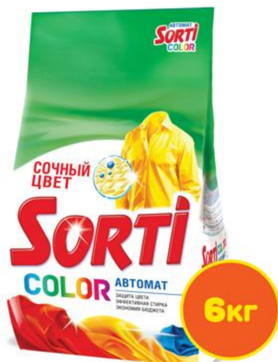
СТИРАЛЬНЫЙ ПОРОШОК SORTI COLOR*, автомат 6 кг *Колор