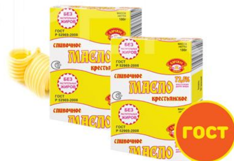
МАСЛО "КРЕСТЬЯНСКОЕ" 72.5% 180 г