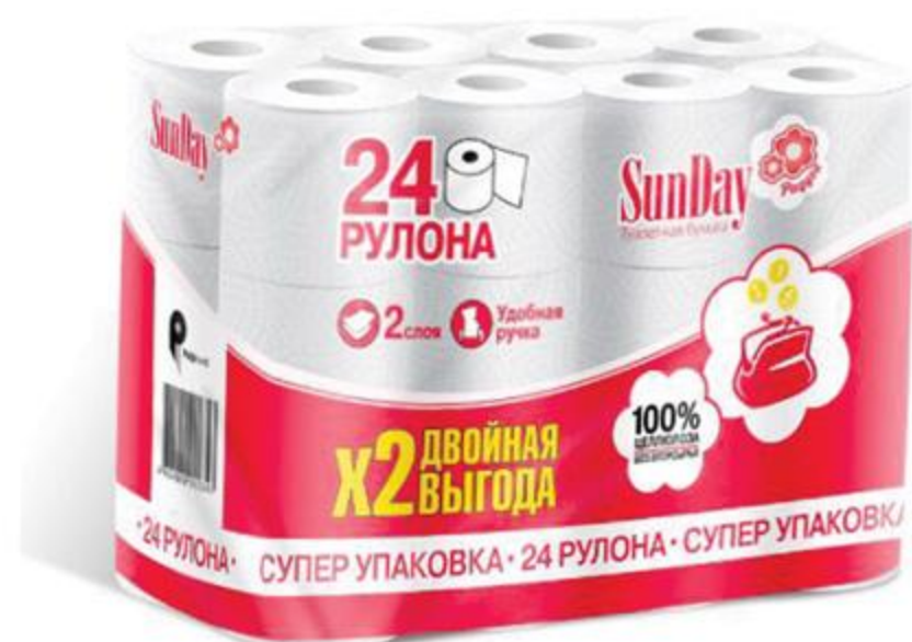
БУМАГА ТУАЛЕТНАЯ SUNDAY, 2 слоя 24 рулона, 1 уп.