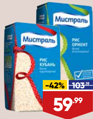
РИС МИСТРАЛЬ, 900 г, в ассортименте