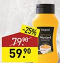
Горчица OBERON по-дижонски, Premium, 300 г, Болгария