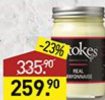
Майонез STOKES 345 г, Великобритания