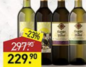
Вино PUENTE DORADO/ CAMPO DE FLORES белое, красное, полусладкое, сухое, 12%, 0,75 л