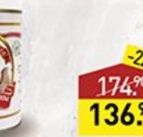
Паштет ROMEO ROSSI из черных оливок, из зеленых оливок, 180 г, Италия