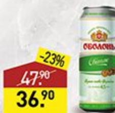
Пиво ОБОЛОНЬ светлое, 4,5%, 0,45 л