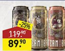
Пиво STEAM BREW Imperial Stout, Ipa, German red, 7,5-7,9%, 0,5 л, Германия