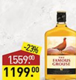
Виски THE FAMOUS GROUSE 40%, 0,5 л