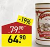
Грибы шампиньоны ПРИНЦЕССА ВКУСА резаные, 425 мл