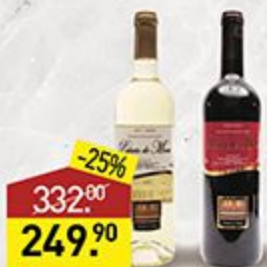
Вино PALACIO DE MORA белое, красное, сухое, 12%, 0,75 л