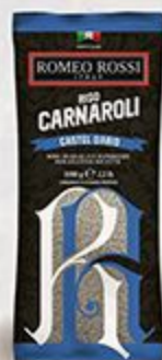
Рис ROMEO ROSSI карнарولي, 1 кг, Италия