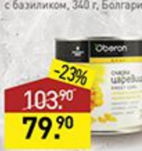
Кукуруза OBERON 340 г, Болгария