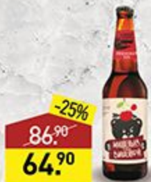
Пиво ВОЛКОВСКАЯ ПИВОВАРНЯ Мишенька под вишенкой, 0,45 л