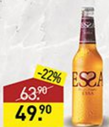
Напиток пивной ESSA ананас/грейпфрут, 5,2-6,5, 0,5 л