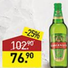
Пиво GUBERNIJOS экстра, светлое, фильтрованное, 5,5%, 0,5 л, Литва