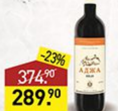
Вино АЖДА красное, полусладкое, 10-12%, 0,75 л