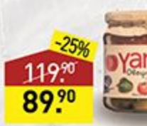
Овощи печеные YAN 455 г, Армения