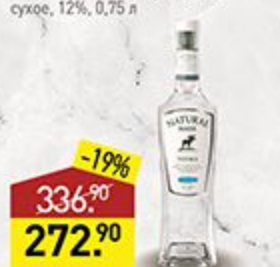
Водка NATURAL MARK spring, 40%, 0,5 л