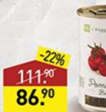
Помидоры IL VIAGGIATORE GOLOSO черри, 400 г, Италия