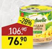
Кукуруза BONDUELLE 425 мл