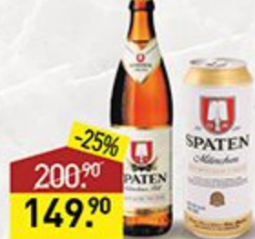
Пиво SPATEN Munche, 0,5 л