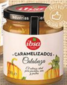
Лук/тыква карамелизированные IBSA Bierzo 240 г, Испания