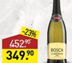
Напиток винный BOSKA Anniversary белый, сладкий, 7,5%, 0,75 л