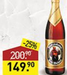
Пиво FRANZISKANER Weizen Hell, 0,5 л