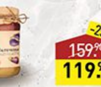
Икра баклажановая YAN 470 г, Армения