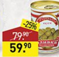
Оливки ПРИНЦЕССА ВКУСА без косточки, 300 мл