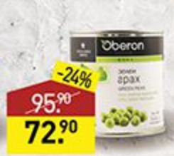
Горошек OBERON 400 г, Болгария