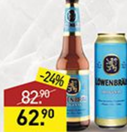
Пиво LOWENBRAU original, 0,45 л