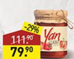
Адджика YAN 250 мл, Армения