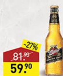
Напиток пивной MILLER 4,7%, 0,5 л