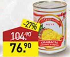
Ананасы ПРИНЦЕССА ВКУСА кусочки, 580 мл