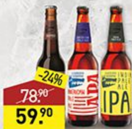
Пиво ВОЛКОВСКАЯ ПИВОВАРНЯ в ассортименте; 0,45 л