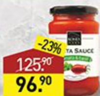
Соус томатный KONEX FOODS с базиликом, 340 г, Болгария