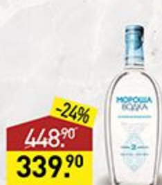
Водка МОРОША 40%, 0,5 л