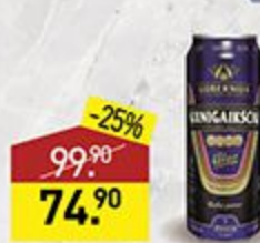
Пиво GUBERNIJOS темное, фильтрованное, 7%, 0,568 л, Литва