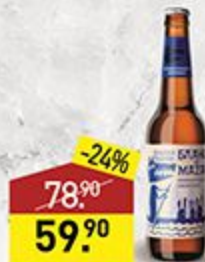
Пиво ВОЛКОВСКАЯ ПИВОВАРНЯ бланш де маза, 5,9%, 0,45 л