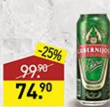
Пиво GUBERNIJOS экстра, светлое, фильтрованное, 5,5%, 0,5 л, Литва