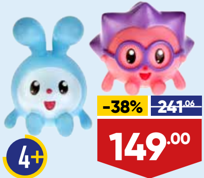
ИГРУШКА ИГРАЕМ ВМЕСТЕ, для купания, арт. 253399/253403/253402/25, плаستيоль