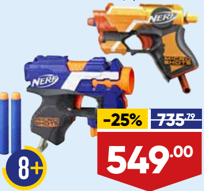
БЛАСТЕР NERF МИКРОШОТ, арт. E0489