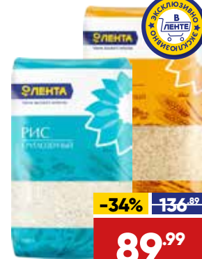
РИС ЛЕНТА , длиннозерный/круглозерный, 1,5 кг