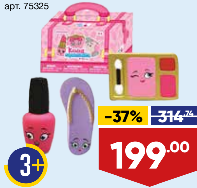
ИГРУШКА-АНТИСТРЕСС МЯГКАЯ KAWAII, арт. 75325