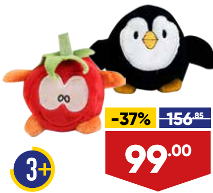
ИГРУШКА МЯГКАЯ ЗВЕРУШКА, 10 см