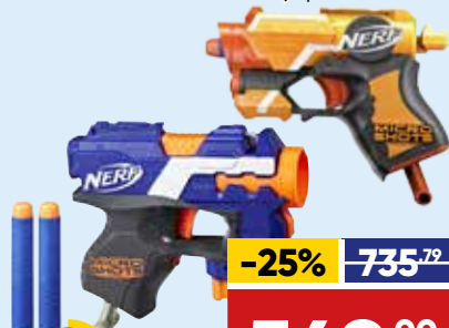
БЛАСТЕР NERF МИКРОШОТ, арт. E0489