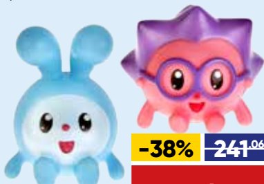
ИГРУШКА ИГРАЕМ ВМЕСТЕ, для купания, арт. 253399/253403/253402/25, плаستيоль