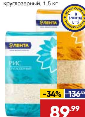
РИС ЛЕНТА , длиннозерный/круглозерный, 1,5 кг