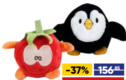
ИГРУШКА МЯГКАЯ ЗВЕРУШКА, 10 см