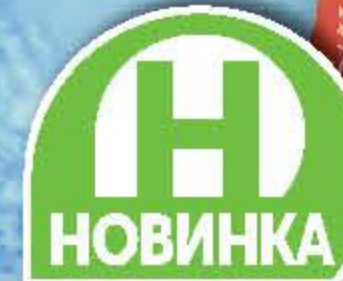
ЧИПСЫ ОВОЩНЫЕ КЮХНЕ в ассортименте, 75 г