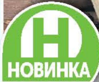
КАРТОФЕЛЬ ЖАРЕНый БРУТО ТАПАС/КРАФТ в ассортименте, 75/150 г