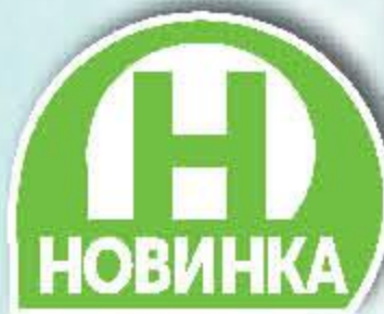
ТОНИК ЭВЕРВЕСС в ассортименте, 0,5/1 л