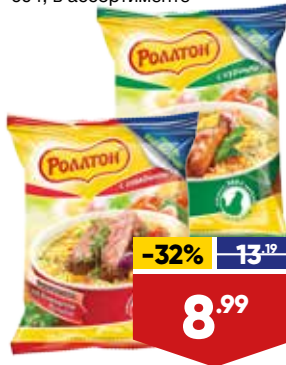
ВЕРМИШЕЛЬ РОЛЛТОН, на домашнем бульоне, быстрого приготовления, 60 г, в ассортименте