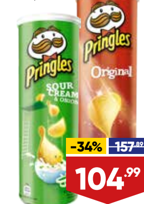
ЧИПСЫ PRINGLES, 165 г, в ассортименте