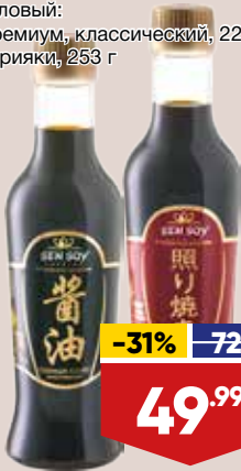
СОУС СОЕВЫЙ SEN SOY, столовый: - премиум, классический, 220 г - терияки, 253 г