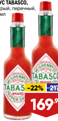
СОУС TABASCO, острый, перечный, 60 мл