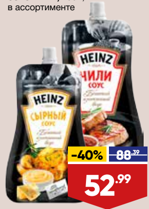
СОУС HEINZ, 230 г, в ассортименте