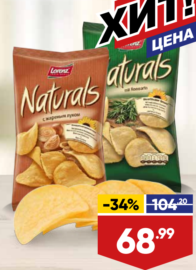
ЧИПСЫ LORENZ NATURALS, 100 г, в ассортименте