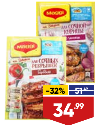
СМЕСЬ MAGGI НА ВТОРОЕ, 26-47 г, в ассортименте