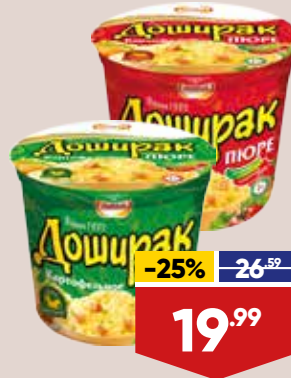
ПЮРЕ КАРТОФЕЛЬНОЕ ДОШИРАК, быстрого приготовления, 40 г, в ассортименте