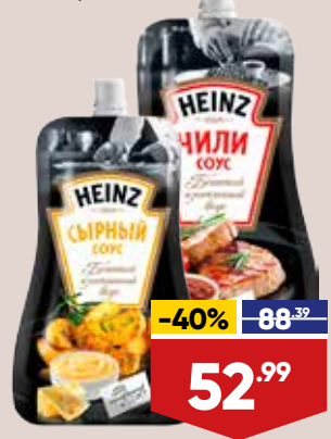
СОУС HEINZ, 230 г, в ассортименте