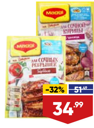
СМЕСЬ MAGGI НА ВТОРОЕ, 26-47 г, в ассортименте