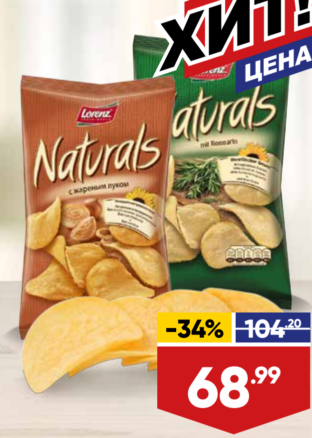
ЧИПСЫ LORENZ NATURALS, 100 г, в ассортименте