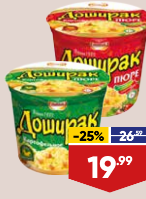
ПЮРЕ КАРТОФЕЛЬНОЕ ДОШИРАК, быстрого приготовления, 40 г, в ассортименте