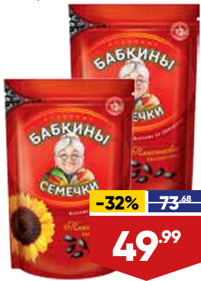
СЕМЕЧКИ БАБКИНЫ СЕМЕЧКИ, обжаренные, 270 г