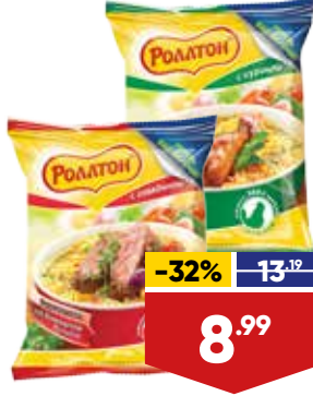
ВЕРМИШЕЛЬ РОЛЛТОН, на домашнем бульоне, быстрого приготовления, 60 г, в ассортименте