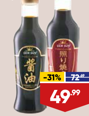
СОУС СОЕВЫЙ SEN SOY, столовый: - премиум, классический, 220 г - терияки, 253 г