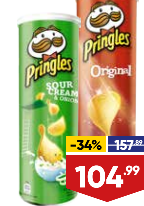
ЧИПСЫ PRINGLES, 165 г, в ассортименте