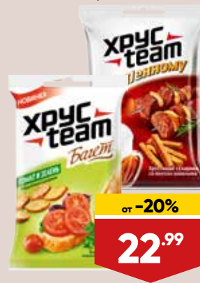
СУХАРИКИ ХРУСТЕАМ, 60-90 г, в ассортименте