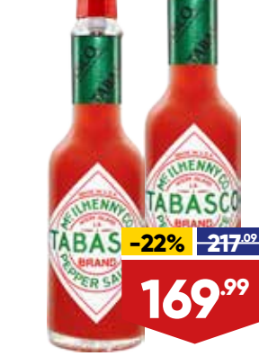
СОУС TABASCO, острый, перечный, 60 мл