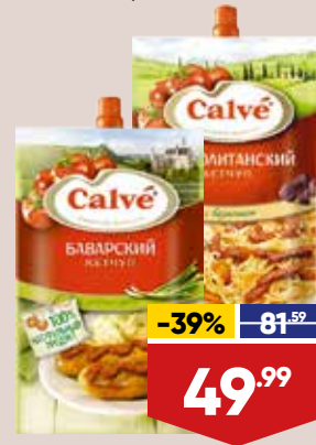
КЕТЧУП CALVÉ, 350 г, в ассортименте