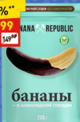
КОНФЕТЫ BANANA REPUBLIC банан сушен. в шок. глаз., 200 г