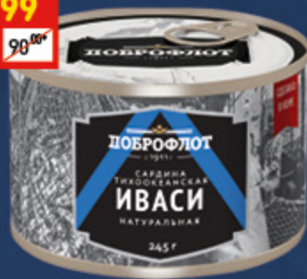
САРДИНА ТИХООКЕАНСКАЯ ИВАСИ «Доброфлот», 245 г