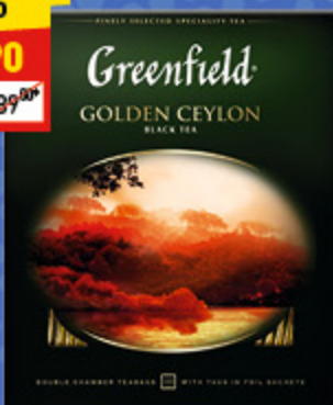
ЧАЙ GREENFIELD Golden Ceylon, лист., 200 г