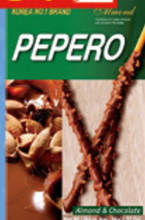
СОЛОМКА В ШОКОЛАДНОЙ ГЛАЗУРИ с миндалем «Альмонд Пеперо», 36 г