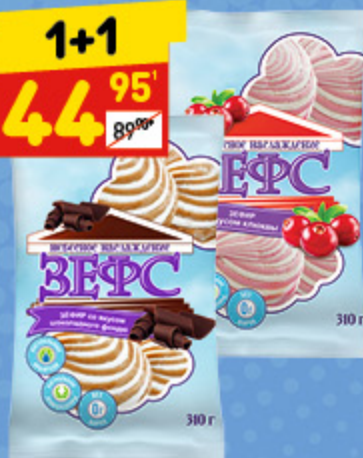
ЗЕФИР «ЗЕФФ» В асс.: шок. фондю, клюква, 310 г