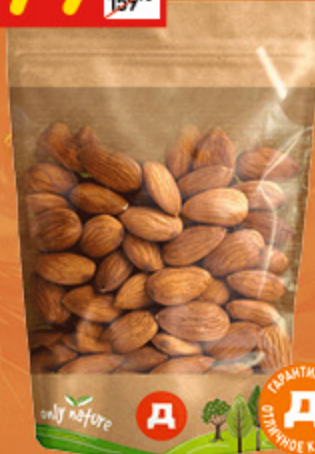
МИНДАЛЬ ЖАРЕННЫЙ «ВОСТОЧНЫЙ КАЛЕЙДОСКОП» 100 г