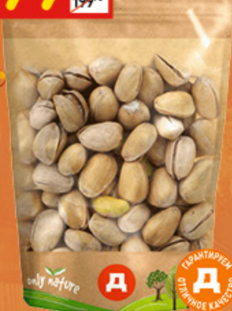
ФИСТАШКИ ЖАРЕННЫЕ «ВОСТОЧНЫЙ КАЛЕЙДОСКОП» сол., 150 г