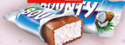
КОНФЕТЫ BOUNTY вес., 100 г