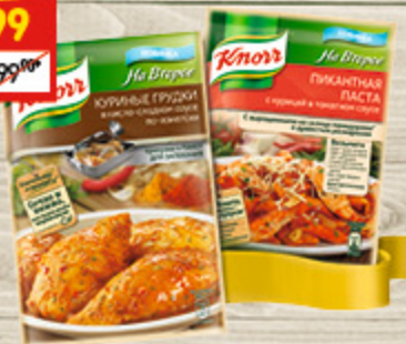
ПРИПРАВЫ KNORR «Куриная грудка по-азиатски», 28 г + пикантная паста, 27 г