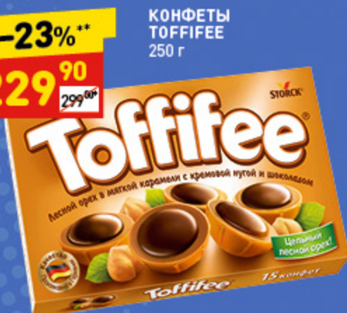
КОНФЕТЫ TOFFIFEE 250 г

* цена за 1 шт. при покупке 2 шт. одновременно