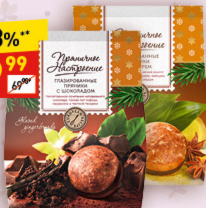
ПРЯНИКИ «ПРЯНИЧНОЕ НАСТРОЕНИЕ» в асс.: шок. в глаз, имбир. в глаз., 240 г