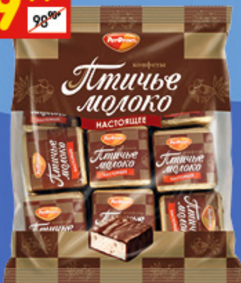
КОНФЕТЫ «ПТИЧЬЕ МОЛОКО» сливочно-ванильные, 225 г