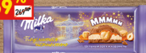
ШОКОЛАД МІЛКА с мол., карам. нач. и фундуком, 300 г