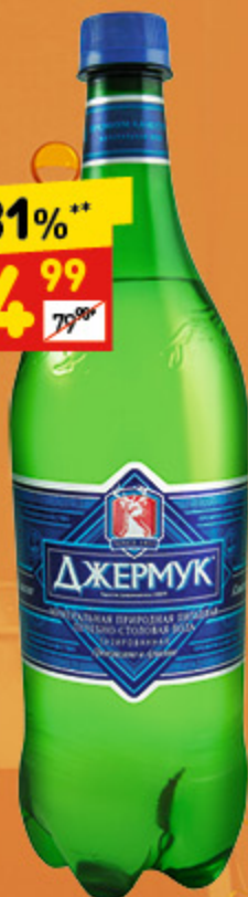
ВОДА МИНЕРАЛЬНАЯ «Джермук», газ., л/б, 1 л