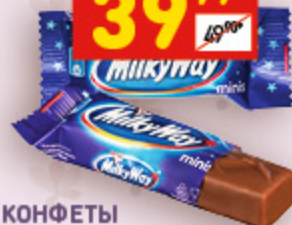
КОНФЕТЫ MILKY WAY MINIS шокол. батончики с суфле, вес., 100 г