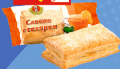
СЛОЙКА С САХАРОМ «Первый ХК», упак., 50 г