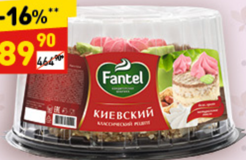
ТОРТ «КИЕВСКИЙ» «Фантель», 800 г