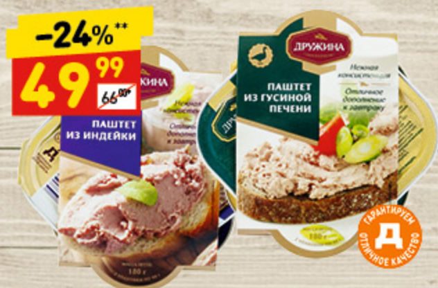
ПАШТЕТ «ДРУЖИНА» в асс.: из гусиной печени, из индейки, 2 x 90 г