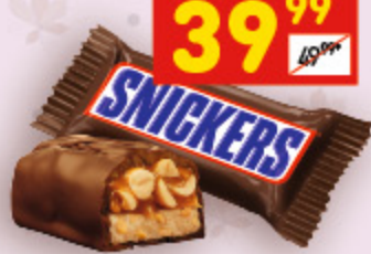
КОНФЕТЫ SNICKERS MINIS шок. батончик, вес., 100 г