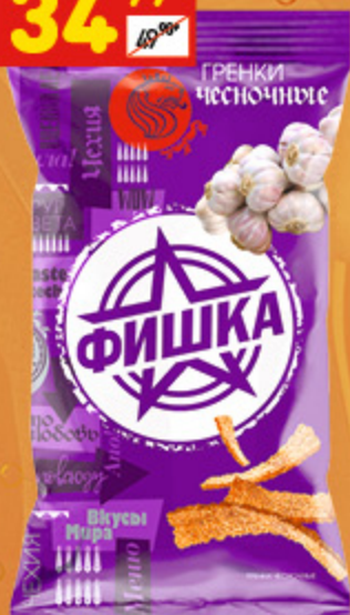
ГРЕНКИ «ФИШКА» чесночные, 120 г