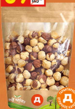
ФУНДУК ЖАРЕННЫЙ «ВОСТОЧНЫЙ КАЛЕЙДОСКОП» 80 г