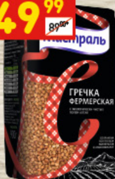
ГРЕЧКА «МИСТРАЛЬ» «Фермерская», 900 г