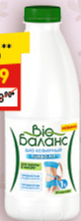
БИОПРО- ДУКТ КИСЛО- МО- ЛОЧНЫЙ «Био-баланс кефирный», 0,1%, 930 г