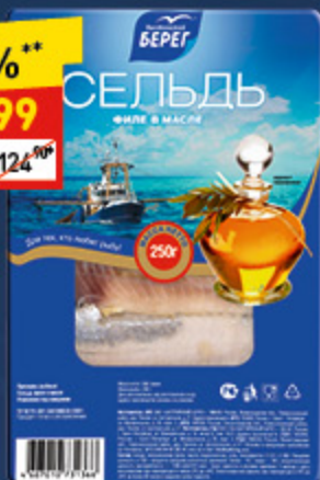
СЕЛЬДЬ «БАЛТИЙСКИЙ БЕРЕГ» филе в масле, м/вак., 250 г