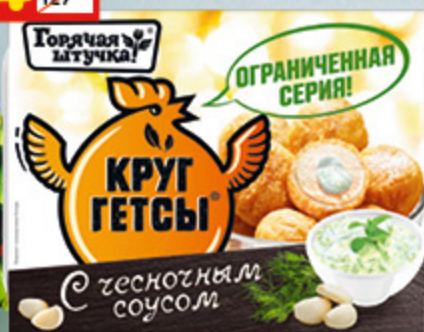
КРУГЕТСЫ «ГОРЯЧАЯ ШТУЧКА» с чесноч. соусом, 250 г