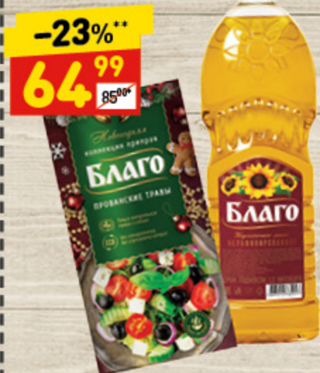
МАСЛО «БЛАГО» подс. нераф., 0,65 л + подарок приправа 1 шт.