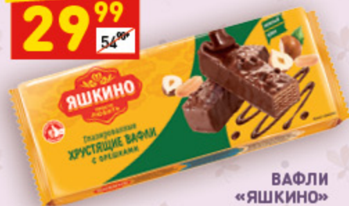
ВАФЛИ «ЯШКИНО» глазированные с орешками, 200 г