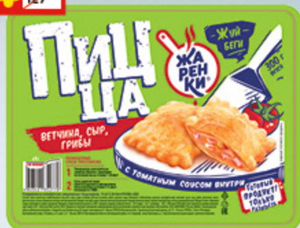
ПИЦЦА «ЖАРЕНКА» «Морозко», 300 г