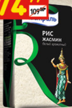
РИС ЖАСМИН «МИСТРАЛЬ» 500 г