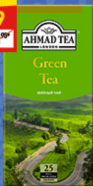
ЧАЙ AHMAD TEA зел., пак., 25 x 2 г, 50 г