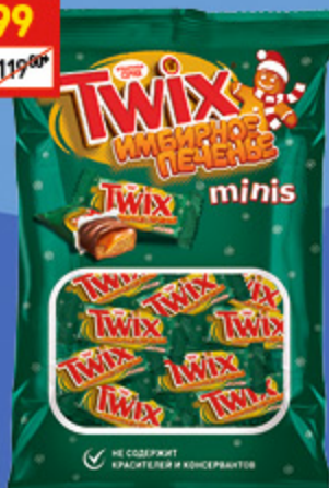
КОНФЕТЫ TWIX MINIS имбир. печенье, 184 г