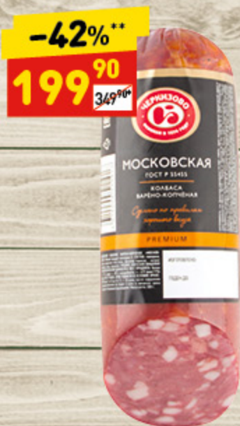
КОЛБАСА «МОСКОВСКАЯ» «ЧМПЗ», в/к, в/у, 500 г

Вы накрыли красивый и вкусный стол, но дрожите при мысли, что на столе осталось белое пятно — пустая тарелка? Подарите ей тепло, заботу и... вкусный гарнир. Украсьте ее аппетитной пастой, рисом или булгуром, порауйте и саму тарелку, и всю семью.