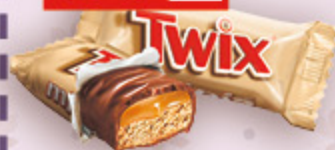
КОНФЕТЫ TWIX MINIS песочное печенье в шок., вес., 100 г