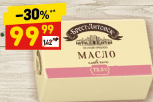
МАСЛО СЛИВОЧНОЕ «Брест-Литовск», 72,5%, 180 г