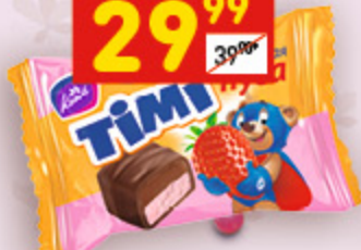
КОНФЕТЫ ТИМІ «Конти», клубничная нуга, вес., 100 г