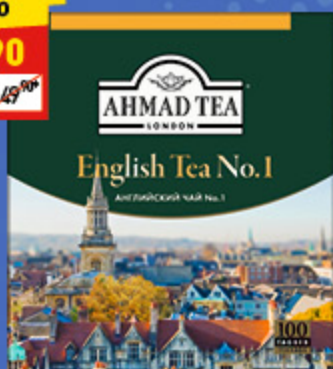
ЧАЙ AHMAD TEA английский №1, пак. 100 x 2 г, 200 г