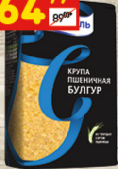
БУЛГУР «МИСТРАЛЬ» 500 г