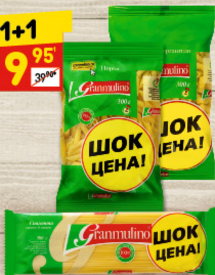
МАКАРОННЫЕ ИЗДЕЛИЯ в асс.: серпантин, перья, спагетти, 300 г