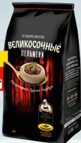
ПЕЛЬМЕНИ «ВЕЛИКОСОЧНЫЕ» «Сибирский гурман», 800 г