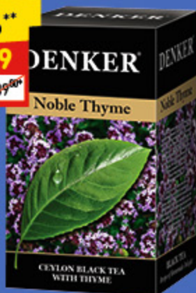
ЧАЙ DENKER NOBLE THYME CEYLON с чабрецом, пак. 20 x 2 г, 40 г