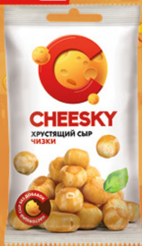
СЫР «CHEESKY» хрустящий, 46 г