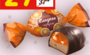
КОНФЕТЫ «СЛАДКОЕ СОЗВУЧИЕ» «Конти», апельсин в шок., вес., 100 г