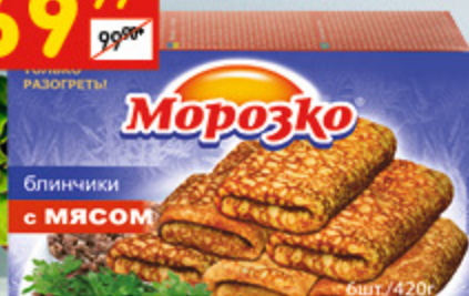
БЛИНЧИКИ «МОРОЗКО» с мясом, 420 г