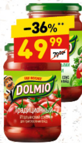
СОУС DOLMIO в асс.: итальянский традиционный, итальянский с ароматными травами, 210 г