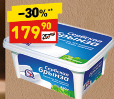
СЫР БРЫНЗА СЕРЕБСКАЯ 45%, 450 г