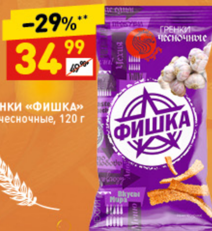
ГРЕНКИ «ФИШКА» чесночные, 120 г