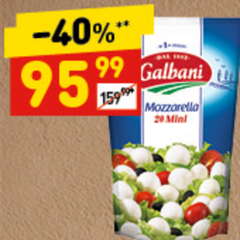
СЫР МОЦАРЕЛЛА ГАЛЬБАНИ МИНИ, 45%, 150 г