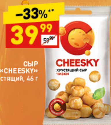
СЫР «CHEESKY» хрустящий, 46 г