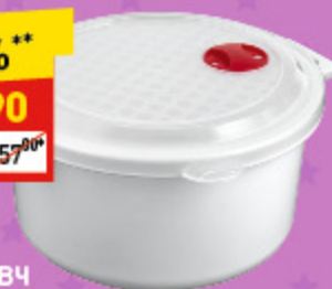
ЕМКОСТЬ ДЛЯ ХОЛОДИЛЬНИКА И СВЧ 1,8 л