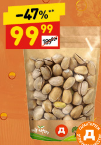
ФИСТАШКИ ЖАРЕННЫЕ «ВОСТОЧНЫЙ КАЛЕЙДОСКОП» сол., 150 г