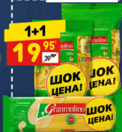
МАКАРОННЫЕ ИЗДЕЛИЯ в асс.: серпантин, перья, спагетти, 300 г