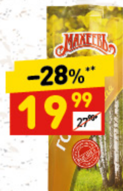
ГОРЧИЦА «РУССКАЯ» «Махеевъ», д/пак, 140 г