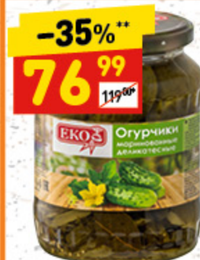
ОГУРЧИКИ «ЕКО» 6–9 см, маринованные, с/б, 680 г