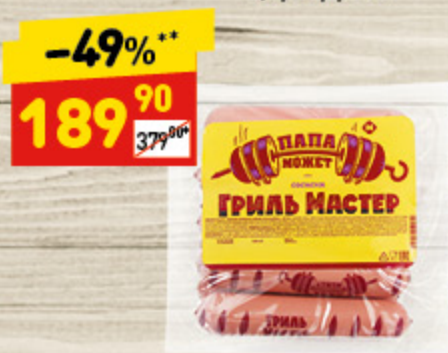
СОСИСКИ «ГРИЛЬ-МАСТЕР» «Пала может» «ОМПК», п/о, 940 г