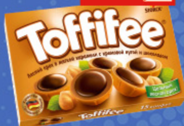
КОНФЕТЫ TOFFIFEE 250 г