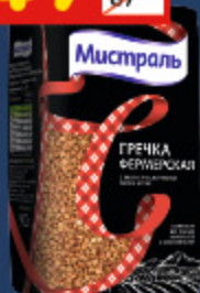
ГРЕЧКА «МИСТРАЛЬ» «Фермерская», 900 г