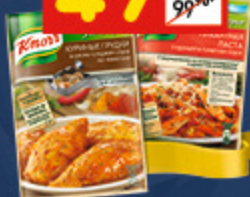
ПРИПРАВЫ KNORR «Куриная грудка по-азиатски», 28 г + пикантная паста, 27 г