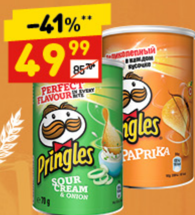
ЧИПСЫ PRINGLES в асс.: паприка, сметана-лук, 70 г