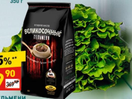
ПЕЛЬМЕНИ «ВЕЛИКОСОЧНЫЕ» «Сибирский гурман», 800 г

*Цена за 1 шт. при покупке 2 шт., одновременно