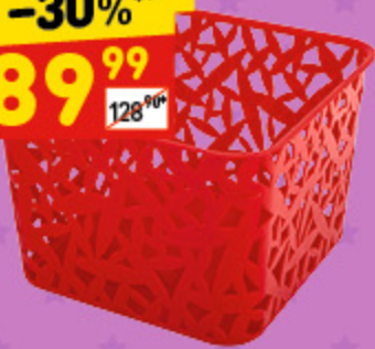
КОРЗИНКА УНИВЕРСАЛЬНАЯ XXL 205 x 205 x 145 мм