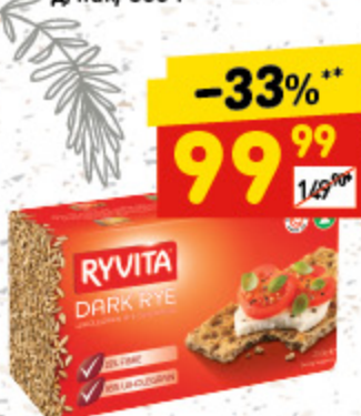
ХЛЕБЦЫ RYVITA мультизерновые, 250 г