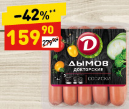
СОСИСКИ «ДЫМОВ» докторские, упак., 464 г