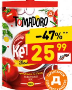
КЕТЧУП «Д» Tomadogo, томатный, д/пак, 300 г