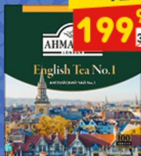
ЧАЙ АНМАД ТЕА английский №1, пак. 100 x 2 г, 200 г