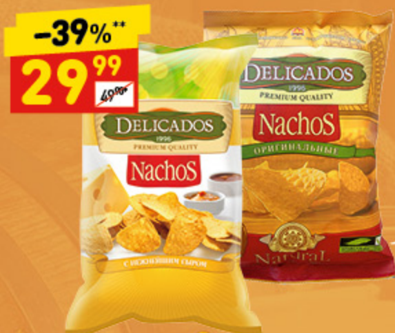
ЧИПСЫ КУКУРУЗНЫЕ NACHOS в асс.: сыр, оригинальные, 75 г