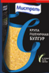
БУЛГУР «МИСТРАЛЬ» 500 г