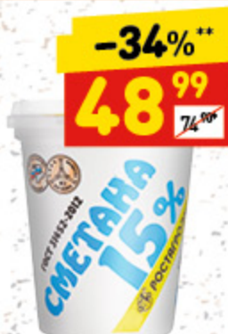
СМЕТАНА «РОСТАГРО-ЭКСПОРТ» 15%, п/ст, 320 г