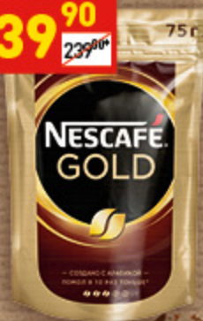
КОФЕ NESCAFE GOLD раств., м/у, 75 г