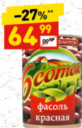
ФАСОЛЬ «6 СОТОК» красная, ж/б, 425 мл