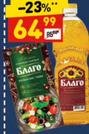
МАСЛО «БЛАГО» подс. нераф., 0,65 л + подарок приправа 1 шт.