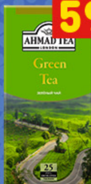
ЧАЙ АНМАД ТЕА зел., пак., 25 x 2 г, 50 г