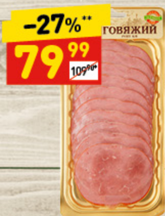
РУЛЕТ ГОВЯЖИЙ «ЕКФ» нар., 115 г

Вы накрыли красивый и вкусный стол, но дрожите при мысли, что на столе осталось белое пятно — пустая тарелка? Подарите ей тепло, заботу и... колбасу. Украсьте ее красивой мясной нарезкой, порадайте и саму тарелку, и всю семью.