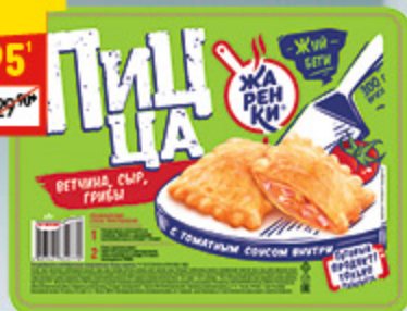
ПИЦЦА «ЖАРЕНКА» «Морозко», 300 г