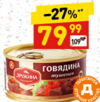
ГОВЯДИНА ТУШЕНАЯ «Дружина», в/с, ГОСТ, ж/б, 325 г