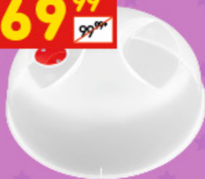
КРЫШКА ДЛЯ ХОЛОДИЛЬНИКА И СВЧ 250 мм