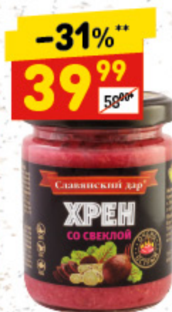
ХРЕН «СЛАВЯНСКИЙ ДАР» со свеклой, 160 г