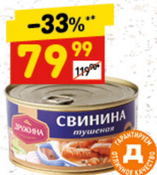
СВИНИНА ТУШЕНАЯ «Дружина», ГОСТ, ж/б, 325 г