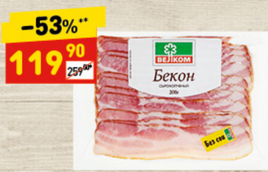
БЕКОН «ВЕЛКОМ» с/к, в/у, нар., 200 г