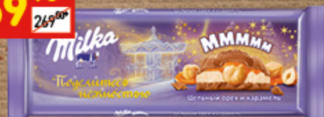
ШОКОЛАД МІЛКА с мол., карам. нач. и фундуком, 300 г