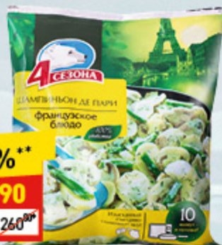
ГОТОВОЕ БЛЮДО «ШАМПИньОН ДЕ ПАРИ» «4 сезона», 600 г