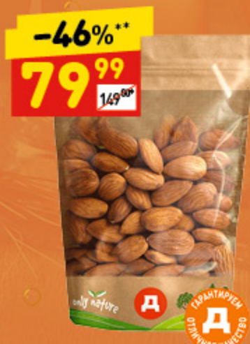
МИНДАЛЬ ЖАРЕННЫЙ «ВОСТОЧНЫЙ КАЛЕЙДОСКОП» 100 г