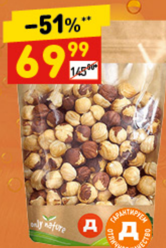
ФУНДУК ЖАРЕННЫЙ «ВОСТОЧНЫЙ КАЛЕЙДОСКОП» 80 г