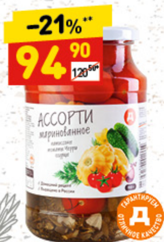
АССОРТИ «Д» патиссоны-черри-огурцы, с/б, 900 г