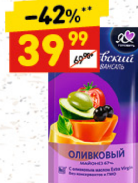
МАЙОНЕЗ «МОСКОВСКИЙ» оливковый, 67%, д/пак, 390/420 мл