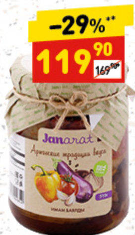
ЗАКРУТКИ «ИМАМ БАЯЛДЫ» из баклаж., Janarat, с/б, 510 г