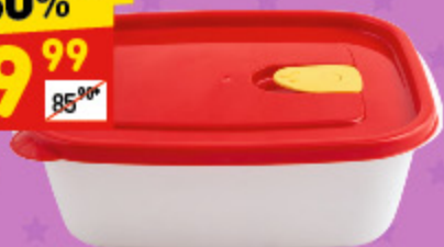
КОНТЕЙНЕР С КЛАПАНОМ 1,25 л