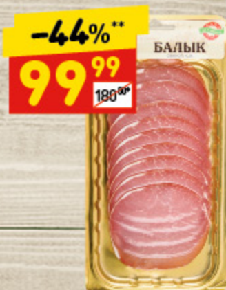
БАЛЫК СВИНОЙ «ПО-ЕГОРЬЕВСКИ» с/к, нар., 115 г