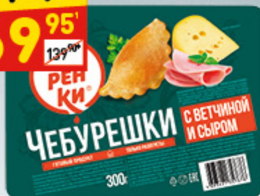
ЧЕБУРЕШКИ «ЖАРЕНКИ» с ветчиной и сыром, 300 г