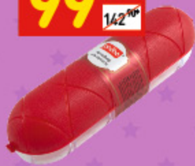
КОНТЕЙНЕР ДЛЯ КОЛБАСЫ