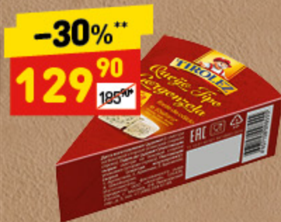
СЫР ГОРГОНЗОЛА TIROLEZ с голубой плесенью, 100 г