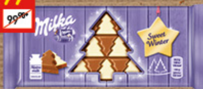
ШОКОЛАД МОЛОЧНЫЙ МІЛКА в форме елочек, 100 г