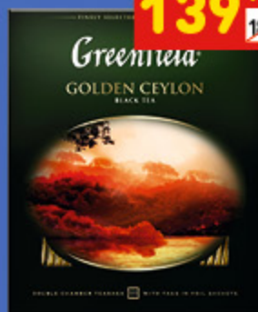
ЧАЙ GREENFIELD Golden Ceylon, лист., 200 г