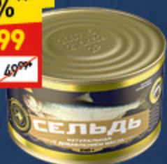
СЕЛЬДЬ «ЗНАК КАЧЕСТВА» с добавлением масла, ж/б, 240 г