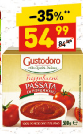
ПОМИДОРЫ «PASSATA GUSTODORO» протертые, 500 г