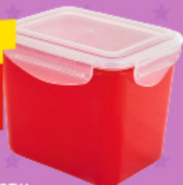
КОНТЕЙНЕР ДЛЯ ХОЛОДИЛЬНИКА И СВЧ 0,9 л