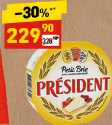
СЫР БРИ ПРЕЗИДЕНТ с белой плесенью, 60%, 125 г