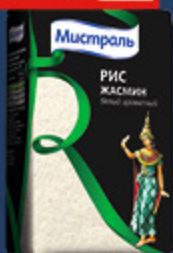
РИС ЖАСМИН «МИСТРАЛЬ» 500 г