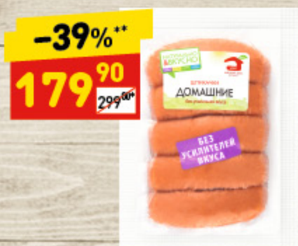
ШПИКАЧКИ «ДОМАШНИЕ» «МД Бородина», н/о, в/у, 480 г