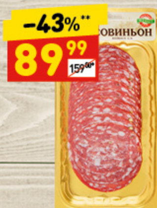
КОЛБАСА «СОВИНЬОН» «ЕКФ», с/к, нар., 100 г