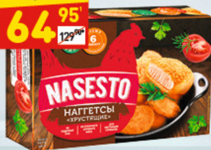
НАГГЕТСЫ NASESTO хрустящ., 300 г