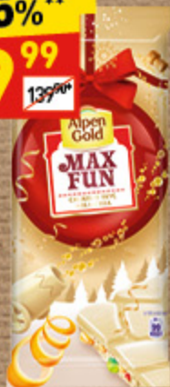
ШОКОЛАД ALPENGOLD MaxFun, вкус апельс., 160 г