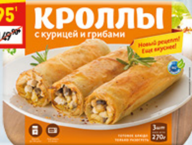
КРОЛЛЫ «ДОБРЫЕ СЪЕСТИ» с курицей и грибами, 270 г