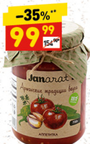
ОВОЩИ «АППЕТИТКА» консервир., Janarat, с/б, 720 г