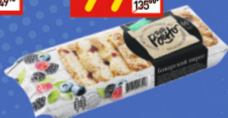
ПИРОГ «БАВАРСКИЙ» с фрукт. нач. клубн.-земл., 400 г