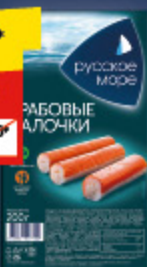
КРАБОВЫЕ ПАЛОЧКИ «Русское море», охл., в/у., 200 г