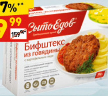
БИФСТЕКС ИЗ ГОВЯДИНЫ «Сытоедов» с карт. пюре, 350 г