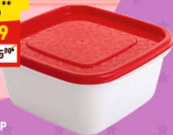
КОНТЕЙНЕР 1 л