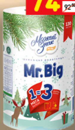
ПОЛОТЕНЦА БУМАЖНЫЕ MR. BIG «Мягкий знак», 2-сл., 1 шт