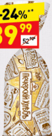
ХЛЕБ «ПЕЧЕРСКИЙ» подовый, «Дарница», 350 г