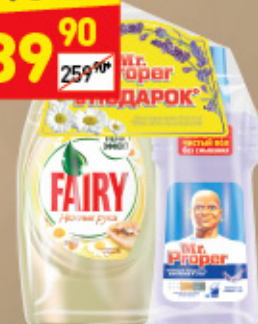
СРЕДСТВО ДЛЯ МЫТЬЯ ПОСУДЫ FAIRY ромашка и витамин Е, 900 мл + Mr. Proper, 500 мл