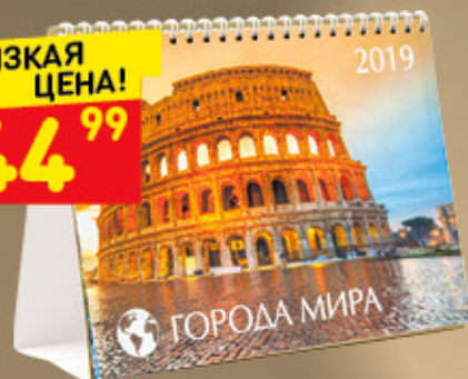
КАЛЕНДАРЬ ДОМИК большой 2019 г, 20 x 14 см