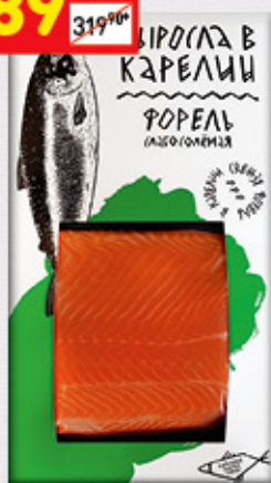
ФОРЕЛЬ «КАРЕЛИАН» х/к, кусок, 150 г