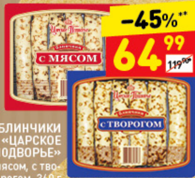
БЛИНЧИКИ «ЦАРСКОЕ ПОДВОРЬЕ» в асс.: с мясом, с тво- рогом, 360 г