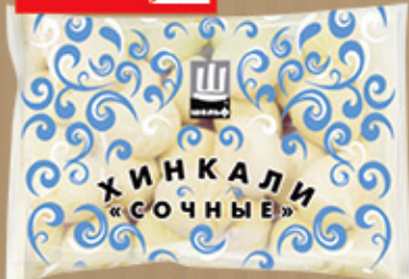
ХИНКАЛИ «СОЧНЫЕ» «Шельф», 1 кг