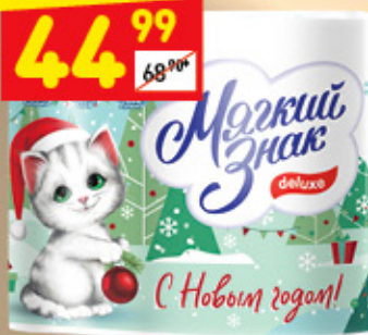
ТУАЛЕТНАЯ БУМАГА DELUXE «Мягкий знак», белая, 4 шт.