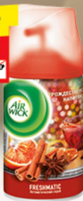
ОСВЕЖИТЕЛЬ ВОЗДУХА AIRWICK рождест. напиток, 250 мл