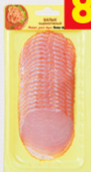
БАЛЫК «Иней», с/к, в/у, нар., 100 г