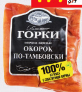
ОКОРОК «ПО-ТАМБОВСКИ» «Ближние горки», к/в, в/у, 350 г