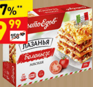
ЛАЗАНЬ БОЛОНЬЕЗЕ «СытоЕдов», 350 г