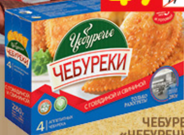
ЧЕБУРЕКИ «ЧЕБУРЕЧЬЕ» с говядиной и свиной, 280 г