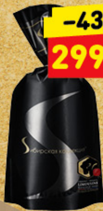
ПЕЛЬМЕНИ «РУССКИЕ» «Сибирская коллекция», 800 г