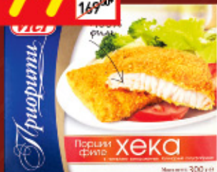
ХЕК ФИЛЕ VICI в панировке, зам., 300 г