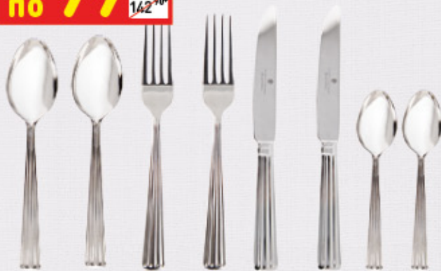
НАБОР СТОЛОВЫХ ПРИБОРОВ VALENTIN YUDASHKIN в асс.: ст. ложки, ч. ложки, вилки, ножи, 2 шт.