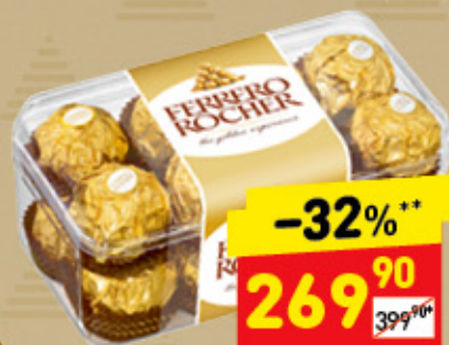
КОНФЕТЫ FERRERO ROCHER пл/кор., 200 г