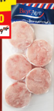
ХЕК МЕДАЛЬОНЫ «ВкусАрт», зам., 500 г