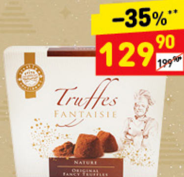
КОНФЕТЫ ТРЮФЕЛЬ FANTAISIE NATURE Chocmod, 150 г