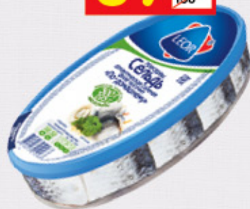
СЕЛЬДЬ «ПО-ДОМАШНЕМУ» Leor, филе-кусочки, 300 г