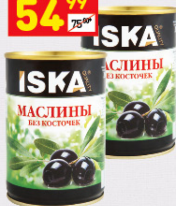
МАСЛИНЫ ЧЕРНЫЕ ISKA в асс.: б/к, с/к, 300 мл