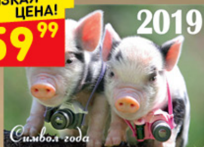
КАЛЕНДАРЬ НАСТЕННЫЙ перекидной 2019 г, 25 x 35 см