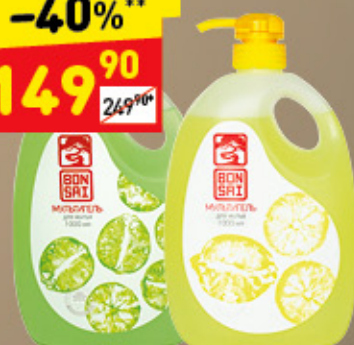
СРЕДСТВО ДЛЯ ПОСУДЫ VONSAI в асс.: японский лимон, лайм, 1 л