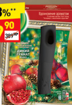
АВТОМ. РАСПЫ- ЛИТЕЛЬ AIRWICK дикий гра- нат, 250 мл