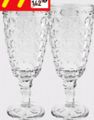
НАБОР 2 БОКАЛА ДЛЯ ШАМПАНСКОГО «ВЕНЕЦИЯ»