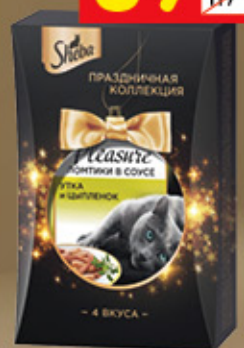
КОНСЕРВЫ SHEVA набор «Праздничная коллекция», 4 x 85 г, 340 г