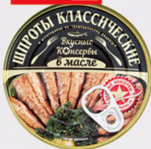
ШПРОТЫ В МАСЛЕ «Вкусные консервы», ж/б, 160 г