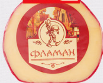
СЫР «ФЛАМАН» 50%, ½ шара, фас., вес., цена за 100 г