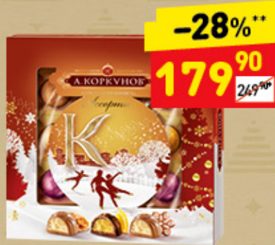
КОНФЕТЫ «А. КОРКУНОВ» «Ассорти», 120 г