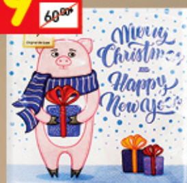
САЛФЕТКИ БУМАЖНЫЕ BOUQUET ORIGINAL 2-сл., 33 x 33 см, 20 шт.