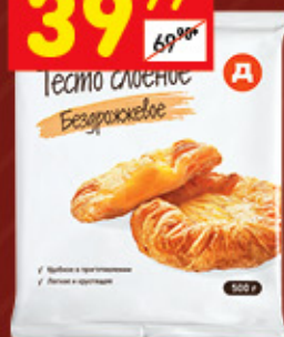
ТЕСТО «Д» слоеное, б/дрож., зам., 500 г