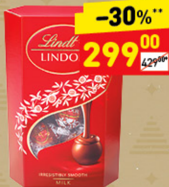
КОНФЕТЫ LINDT LINDOR с молочной начинкой, 200г