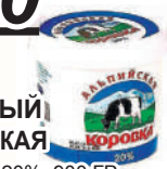
ПРОДУКТ СМЕТАННЫЙ "АЛЬПИЙСКАЯ КОРОВКА" 20%, 900 ГР