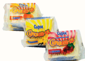
СЫРОК "СЫРКАЕШ-КА" В АССОРТ., 16%, 100 ГР