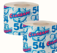
ТУАЛЕТНАЯ БУМАГА "НЕВСКИЙ СТАНДАРТ 54", 1 ШТ.