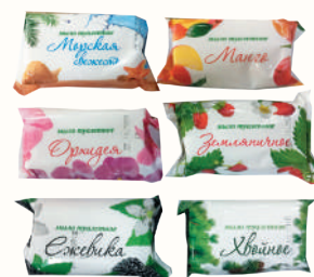
МЫЛО ТУАЛЕТНОЕ В АССОРТИМЕНТЕ, 100 ГР