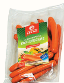
СОСИСКИ "ЕЛИСЕЕВСКИЕ" ОХЛ., ВНМД, 1 КГ