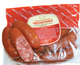
КОЛБАСА "ЧЕСНОЧНАЯ" П/К, АНКОМ, 1 КГ