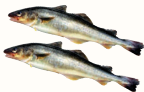
НАВАГА С/Г С/М, 1 КГ