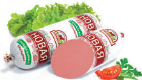
КОЛБАСА "НОВАЯ" САВА, ВАР., 1 КГ