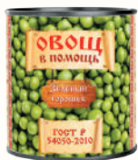
ГОРОШЕК ЗЕЛЕНый "ОВОЩ В ПОМОЩЬ", 310 ГР