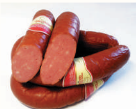
КОЛБАСА "ОДЕССКАЯ" П/К, АНКОМ, 1 КГ