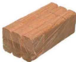
БРИКЕТЫ ТОПЛИВНЫЕ 1 УП. X 12 ШТ.