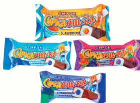
СЫРОК ГЛАЗИРОВАННЫЙ "СЫРКАЕШ-КА" В АССОРТ., 23%, 40 ГР