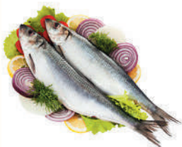
СЕЛЬДЬ АТЛАНТИЧЕСКАЯ С/С ЖИРНАЯ, 1 КГ