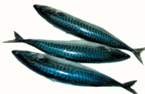
СКУМБРИЯ АТЛАНТИЧЕСКАЯ С/М, 1 КГ