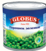
ГОРОШЕК ЗЕЛЕНый "ГЛОБУС", 400 ГР