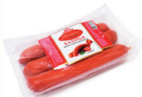
КОЛБАСА "КАЗАЧЬЯ" П/К, АТЯШЕВО, 400 ГР