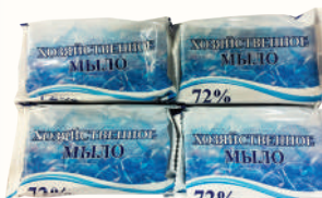
МЫЛО ХОЗЯЙСТВЕННОЕ ТВЕРДОЕ УНИВЕРСАЛЬНОЕ 72%, 100 ГР