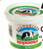
ПРОДУКТ СМЕТАННЫЙ "АЛЬПИЙСКАЯ КОРОВКА" 15%, 900 ГР