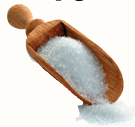
САХАРНЫЙ ПЕСОК, 1 КГ