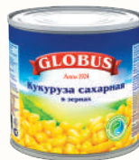
КУКУРУЗА СЛАДКАЯ В ЗЕРНАХ "ГЛОБУС", 340 ГР