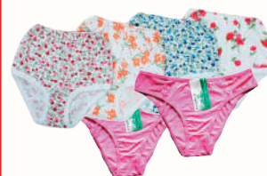
ТРУСЫ ЖЕНСКИЕ, В АССОРТИМЕНТЕ, 1 ШТ.