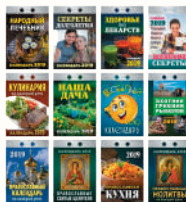
КАЛЕНДАРЬ ОТРЫВНОЙ В АССОРТИМЕНТЕ НА 2019 Г., 1 ШТ.