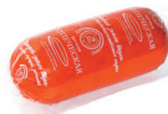
ВЕТЧИНА "КУПЕЧЕСКАЯ" ВАР., ИНЕЙ, 400 ГР