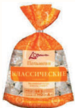
ПЕЛЬМЕНИ "ДРОНИЧИ" КЛАССИЧЕСКИЕ 900 ГР