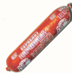
СЕРВЕЛАТ "НАРОДНЫЙ" ЕВРОКОМ, В/К, 1 КГ