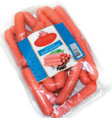
СОСИСКИ "ДОРОЖНЫЕ" ОХЛ., АТЯШЕВО, 1 КГ