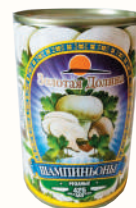
ШАМПИНЬОНЫ "ЗОЛОТАЯ ДОЛИНА" КОНСЕРВИРОВАННЫЕ, 425 МЛ