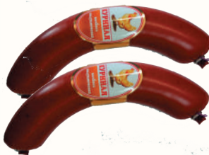
КОЛБАСА "КУРИНАЯ" П/К, СОВАД, 200 ГР