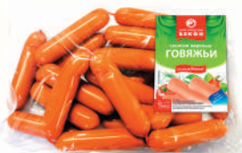
СОСИСКИ "ГОВЯЖЬИ" ВНМД, ОХЛ., 1 КГ