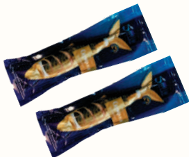
СКУМБРИЯ Х/К "5 ОКЕАНОВ", 250 ГР