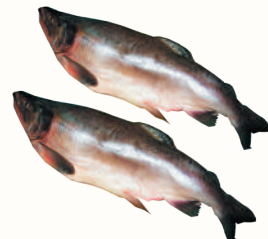
ГОРБУША ДАЛЬНЕВОСТОЧНАЯ П/Г С/М, 1 КГ