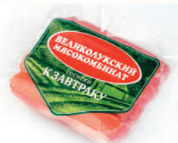
СОСИСКИ ВАРЕННЫЕ "К ЗАВТРАКУ" ВЛКМ, 330 ГР