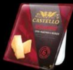
Сыр Пармезан CASTELLO REGGIANIDO®

Сыр Пармезан Castello Reggianido 33%, 150 г