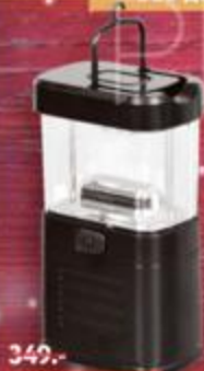
349 199 00 Фонарь кемпинговый Лампа, Boy Scout, 11 светодиодов