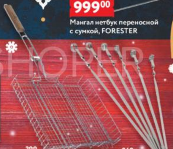
399 199 00 Решетка-гриль с антипригарным покрытием, 55(+3)x31x24x6 см