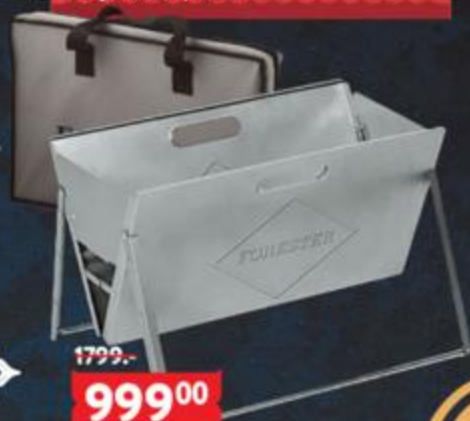
1799 999 00 Мангал нетбук переносной с сумкой, FORESTER