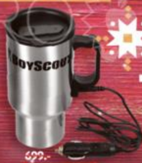
699 399 00 Термокружка автомобильная, 450 мл