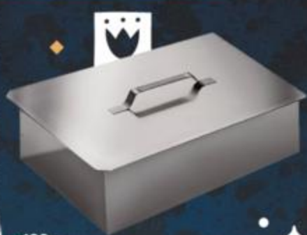
699 499 00 Коптильня PROЖарка двухъярусная