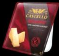
Сыр Пармезан CASTELLO REGGIANIDO®

Пармезан в качестве аперитива идеально подавать с охлажденным вином Просекко.