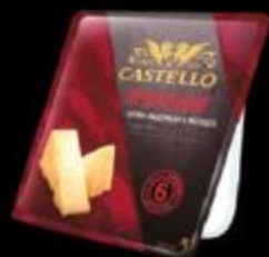
Сыр Пармезан CASTELLO REGGIANIDO®

Пармезан в качестве аперитива идеально подавать с охлажденным вином Просекко.