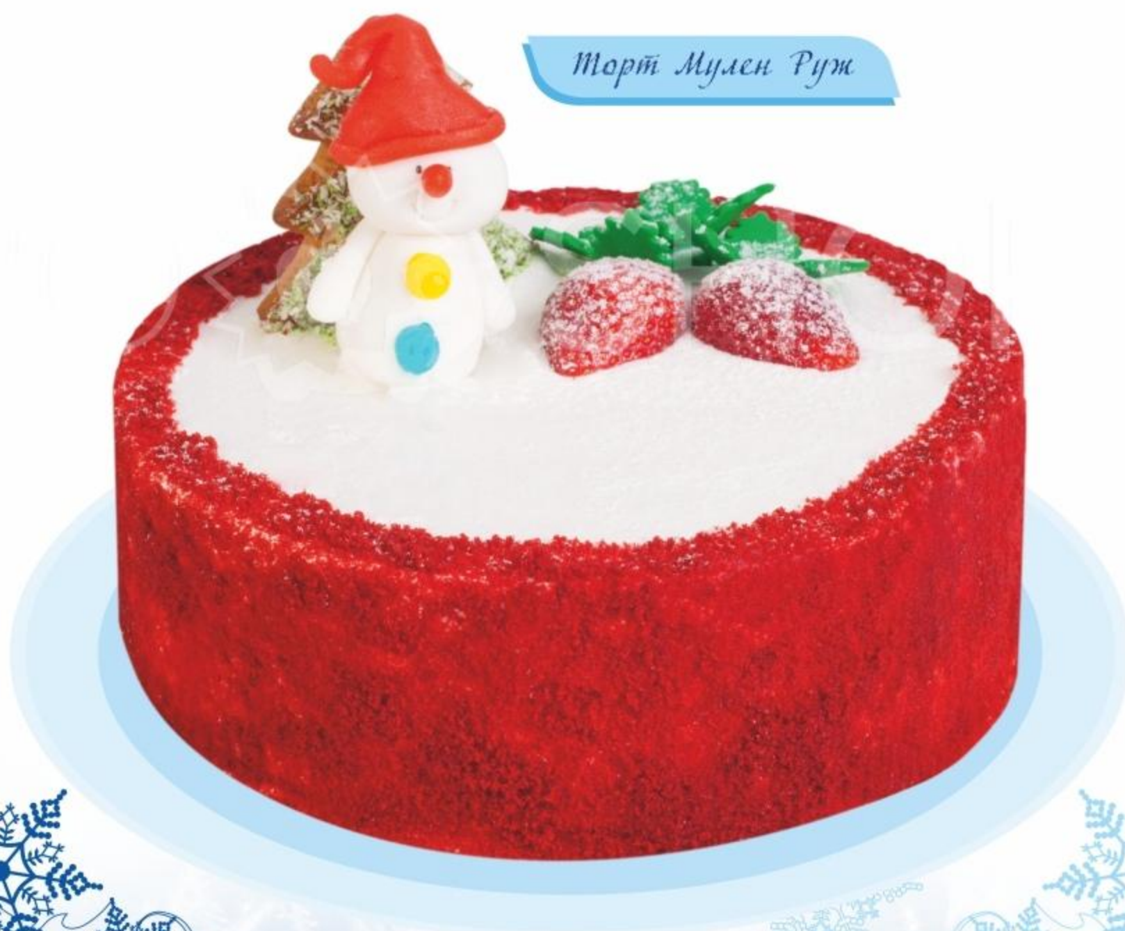
Торт Мулен Руж

Шоколадный и классический бисквит с прослойками из нежного йогуртового крема, йогурта и клубничного варенья. Новогоднее оформление торта, представленное в виде снеговика, имбирной елочки и свежей клубники, не оставит равнодушными даже самых маленьких сладкоежек.