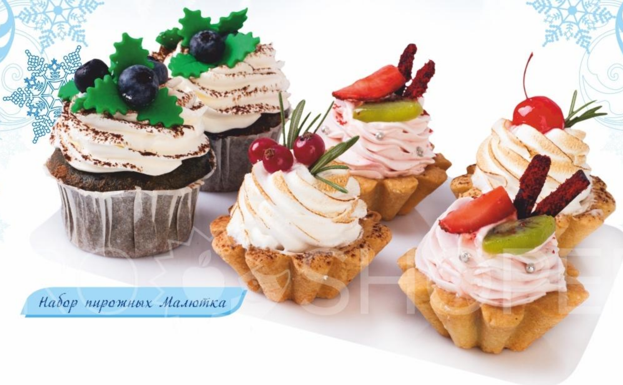
Набор пирожных Малютка