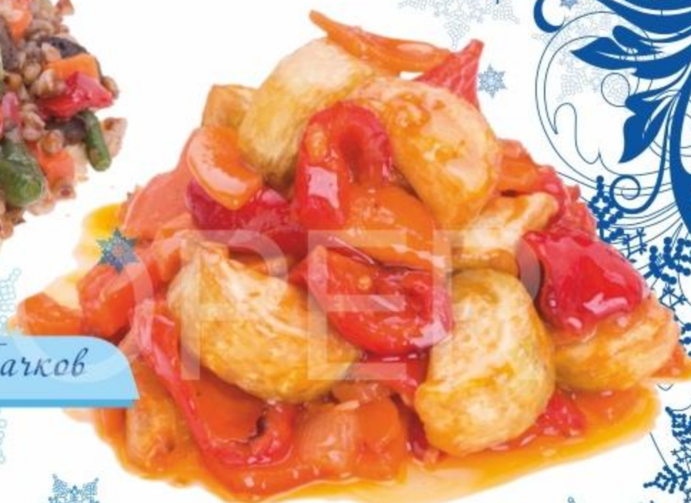
Рагу из Кабачков