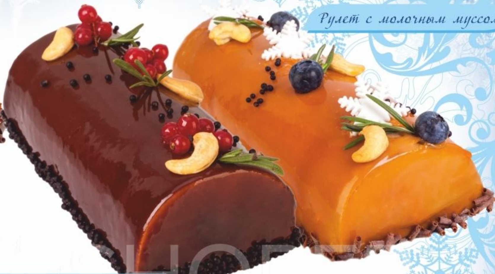
Рулет с шоколадным муссом