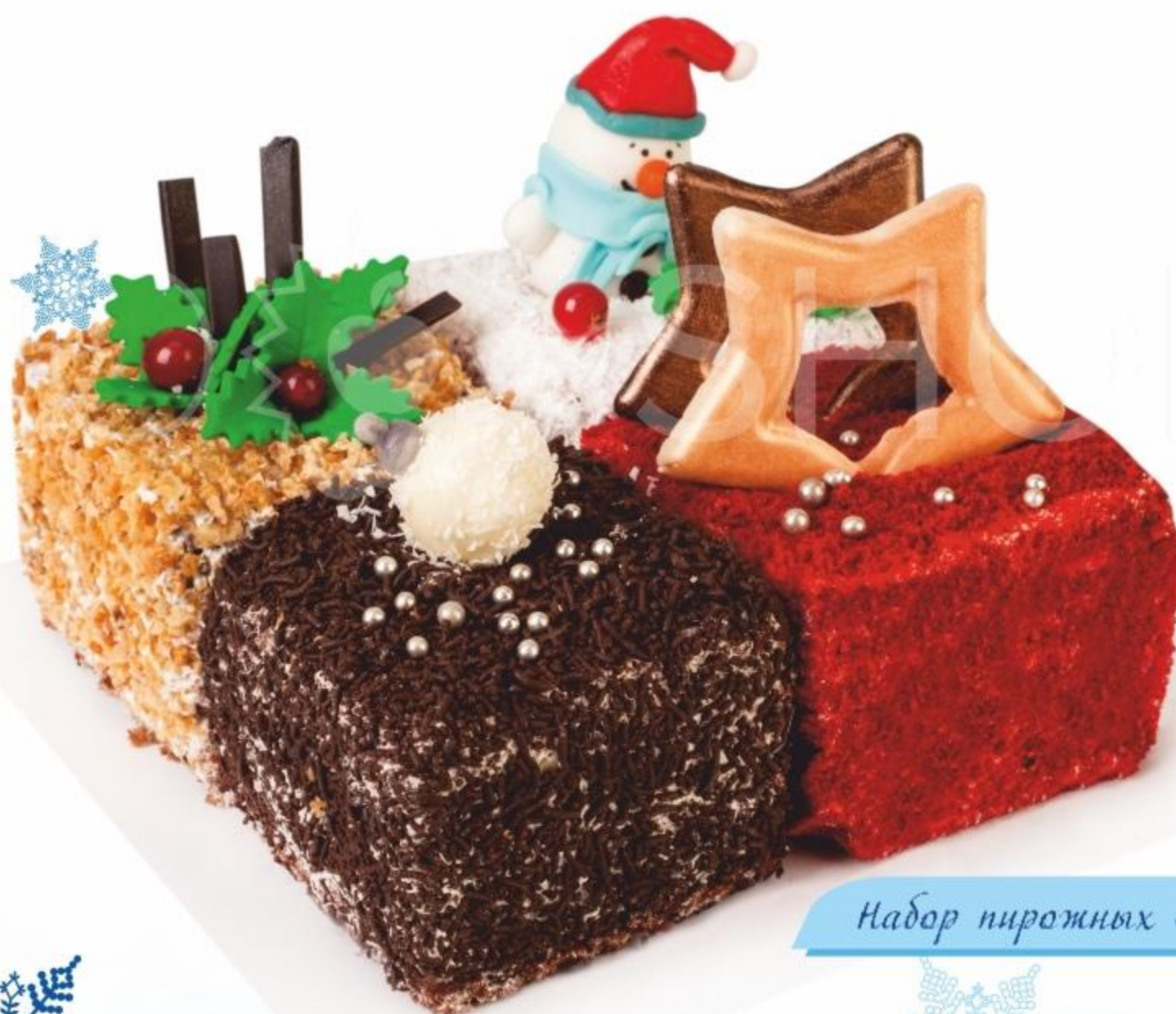
Набор пирожных Сладкоежка