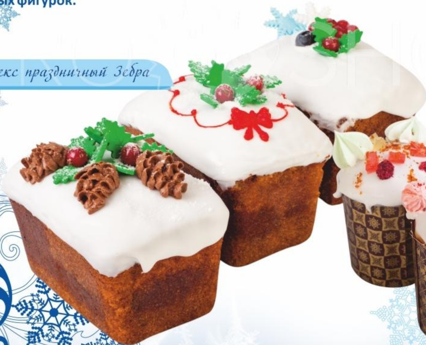
Кекс праздничный Зебра