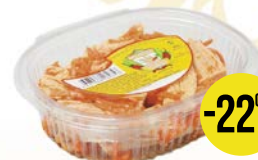
Салат КОРЕЯНА , Морковь по-корейски, 500 г