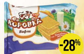
Вафли КОРОВКА, Глазированные, 50 г