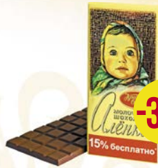
Шоколад молочный АЛЕНКА, с разноцветным драже/ Много молока/ С фундуком/Классический, 100 г