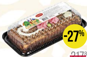
Печенье ДЕНЬ И НОЧЬ (Конти), 100 г