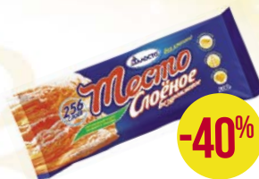
Тесто слоеное БЕЗ ХЛОПОТ , дрож- жевое (Талосто), 500 г