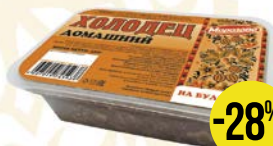
РУССКИЙ ХОЛОДЕЦ Говядина- свинина (Продтехнологии), 250 г